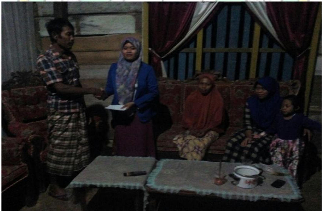
Sumber Data : Dokumentasi Hasil Wawancara Bersama Ibu RM Tgl. 11 Juli 201