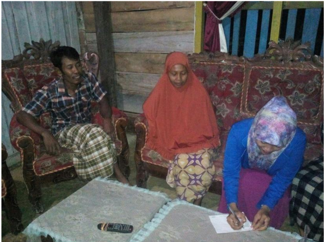
Sumber Data : Dokumentasi Hasil Wawancara Bersama Ibu RM Tgl. 11 Juli 2017.