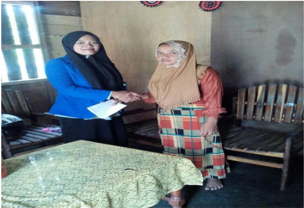
Sumber Data : Dokumentasi Hasil Wawancara Bersama Ibu RM Tgl. 15 Juli 2017.