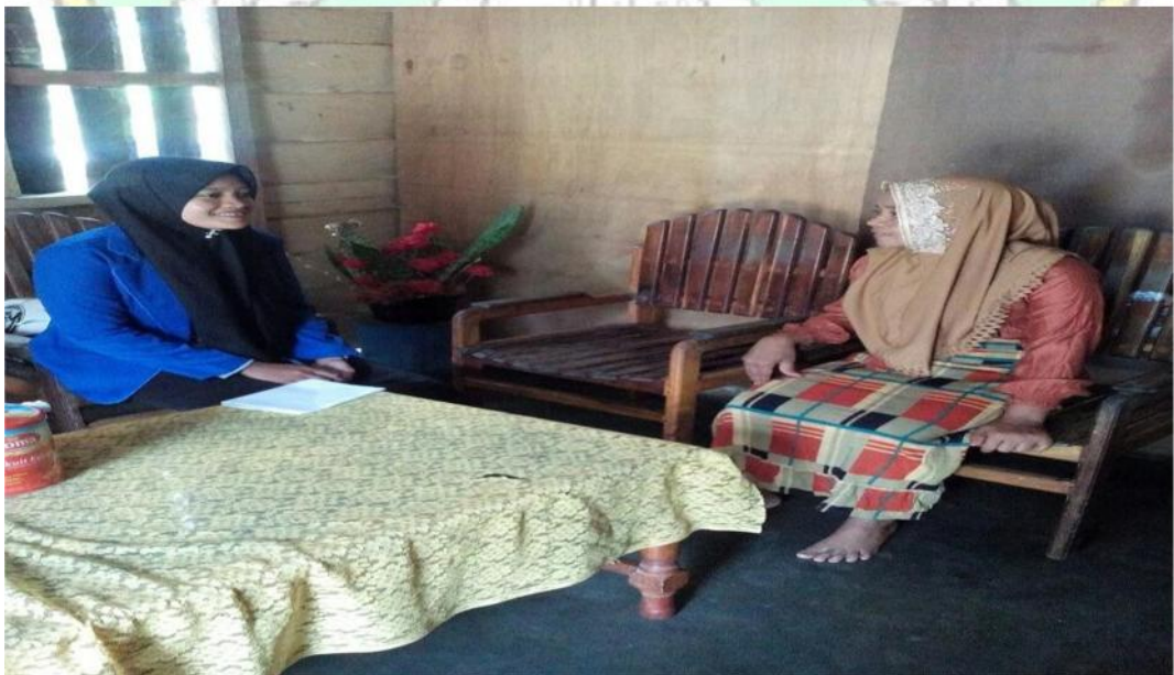
Sumber Data : Dokumentasi Hasil Wawancara Bersama Ibu RM Tgl. 15 Juli 2017.