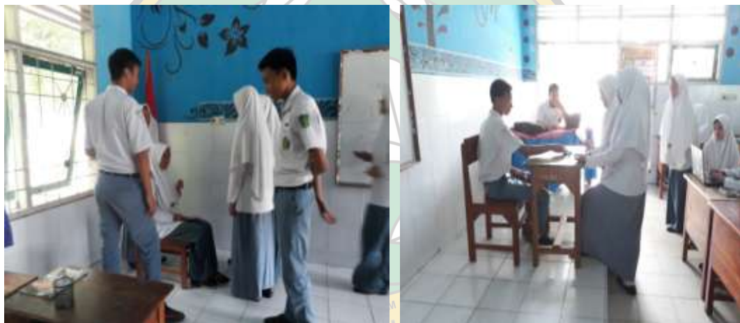
( Penerapan Model Role Playing)