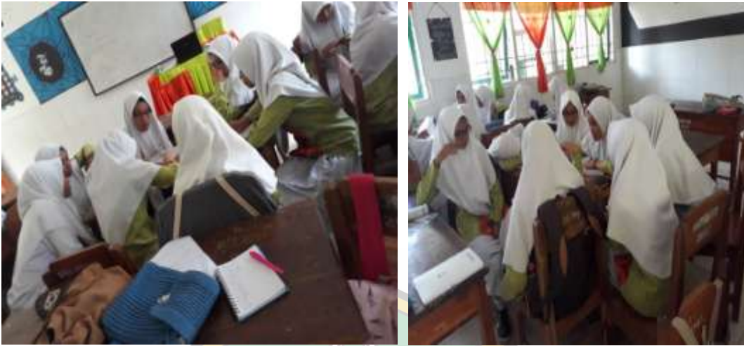
( Penerapan Model Problem Based Learning)