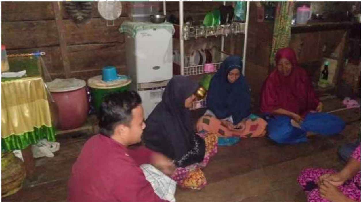
Gambar, bersama dengan ibu-ibu yang menikah diusia dini