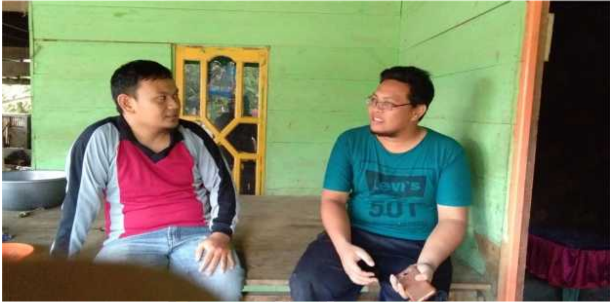
Gambar, bincang-bincang dengan salah satu pelaku nikah usia dini