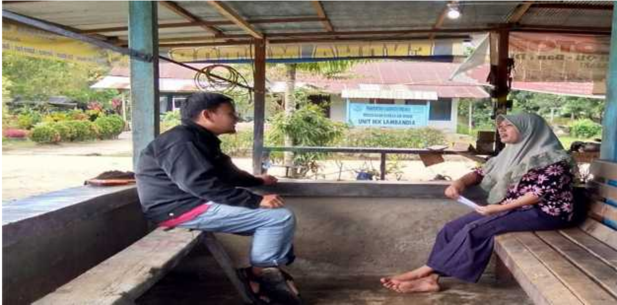
Gambar, bersama dengan staf kantor urusan agama kecamatan Lambandia, Kolaka Timur