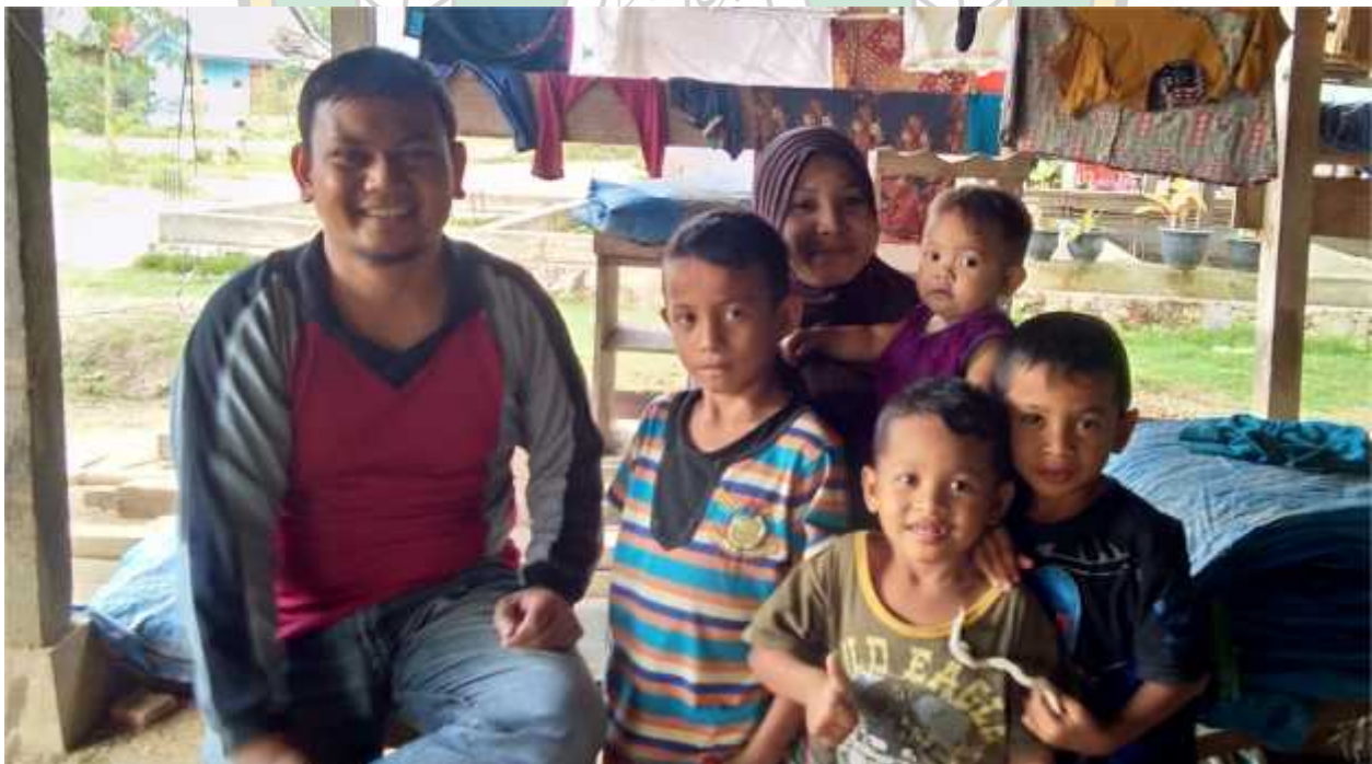
Gambar, bersama dengan salah satu ibu yang nikah diusia dini dan sudah memiliki beberapa anak