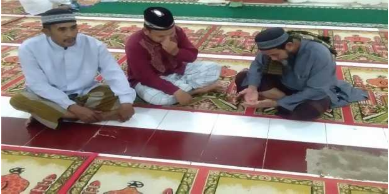
Gambar, bersama dengan tokoh Masyarakat dan orang tua dari anak nikah usia dini