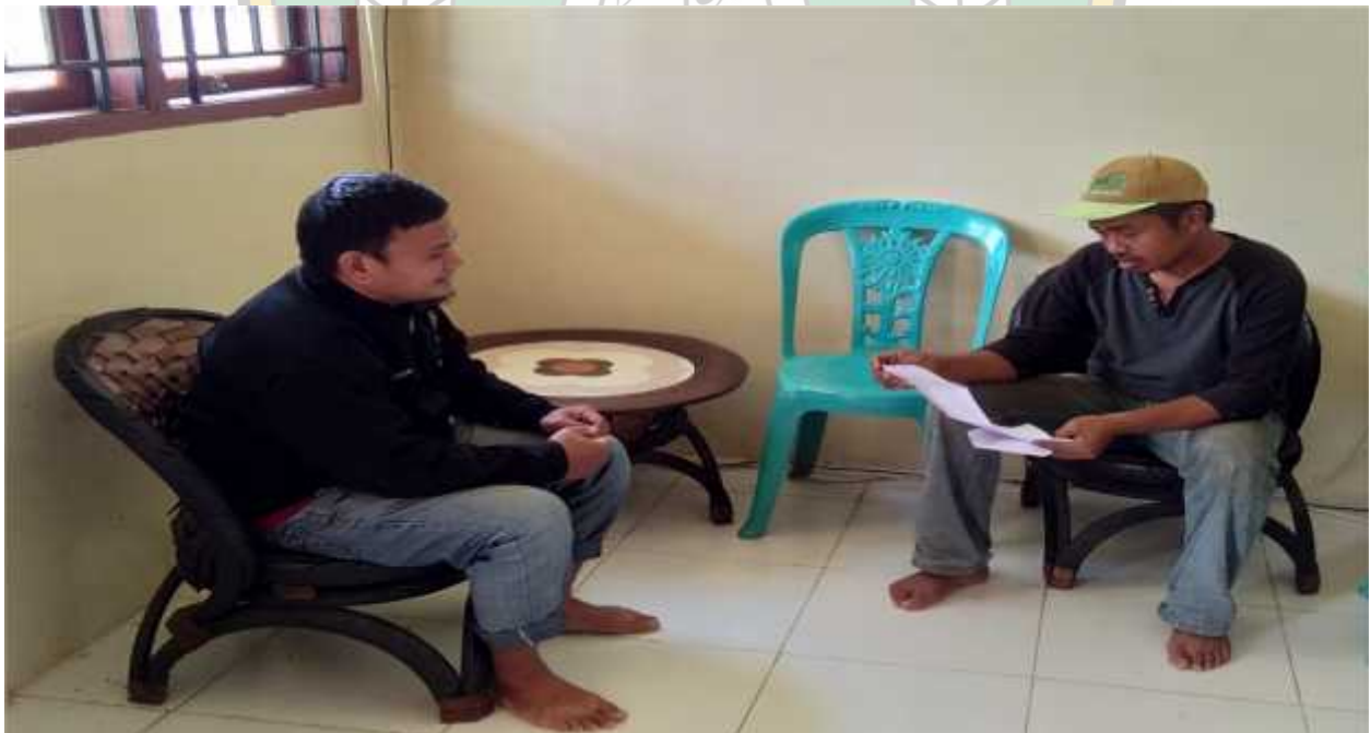
Gambar, bersama dengan staf kantor kecamatan Lambandia, Kolaka Timur