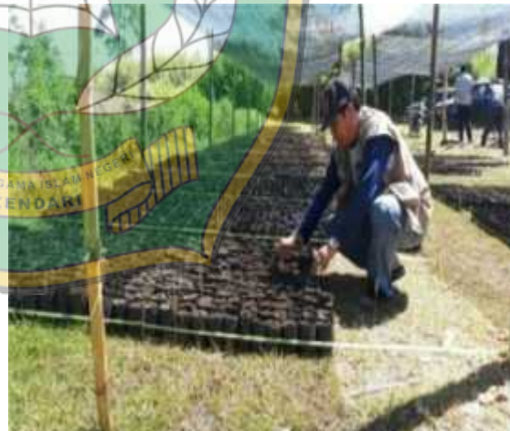
Awal membudidayakan nilam menggunakan menggunakan kantong khusus bibit nilam.