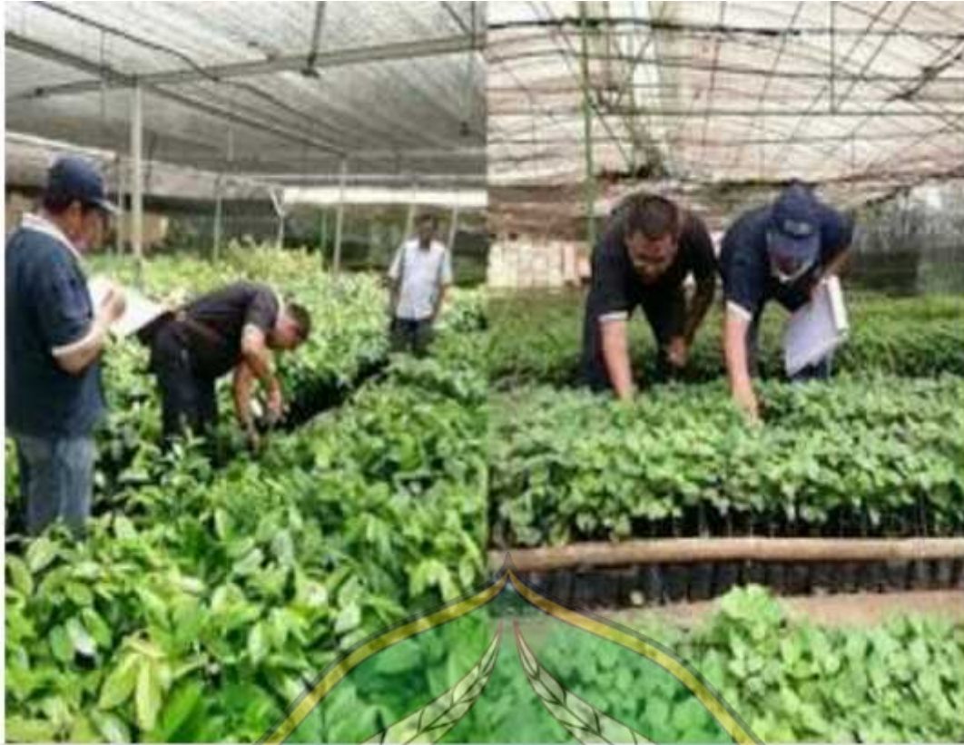
Proses pemanenan daun nilam menggunakan gunting yang dibuat khusus untuk mengambil tangkai daun nilam