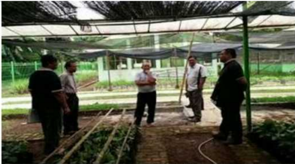
Pengusaha nilam , Pengepul, dan petani nilam waktu kunjungan di desa matabubu