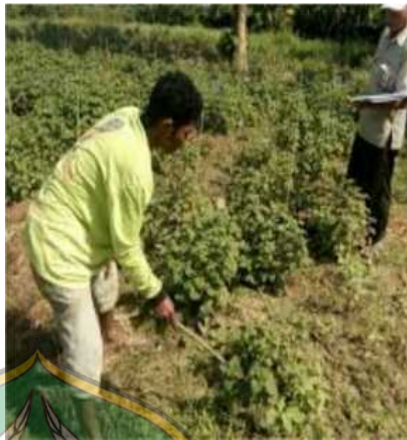
Daun nilam yang terkena hama penyakit, terlihat pada daun yang mengecil dan menguning.