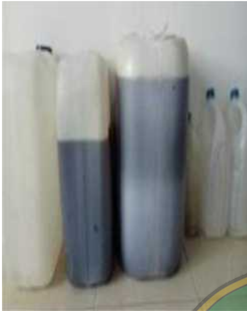
Nilam setelah penyulingan dalam bentuk Minyak