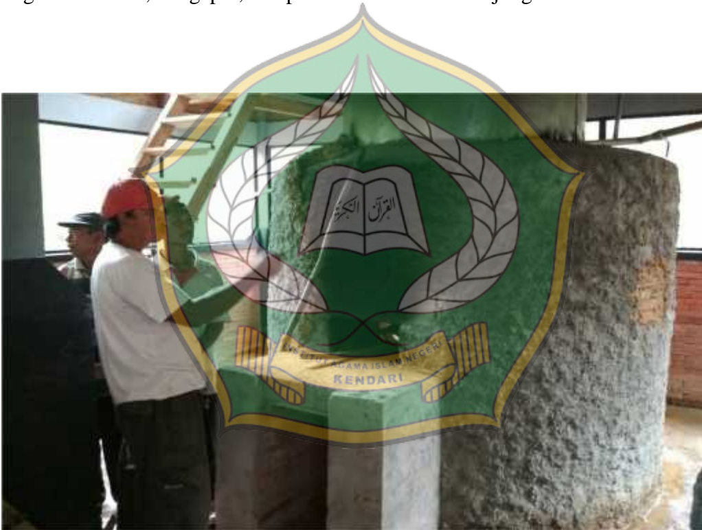
Petani nilam dan pemilik pabrik sedang menyuling minyak nilam.