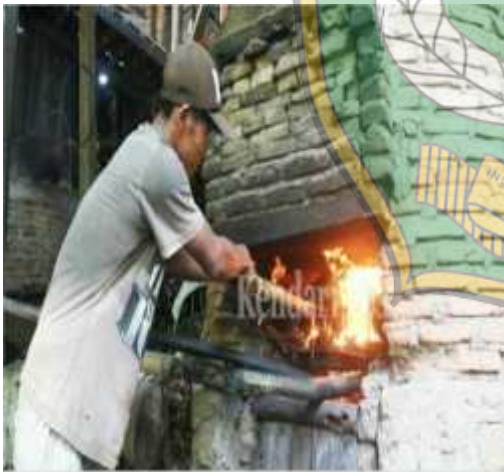
Proses penyulingan daun nilam kedalam Tungku(Ketel).