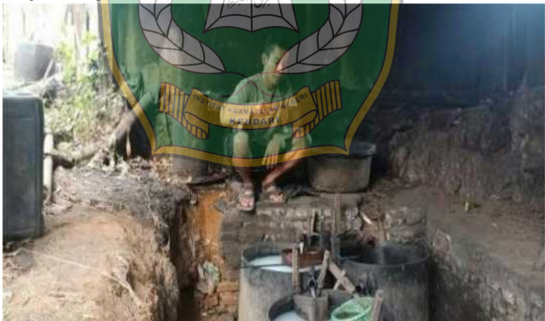
Dokumentasi waktu pemindahan minyak nilam ke drum dan kemudian dihitung menggunakan timbangan.