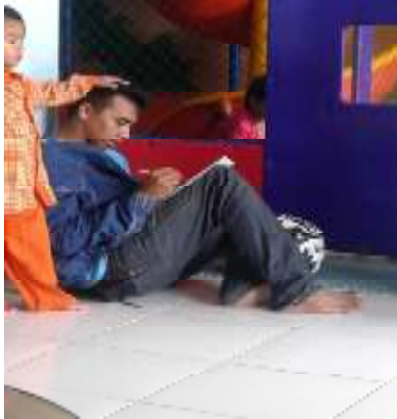
Doc. pengisian angket oleh orang tua siswa