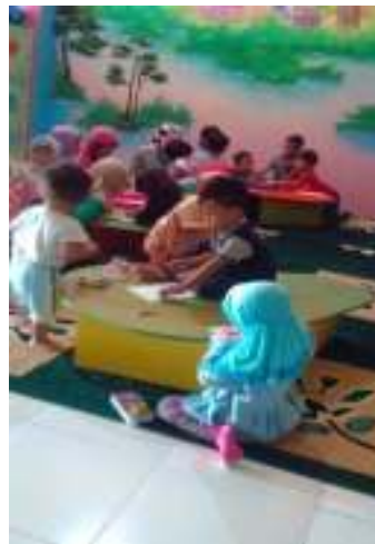
Doc. bersama kepala sekola