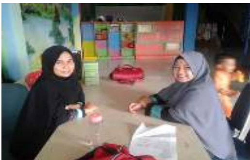
Doc. Permainan edukatif