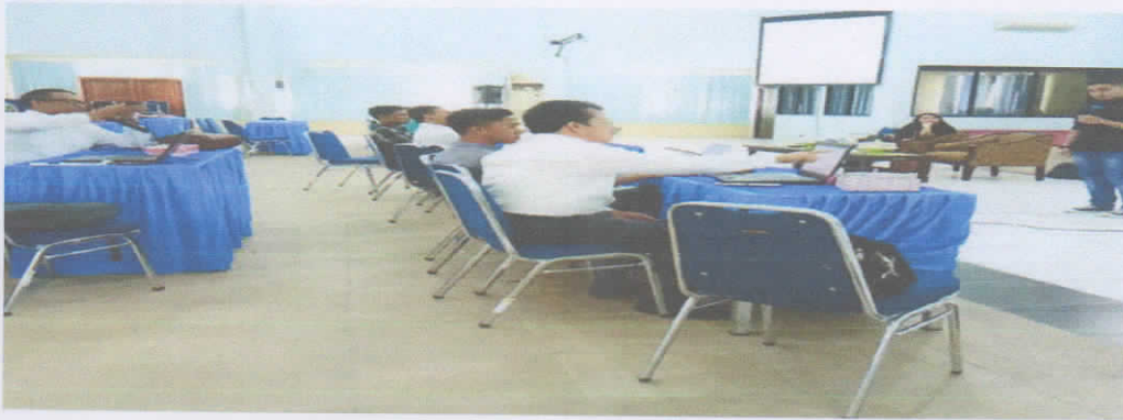
Kuliah Pasar Modal Bersama Mahasiswa Langsung