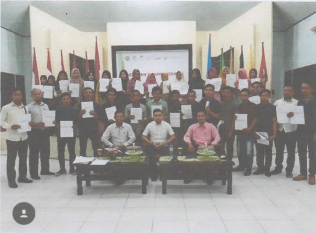
Wawancara Ketua KSPM IAIN Kendari