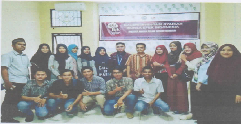
Investival KSPM se Kota Kendari