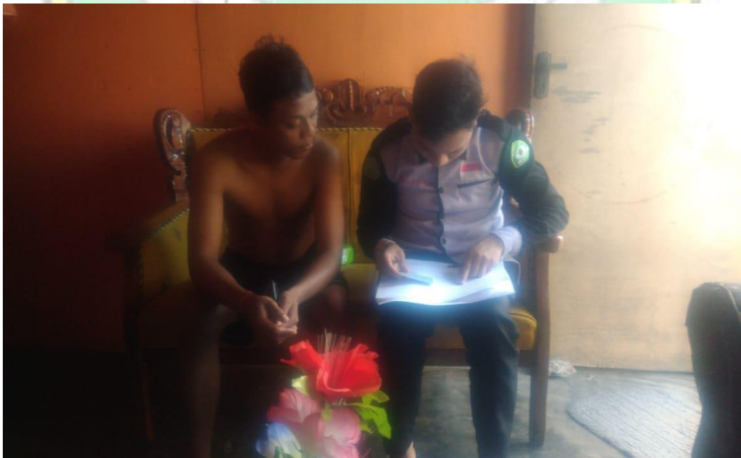
Sumber Data : Dokumentasi Hasil Wawancara Bersama Narasumber Tgl. 04 September 2018