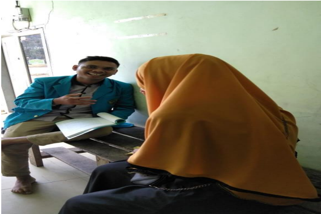
Sumber Data : Dokumentasi Hasil Wawancara Bersama Narasumber Tgl. 04 September 2018