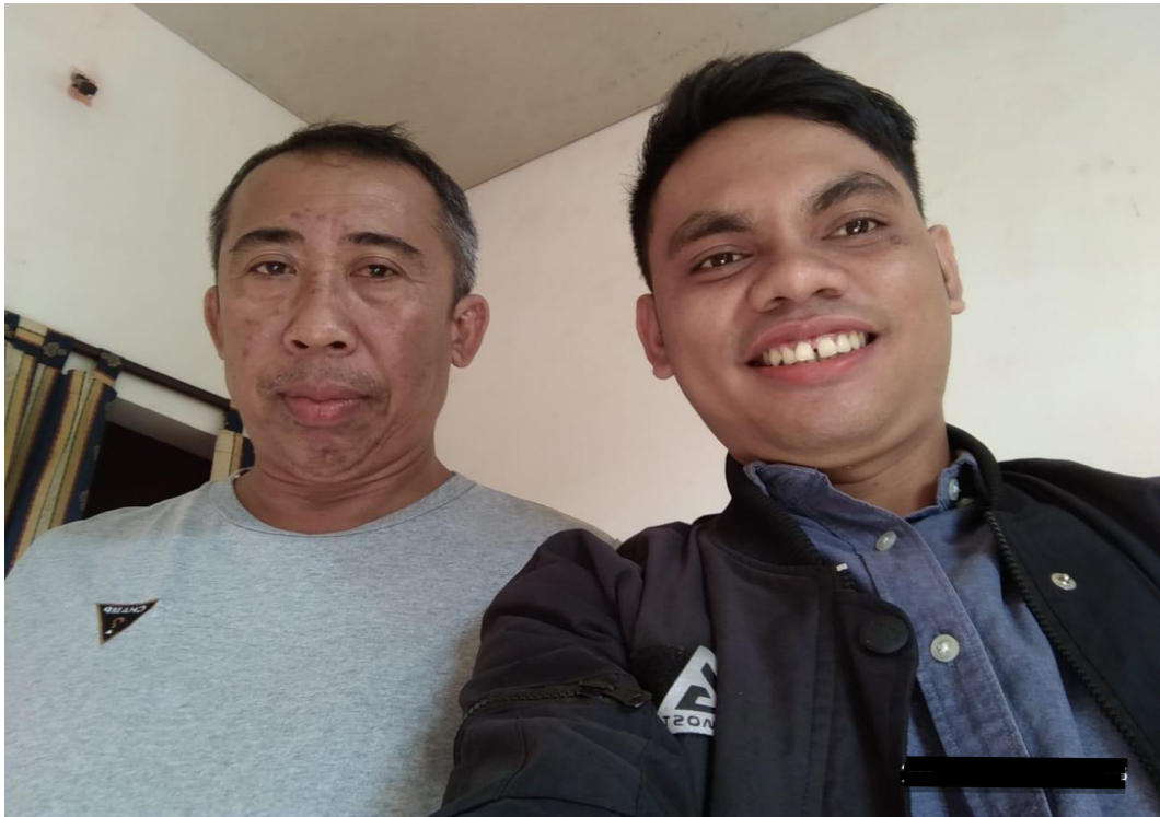
Sumber Data : Dokumentasi Hasil Wawancara Bersama Kepala Desa Ghonsume Kecamatan Duruka Tgl. 02 September 2018