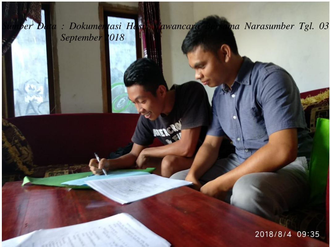
Sumber Data : Dokumentasi Hasil Wawancara Bersama Narasumber Tgl. 04 Agustus 2018