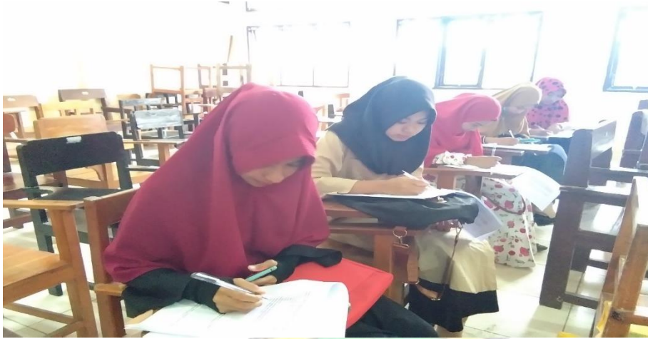
Proses Wawancara dengan Mahasiswa