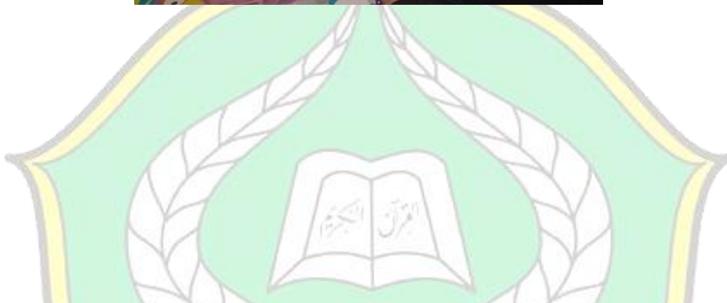
Lampiran 6: Daftar Dosen PAI