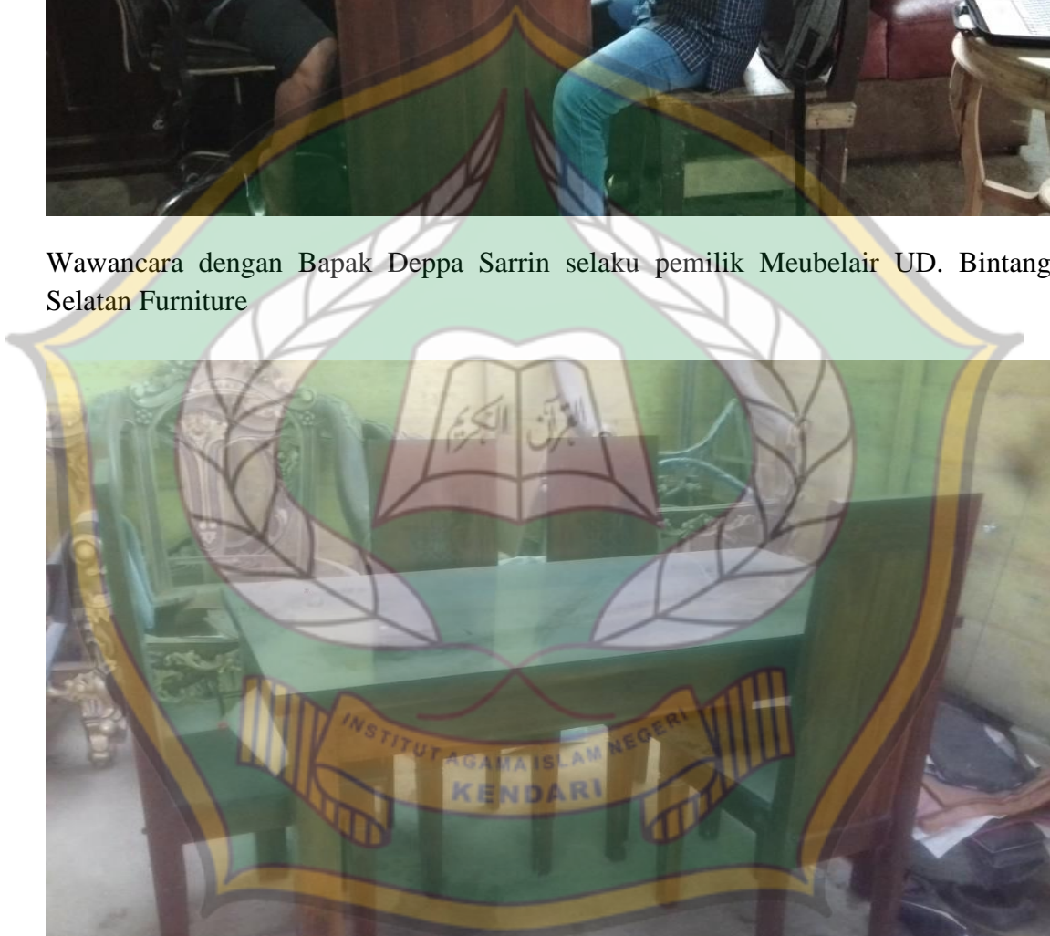
Produk Meubelair UD. Bintang Selatan Furniture