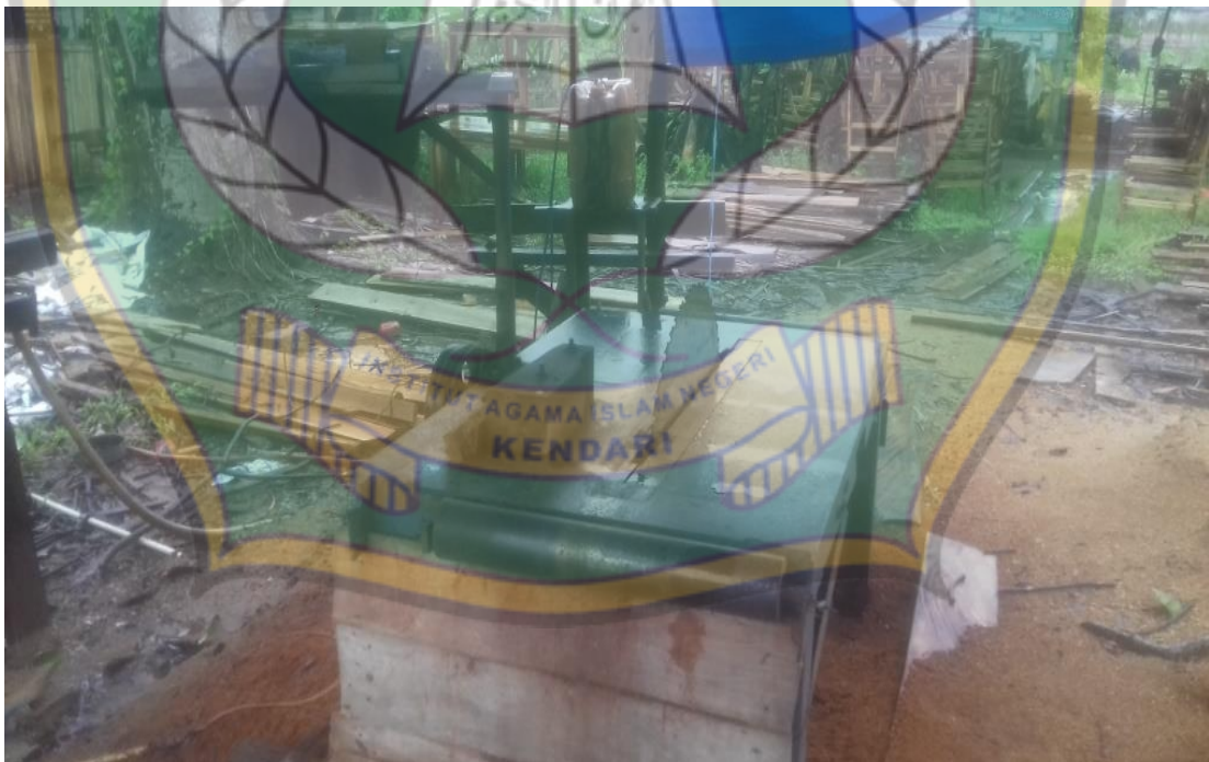
Alat pembuatan furniture di Meubelair UD. Bintang Selatan Furniture