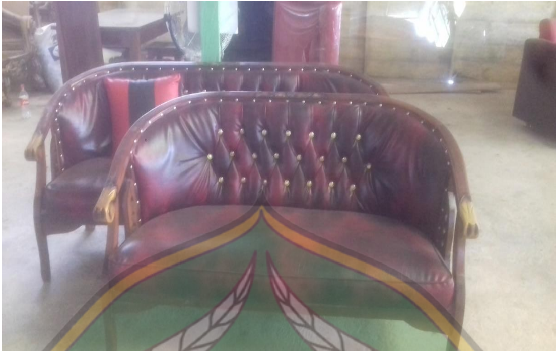
Produk Meubelair UD. Bintang Selatan Furniture