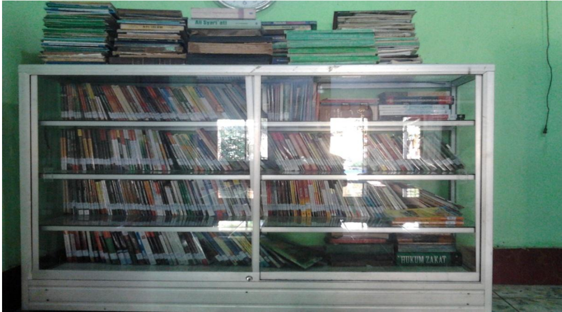
Gambar 1. Perpustakaan Lembaga Pengajian Nurul Jihad sebagai sumber ilmu bagi para santri