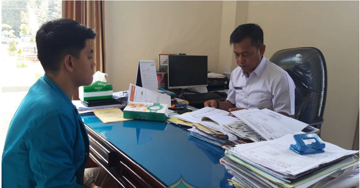
Proses wawancara dengan kasubag Dinas Cipta Karya, Bina Konstruksi dan Tata Usaha Provinsi Sulawesi Tenggara