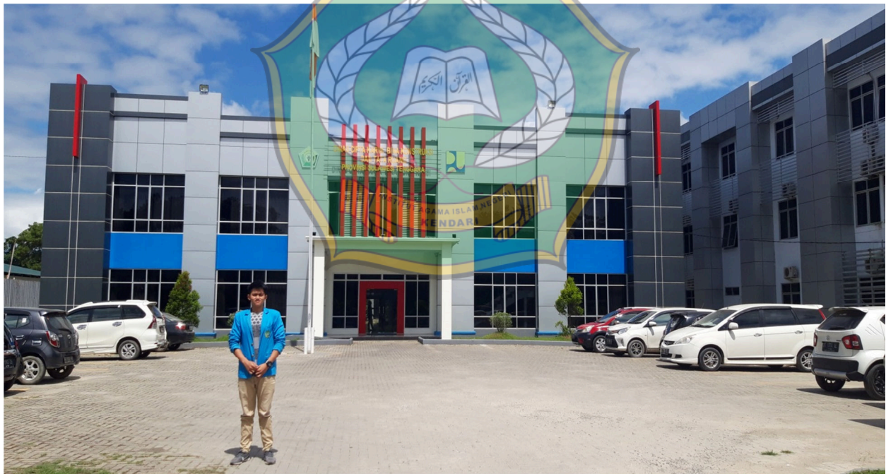
Kantor Dinas Cipta Karya, Bina Konstruksi dan Tata Ruang