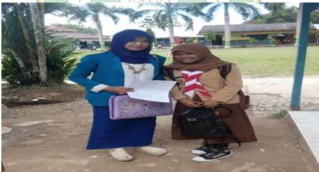
Wawancara Bersama siswa SMA Negeri 2 Konawe Selatan kelas X MIA.3