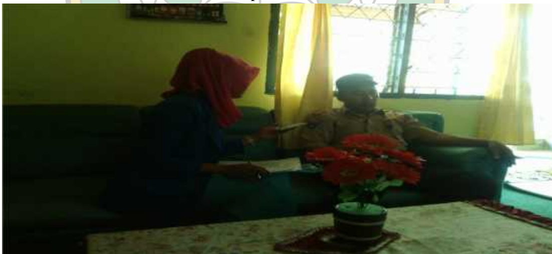
Wawancara Bersama Guru Pendidikan Agama Islam SMAN 2 Konawe Selatan