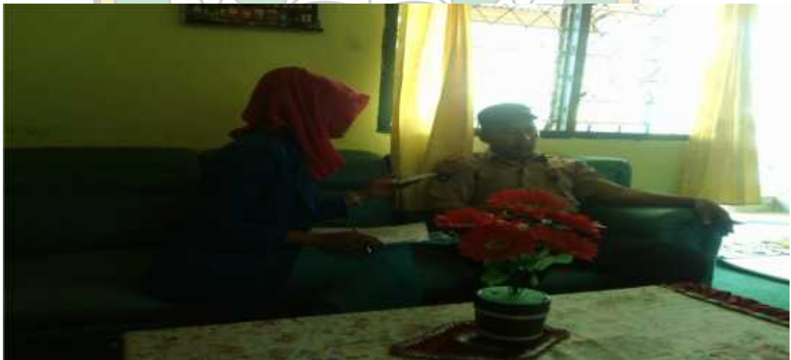
Wawancara Bersama Guru Pendidikan Agama Islam SMAN 2 Konawe Selatan