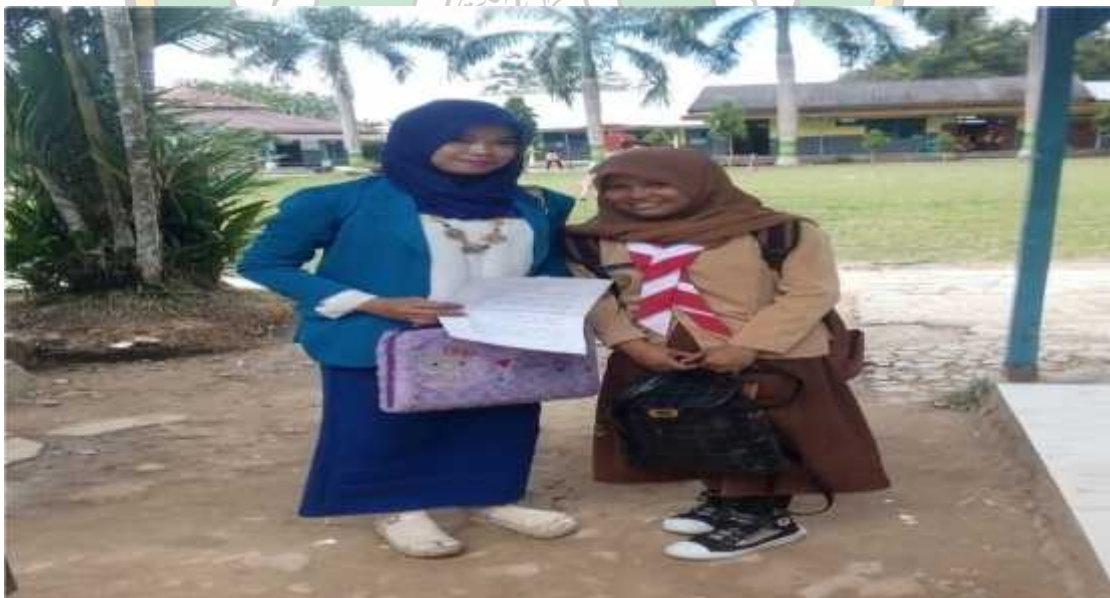
Wawancara Bersama siswa SMA Negeri 2 Konawe Selatan kelas X MIA.3