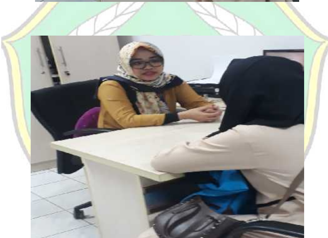
Dokumentasi Pada Saat Wawancara MM Bank Muamalat Cabang Kendari