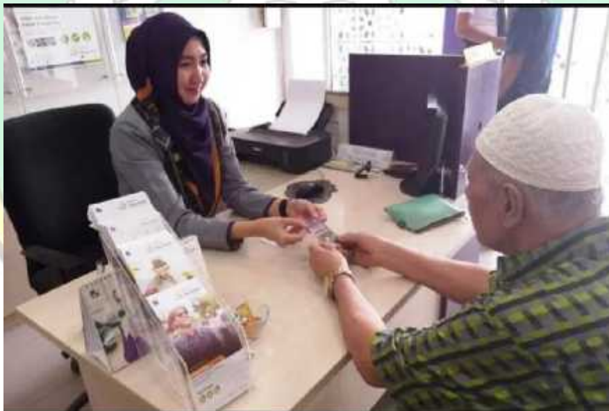
Dokumentasi Pada Saat Pelayanan Produk Deposito Mudharabah