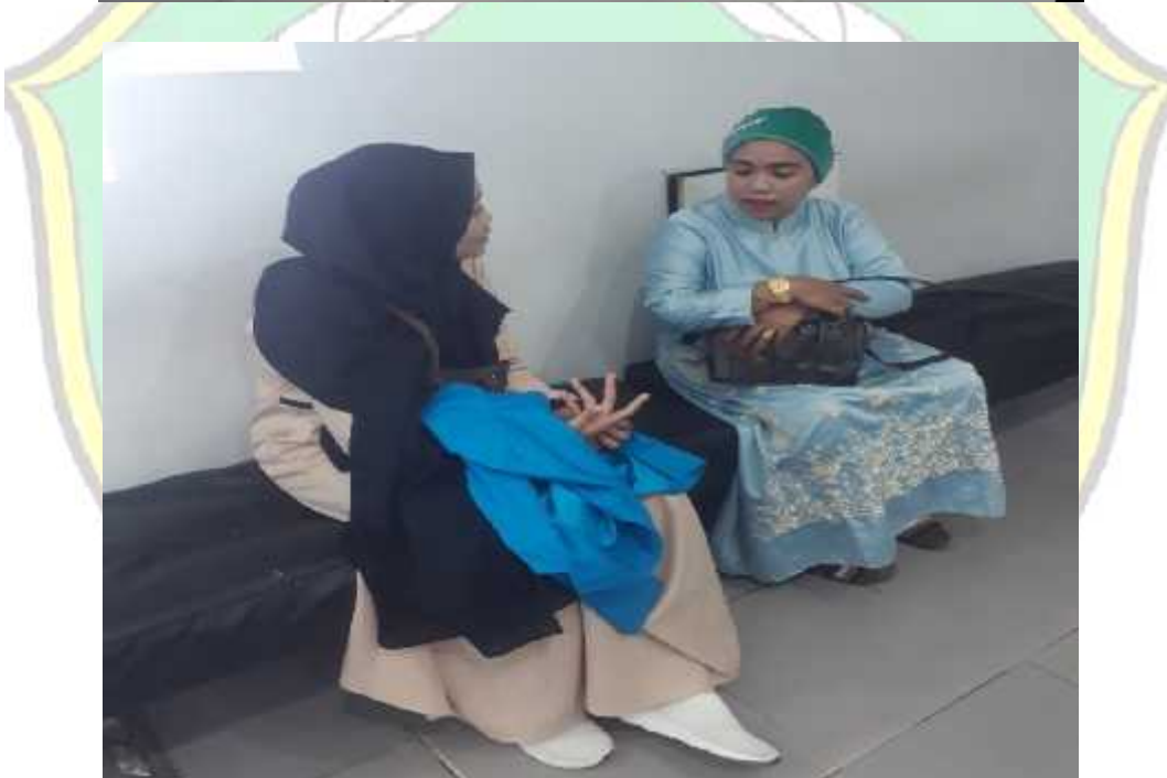
Dokumentasi Pada Saat Wawancara Nasabah Produk Deposito Mudhrabah Bank Muamalat Cabang Kendari