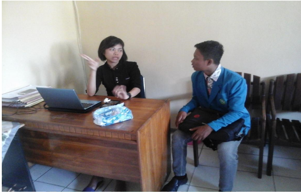
Wawancara bersama penyidik Unit Pelayanan Perempuan Dan Anak