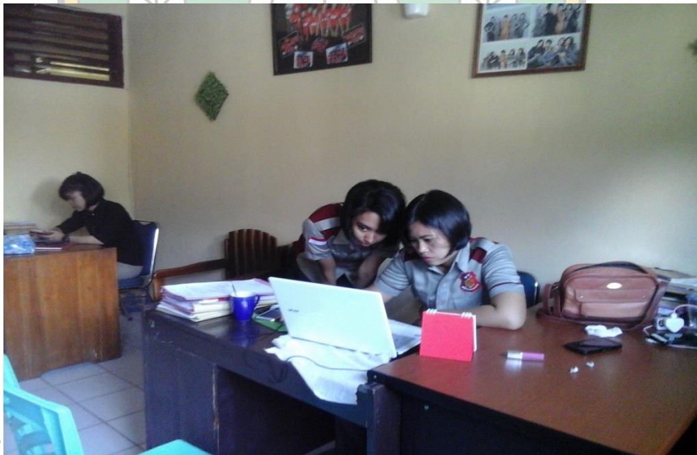
Proses pengimputan data kekerasan anak tahun 2015 sampai dengan September 2016