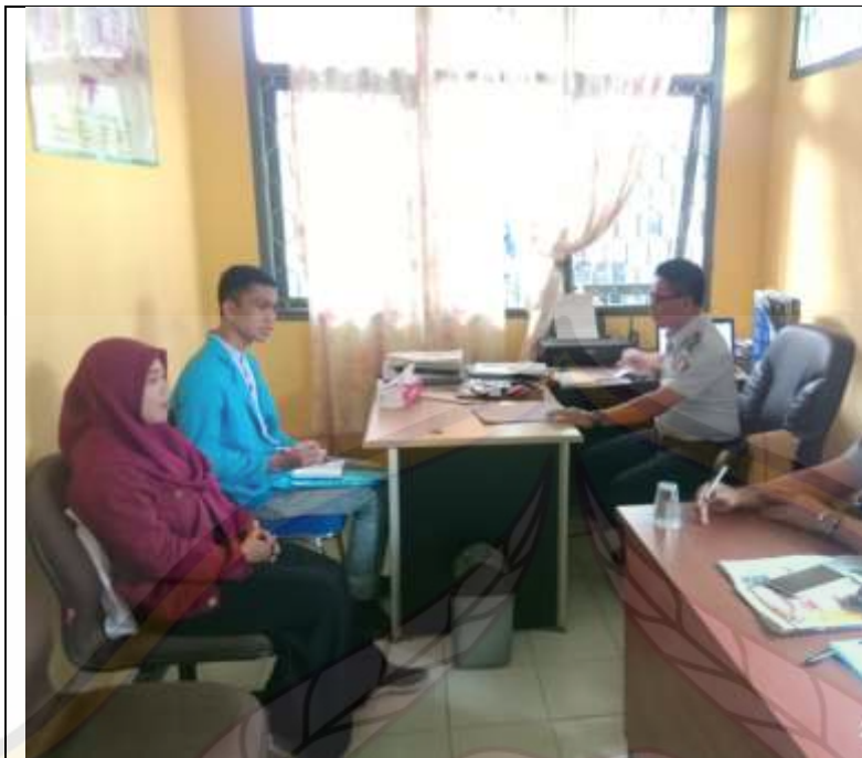
Wawancara bersama ketua rutan kendari dan beberapa staff