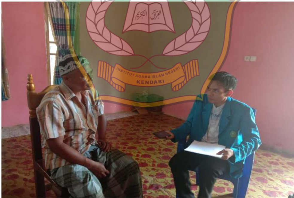
Wawancara bersama Masyarakat Desa Biru.