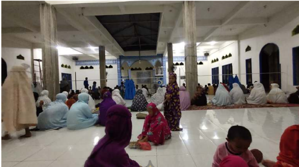
Pelaksanaan Tradisi Tolak Bala di Masjid Raya Desa Biru