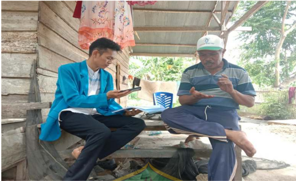
Wawancara bersama Imam Masjid Raya Desa Biru.