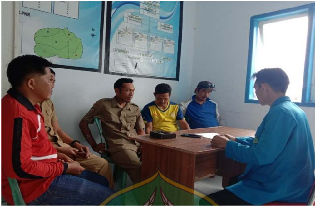
Wawancara bersama para kepala Dusun di Desa Biru.