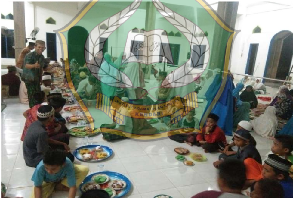
Makan Bersama Setelah Pelaksanaan Tradisi Tolak Bala