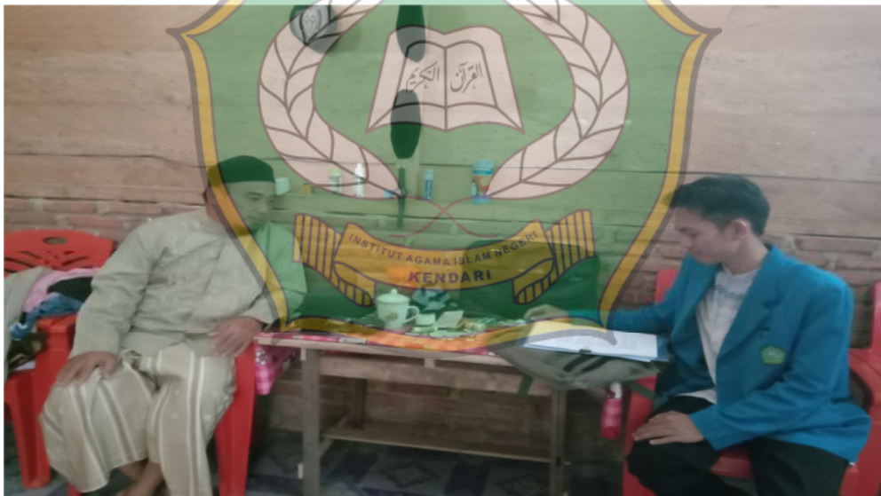
Wawancara bersama Imam Desa Biru