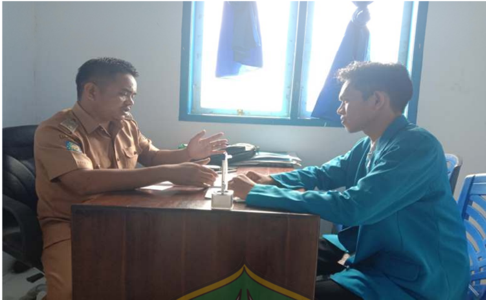
Wawancara bersama Bapak Kepala Desa Biru