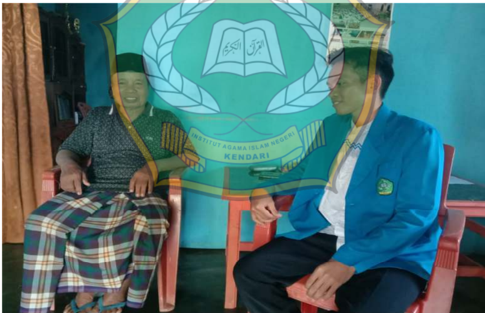
Wawancara bersama Imam Dusun Kanang Baru (Desa Biru)