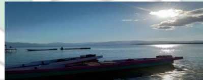
Kapal penangkap ikan