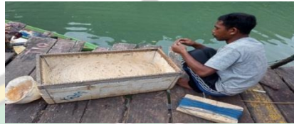
Rawe/ Pancing Bersusun