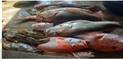
Hasil tangkapan Ikan kakap Merah