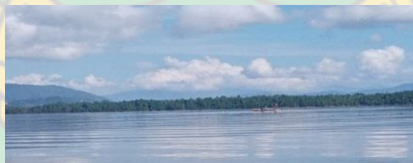
Pada saat menangkap Ikan