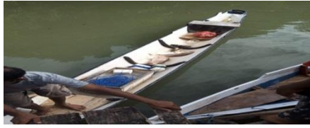
Pada saat tiba didarat