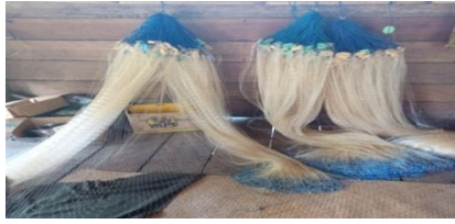
Alat yang digunakan: Pukat?