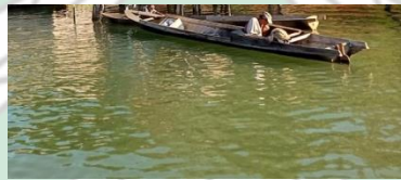
Kapal penangkap ikan