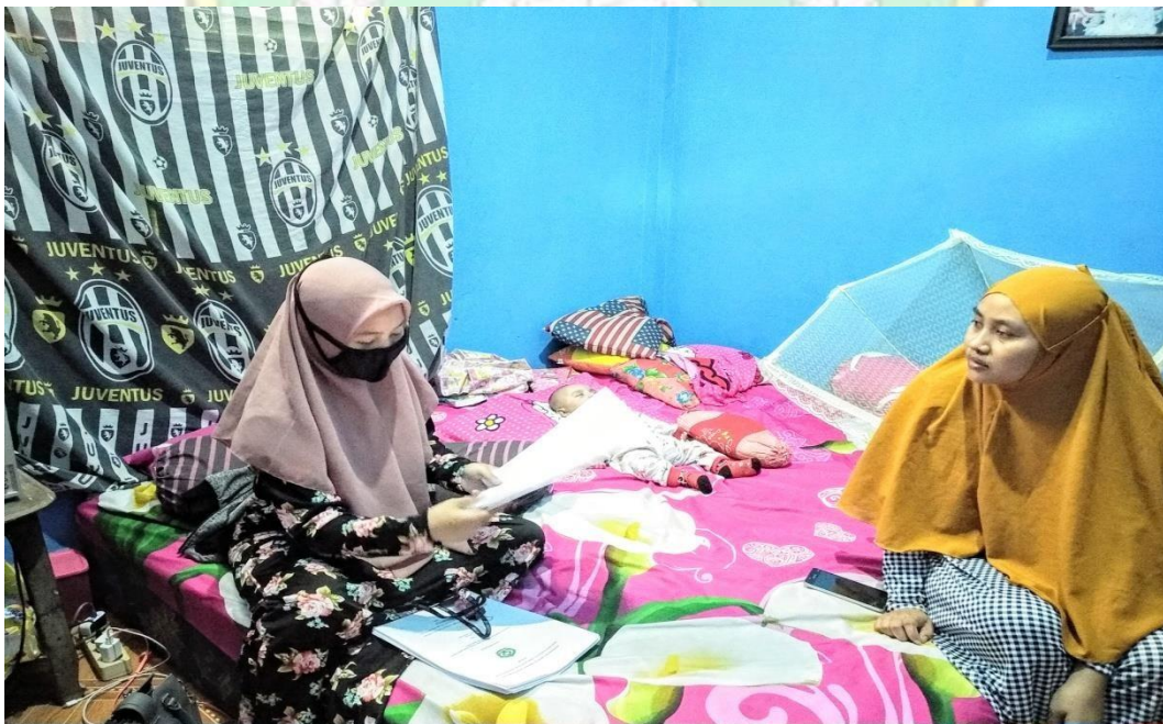
Dokumentasi terhadap IL