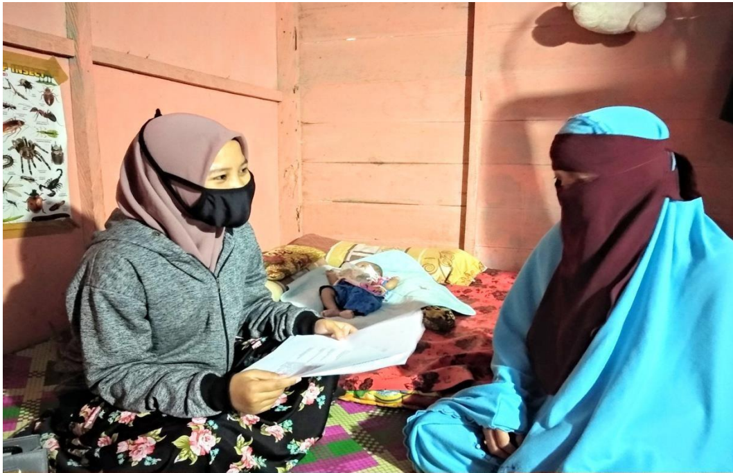
Dokumentasi terhadap SR