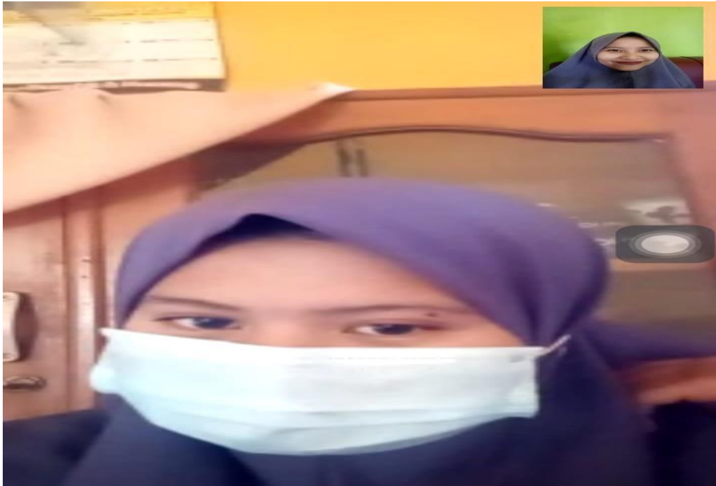
Dokumentasi terhadap I