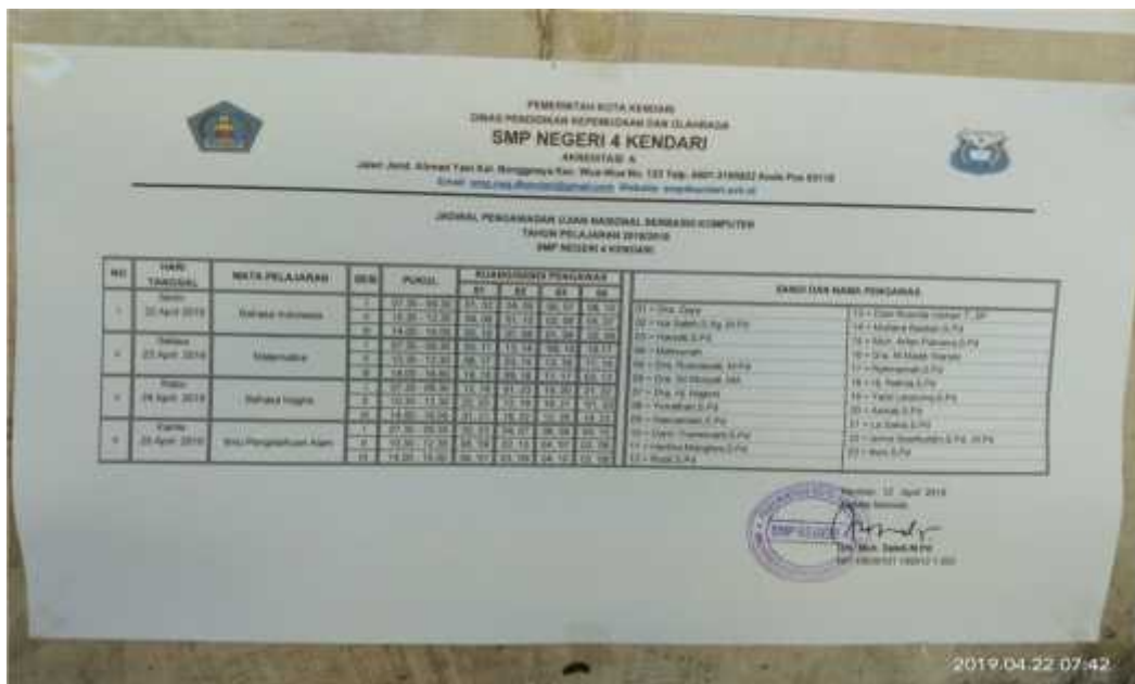
(Jadwal Pengawas UNBK)