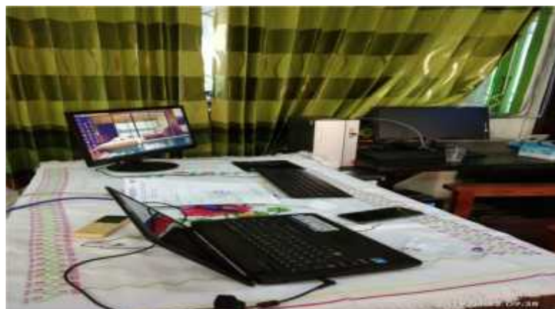
(Pengecekan PC Persiapan Pelaksanaan UNBK)