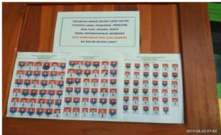
(Daftar Nama Peserta UNBK)