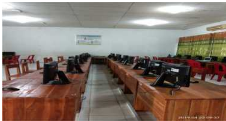
(Keadaan Kelas Sebelum Melaksanakan UNBK)