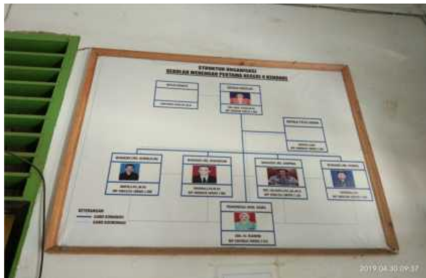
(Struktur Organisasi SMP Negeri 4 Kendari)