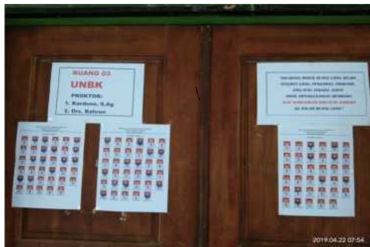
(Daftar Nama Peserta UNBK 3)