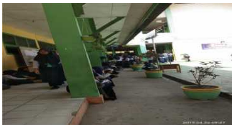
(Keadaan Antrian tahap 2 Siswa(i) untuk UNBK)