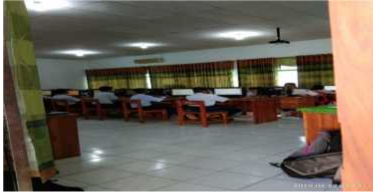
(Prpses Pelaksanaan UNBK)