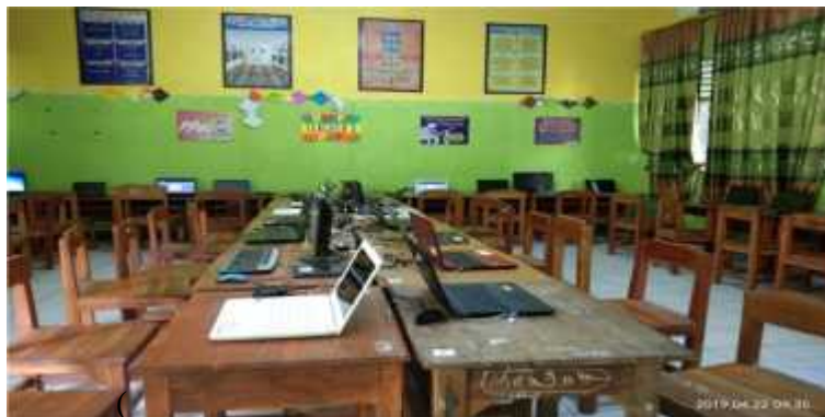
(Keadaan Ruang Persiapan UNBK )