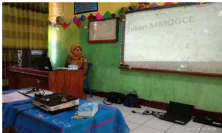
(Proses Persiapan UNBK)