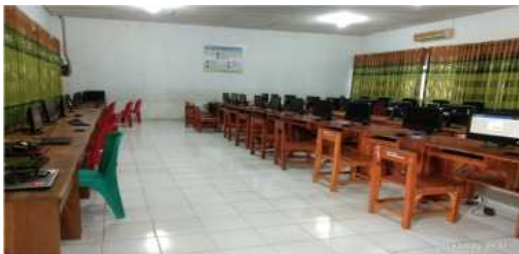
(Persiapan Sebelum Pelaksanaan UNBK)