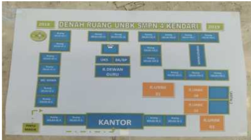
(Denah Ruang UNBK)