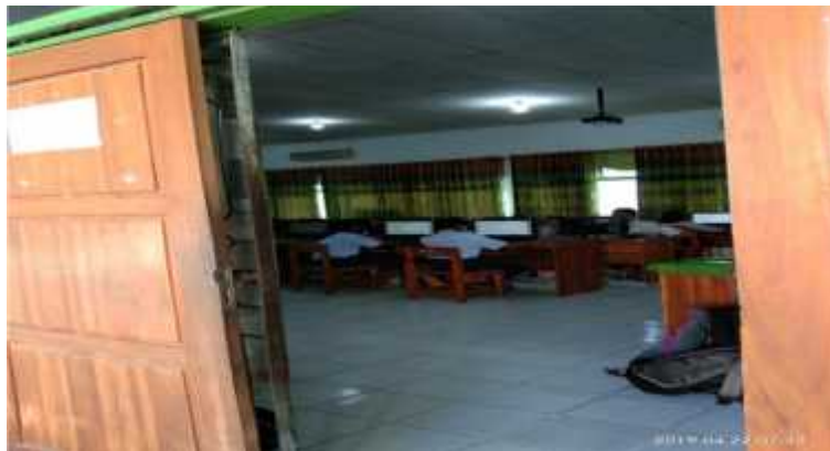
(Proses Pelaksaan UNBK 2)