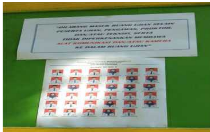
(Daftar Nama Peserta UNBK 2.1)