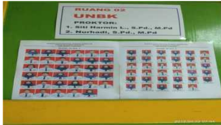
(Daftar Nama Peserta UNBK 2)