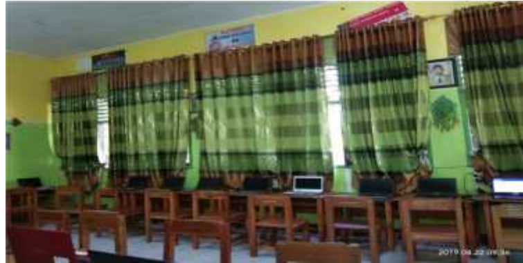
(Sisi Samping Keadaan Kelas Persiapan UNBK)