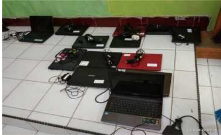
(Laptop Cadangan Persiapan UNBK)