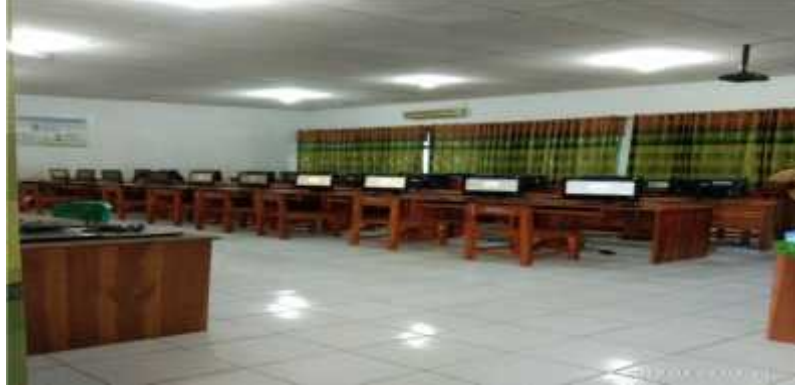
(Keadaan Ruang Persiapan UNBK Laboratorium Komputer)