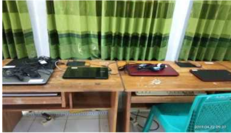
(Laptop Cadangan Pelaksanaan UNBK)