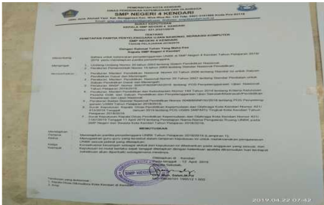
(Surat Penetapan Penyelenggaraan UNBK)