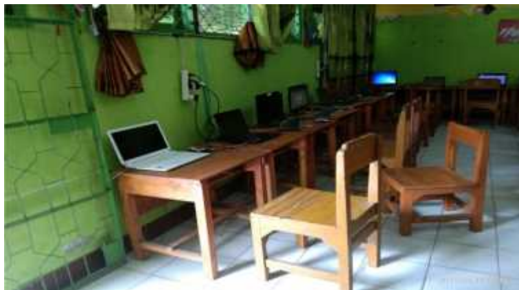
(Keadaan Ruang Persiapan UNBK 2)