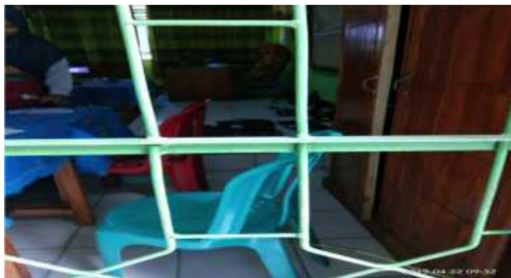
(Proses Pengabsenan Sebelum Masuk Kelas UNBK)