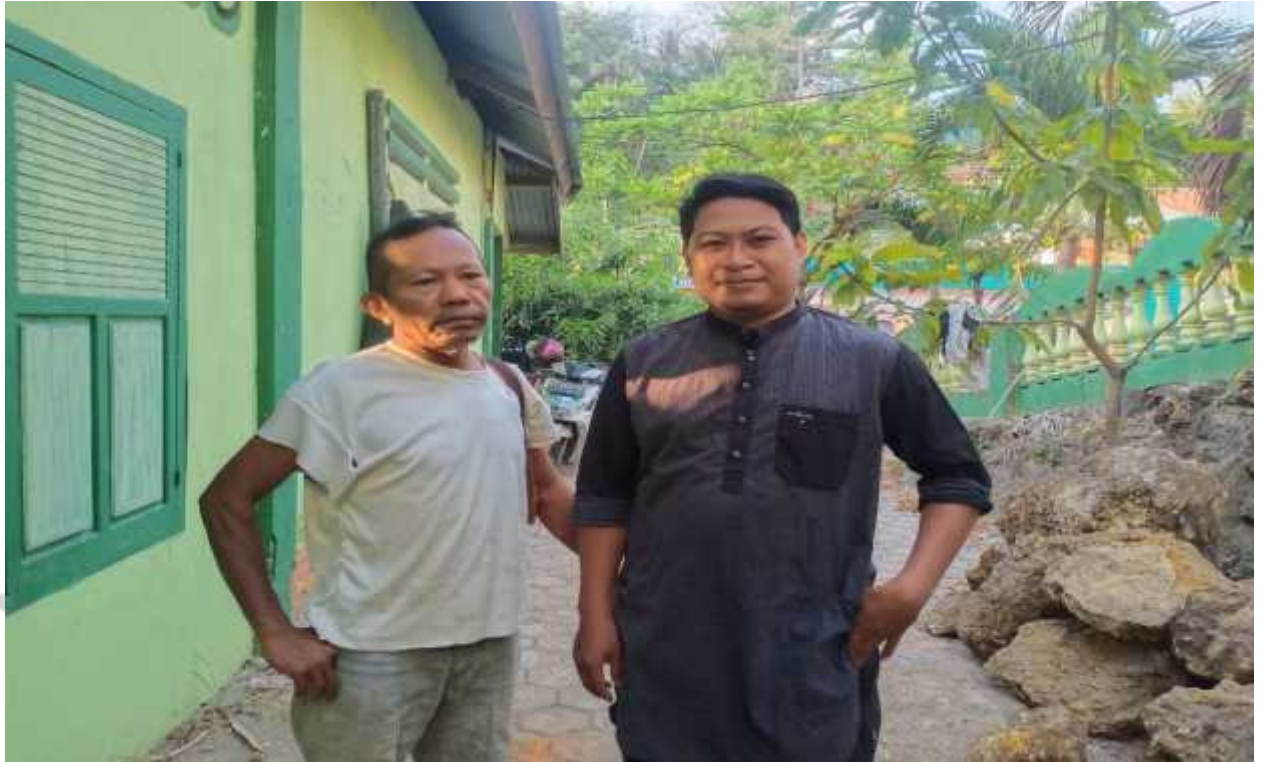
Wawancara bersama Bapak yang bekerja sebagai buruh kapal di Pelabuhan Kandai