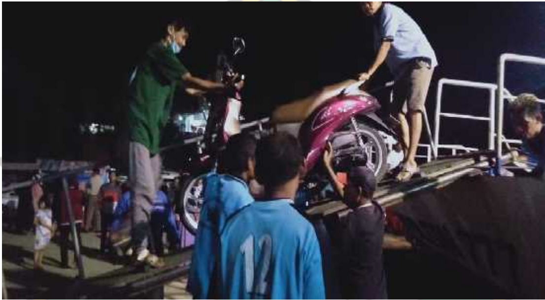
Kegiatan Buruh Kapal/ Membongkar Muat Saat Malam Hari