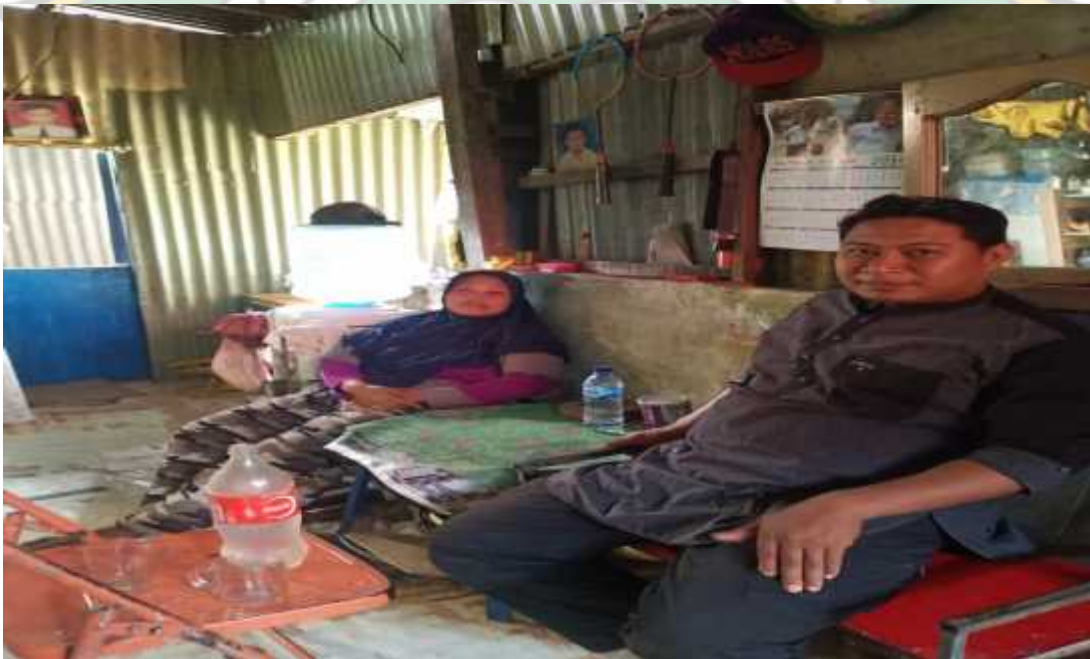
Wawancara bersama Istri burun kapal