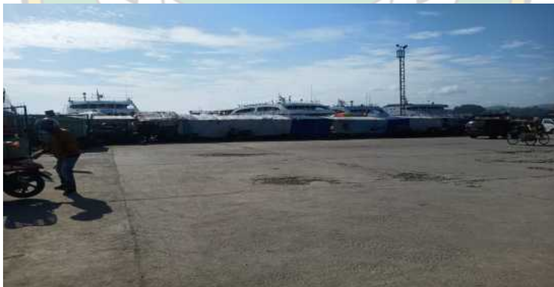
Kapal-Kapal Yang Beroperasi Di Pelabuhan Kadai Kecamatan Kendari