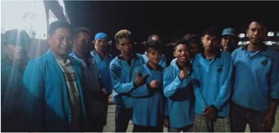
Berfoto bersama dengan pemuda-pemuda buruh kapal di Pelabuhan Kandai