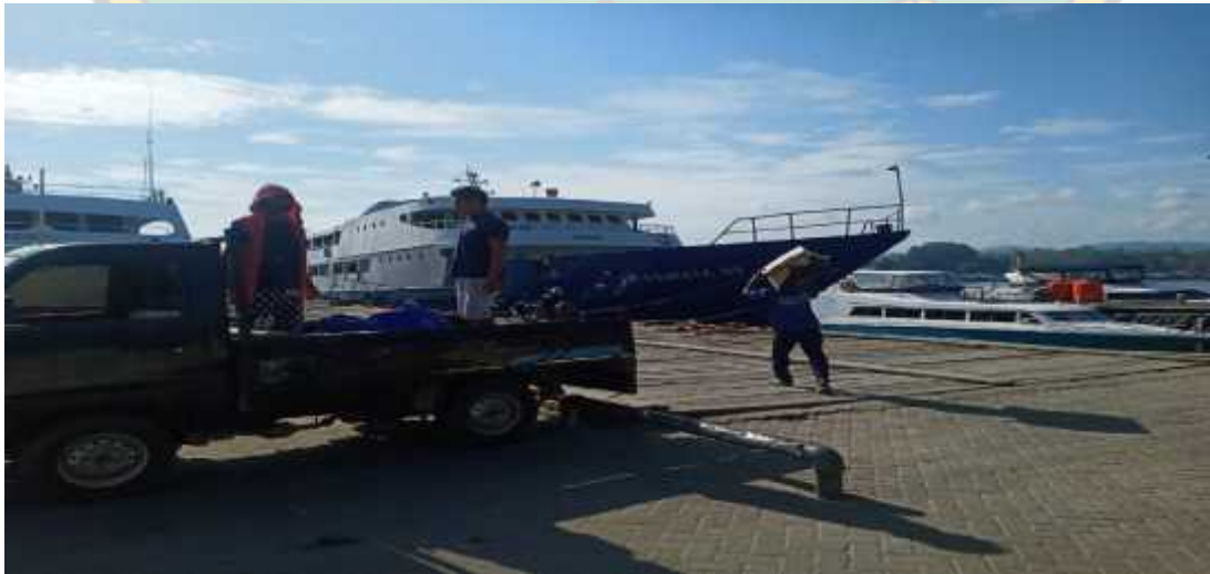
Kegiatan Buruh Kapal/ Membongkar Muat Saat Siang Hari