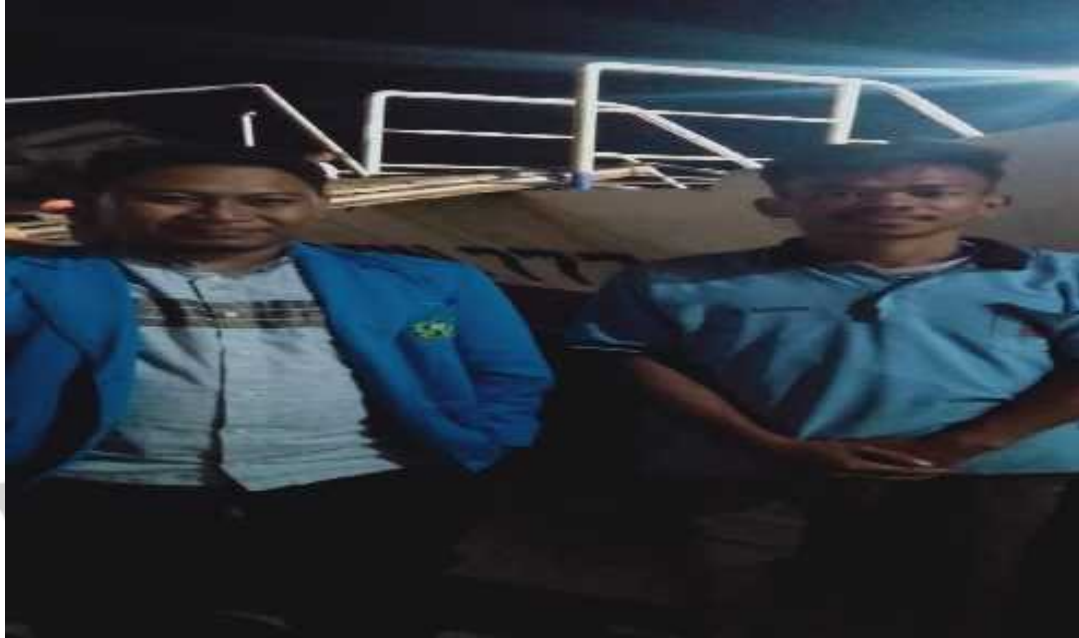
Wawancara yang dilakukan bersama pemuda yang sedang bekerja sebaai buruh kapal