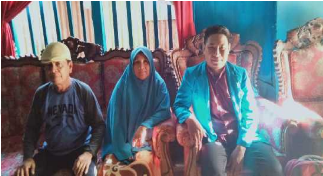
Wawancara yang dilakukan dengan Keluarga yang bekerja sebagai buruh kapal