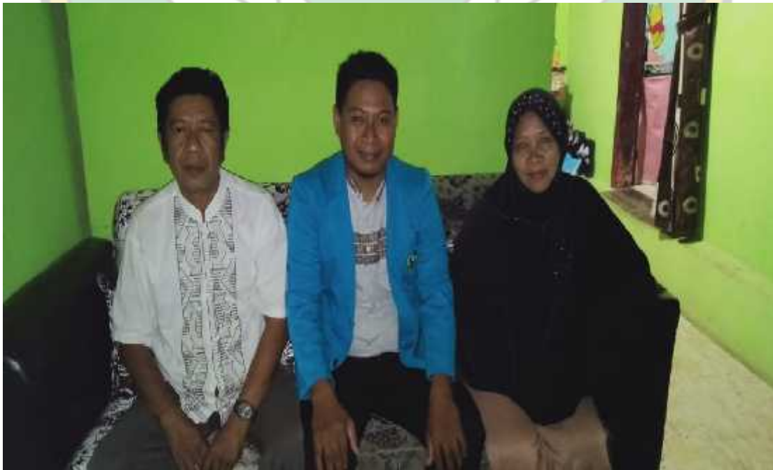
Wawancara bersama Bapak dan Ibu yang bekerja sebagai buruh kapal