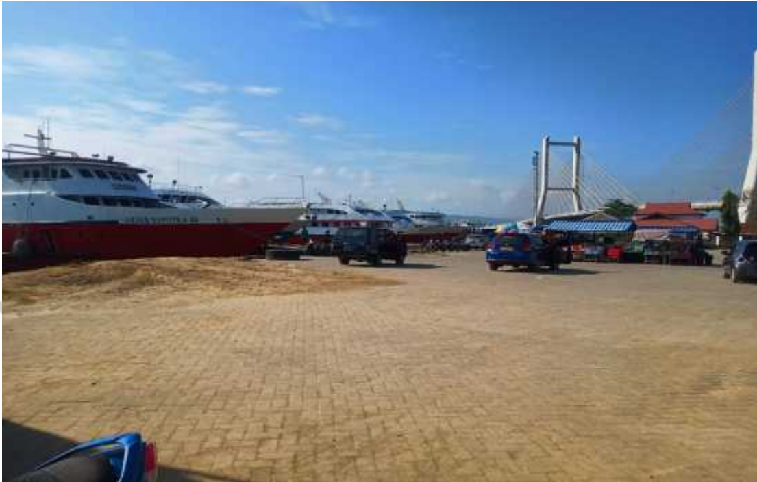
Lokasi Penelitian Di Pelabuhan Kadai Kecamatan Kendari