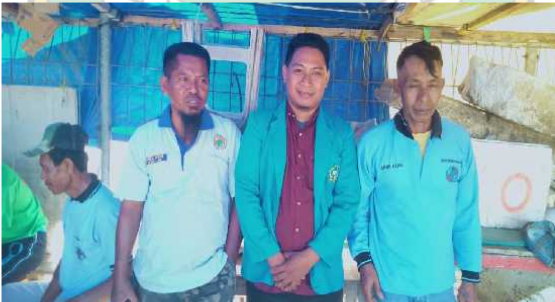
Wawancara Bersama dengan Bapak pekerja buruh kapal