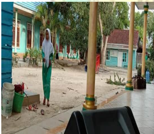
Halam Depan Asrama Putri