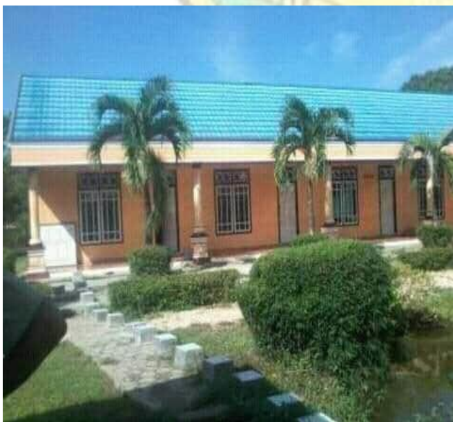
Nuansa Halama Depan Asrama Putra