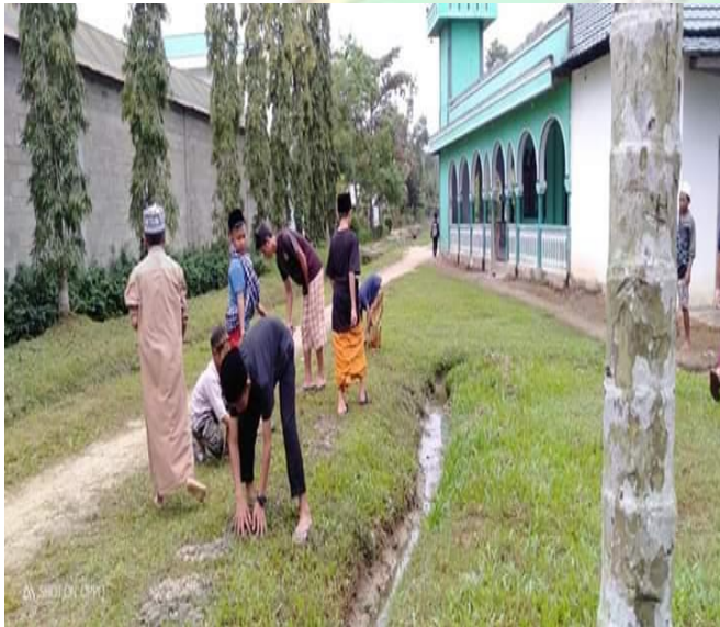
Kegiatan Ro'an Hari Jumat