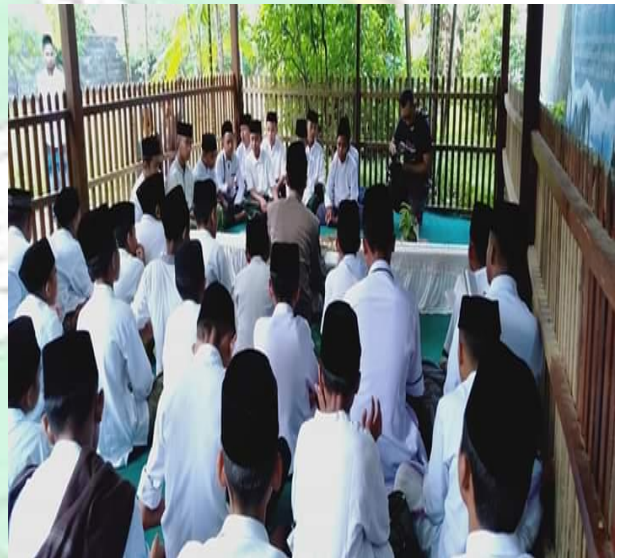
Do'a & Tahlil Bersama di Makam Pendiri