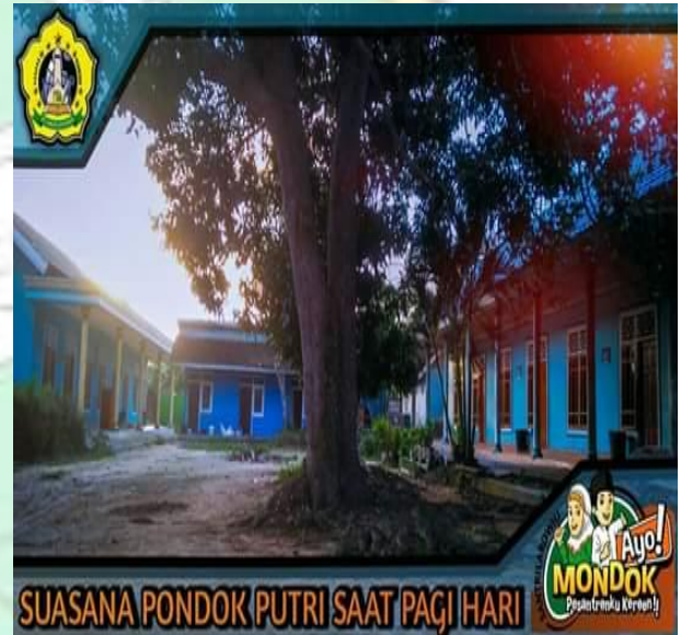
Nuansa Halaman Depan Asrama Putri