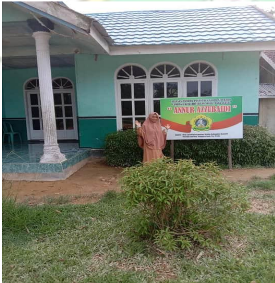
Kantor PP. Annur Azzubaidi