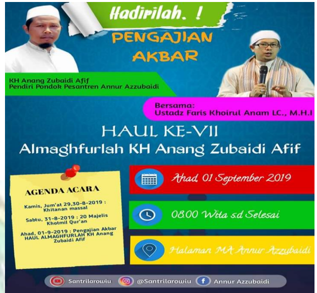
Pamflet Undangan Haul