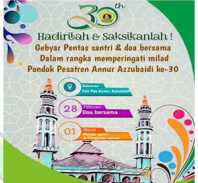
Kreatifitas Menyambut Hari Santri