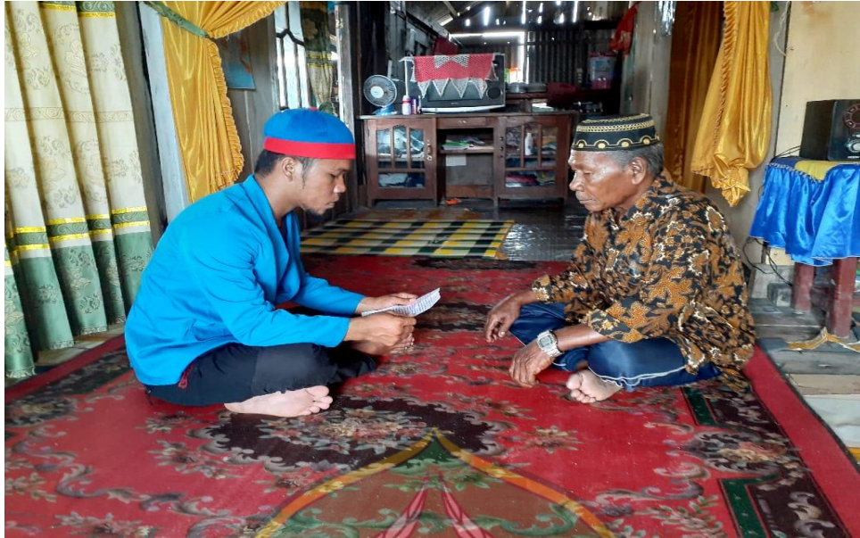
Responden : II