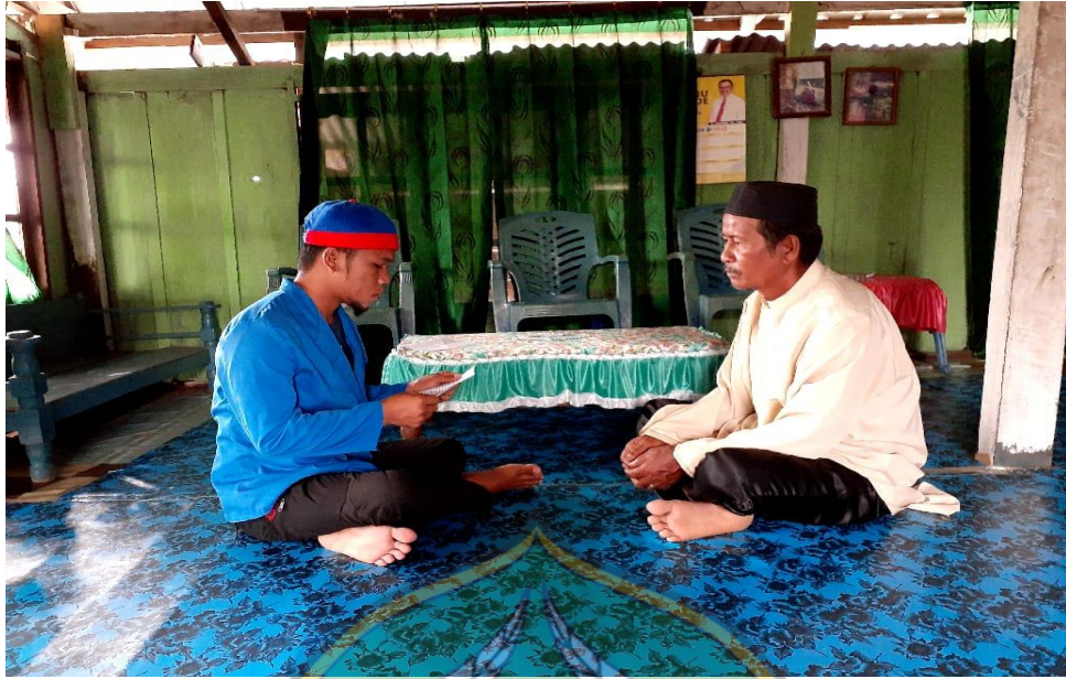
Responden : IV