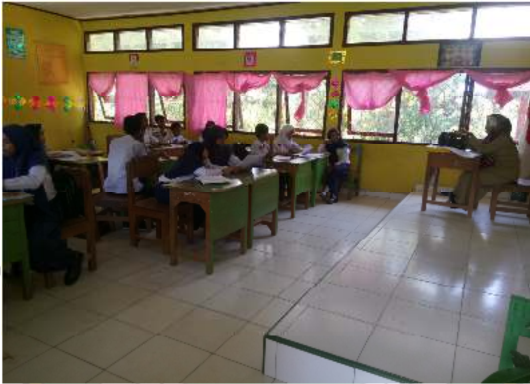
Suasana Belajar Siswa