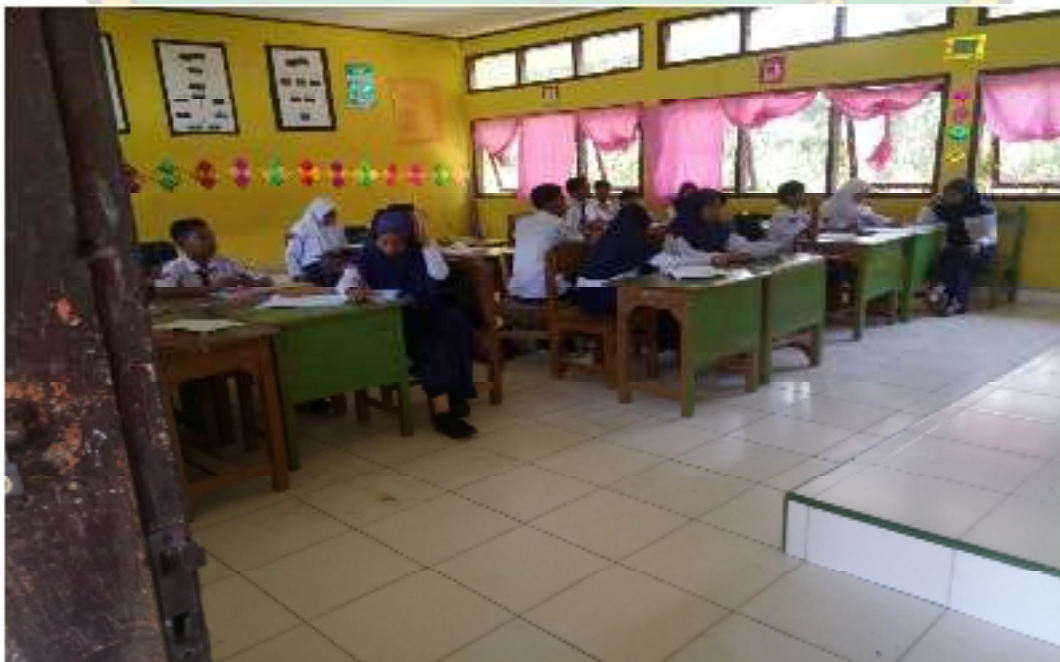
Suasana Belajar Siswa