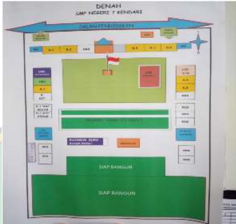
Denah SMP Negeri 7 Kendari