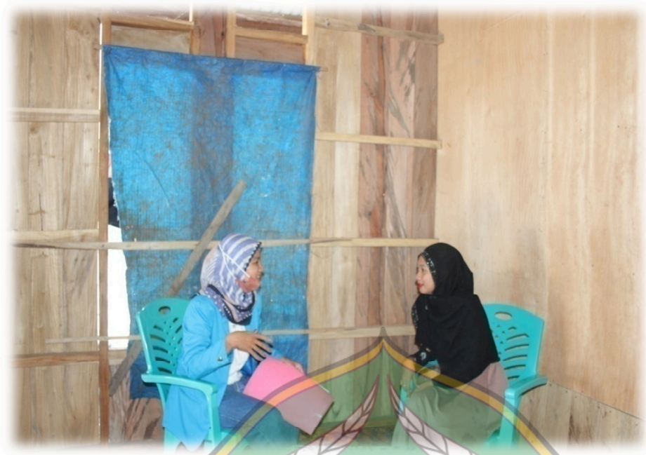
Gambar 1.12 Wawancara Dengan Masyarakat S