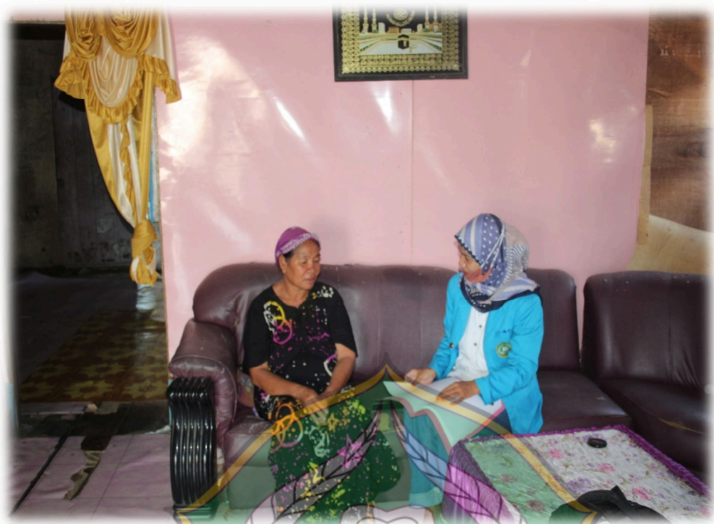
Gambar 1.10 Wawancara Dengan Masyarakat S