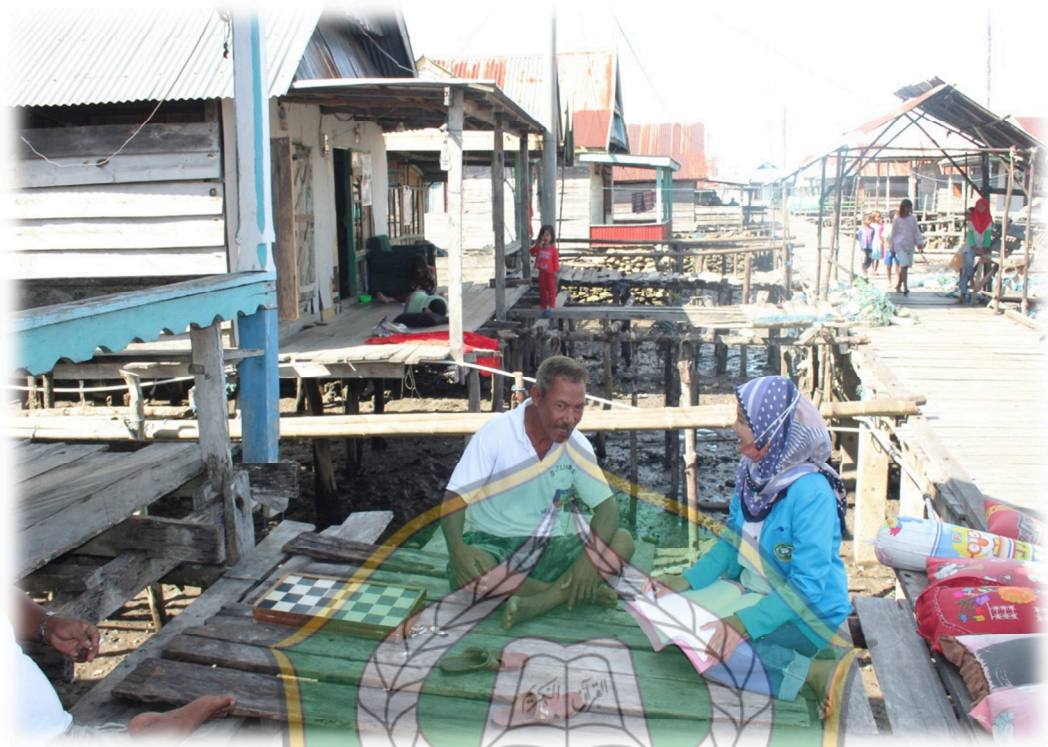
Gambar 1.14 Wawancara Dengan Masyarakat JB