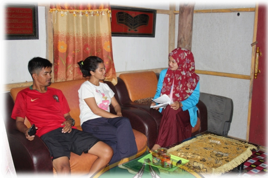
Gambar 1.6 Wawancara dengan Masyarakat DN