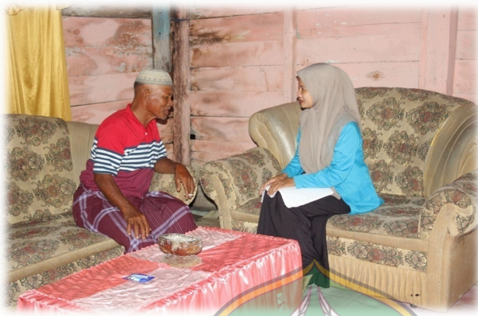
Gambar 1.8 Wawancara dengan Masyarakat M