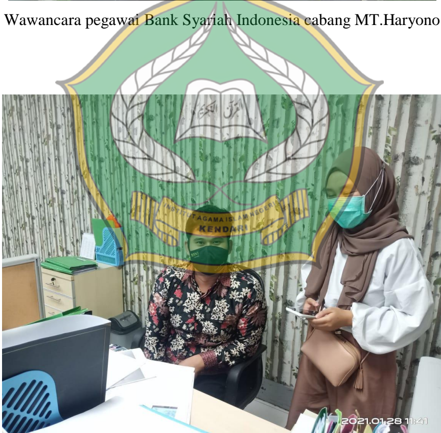
Wawancara pegawai Bank Syariah Indonesia cabang MT.Haryono