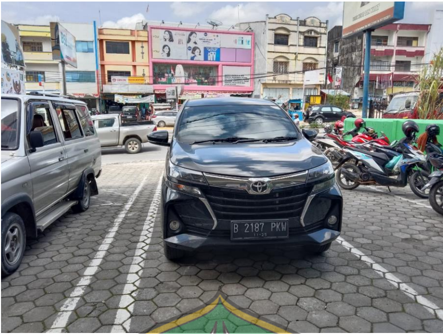
Nampak depan parkir Bank Syariah Indonesia cabang MT.Haryono