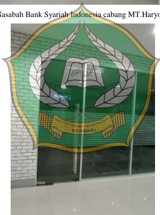
Ruang rapat bagi pegawai Bank Syariah Indonesia cabang MT.haryono