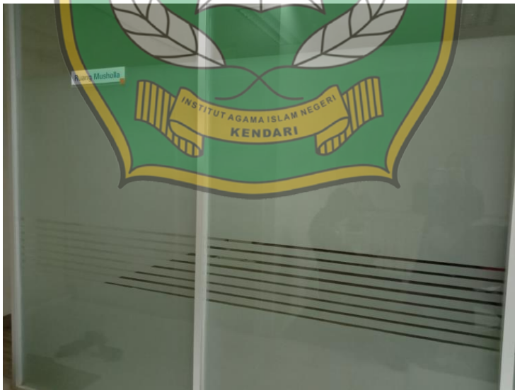
Fasilitas Mushola bagi pegawai Bank Syariah Indonesia cabang MT.Haryono