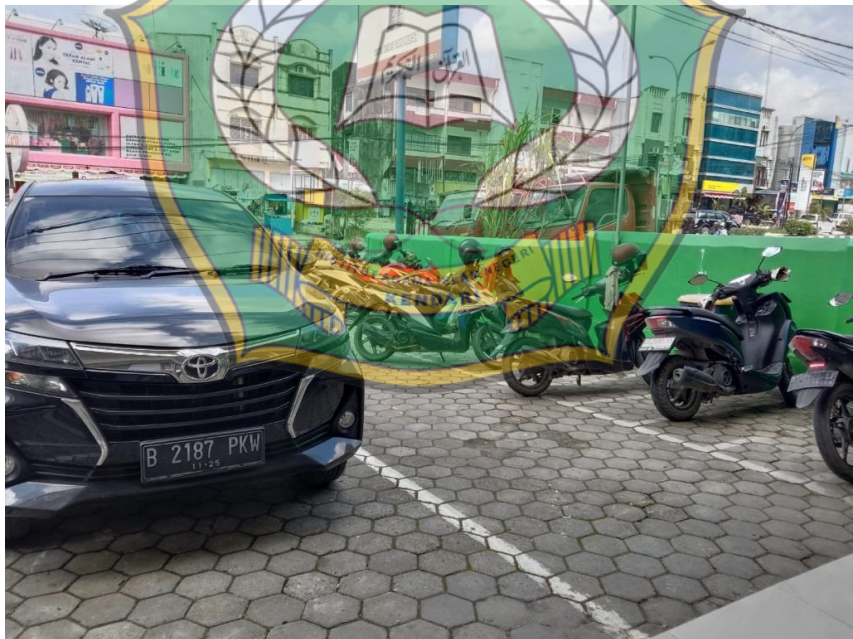
Nampak samping parkir Bank Syariah Indonesia cabang MT.haryono