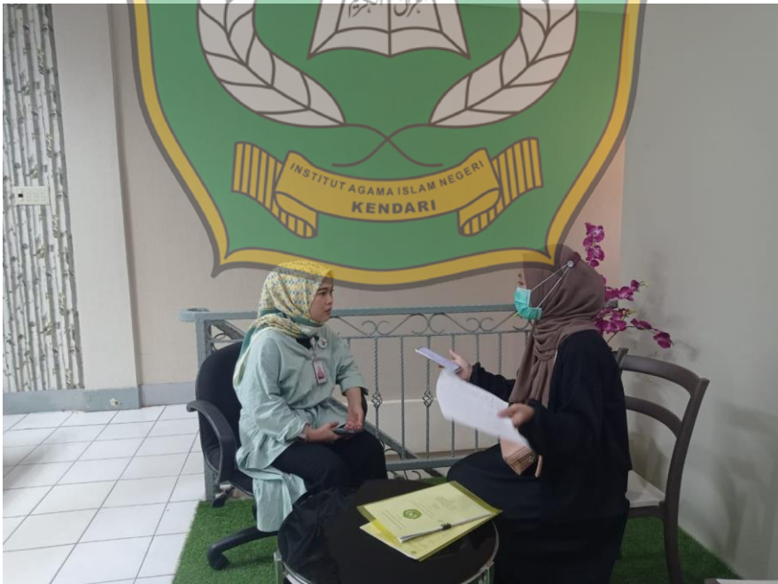
Wawancara pegawai Bank Syariah Indonesia cabang MT.Haryono