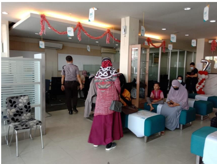
Nasabah Bank Syariah Indonesia cabang MT.Haryono