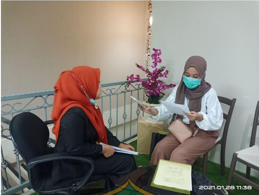
Wawancara pegawai Bank Syariah Indonesia cabang MT.Haryono