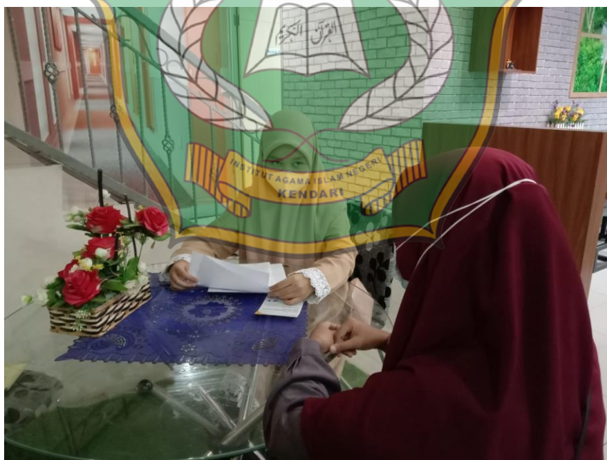
Proses wawancara nasabah Bank Syariah Indonesia cabang MT.Haryono