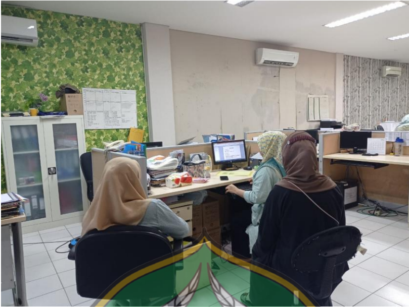
Wawancara pegawai Bank Syariah Indonesia cabang MT.Haryono