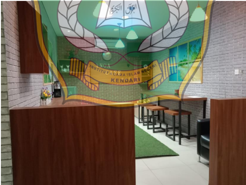
Fasilitas café bagi pegawai Bank Syariah Indonesia Cabang MT.Haryono