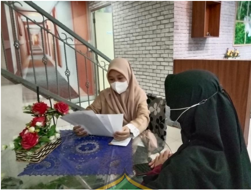
Proses wawancara nasabah Bank Syariah Indonesia cabang MT.Haryono