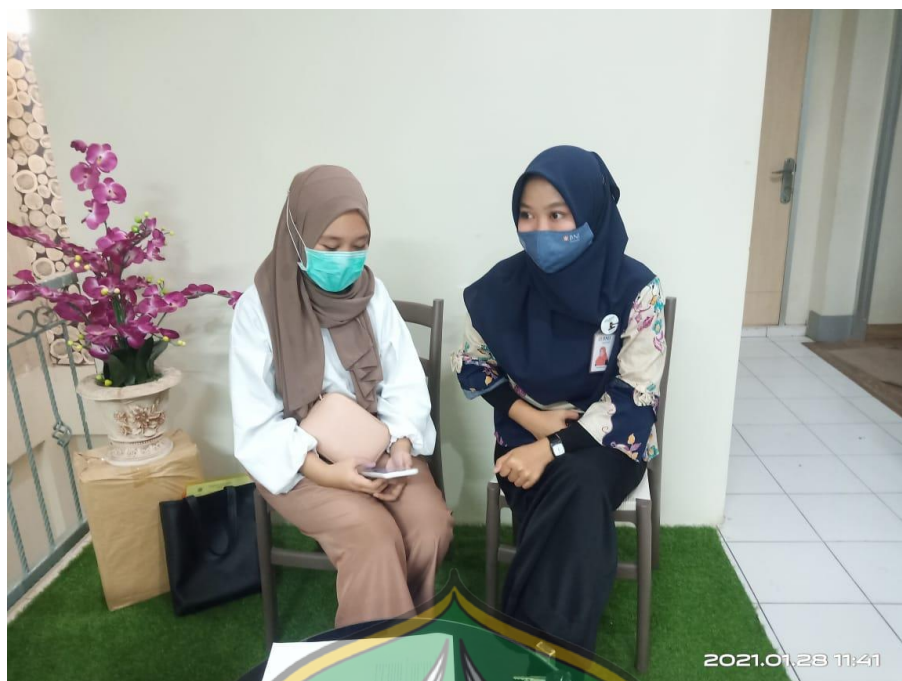
Wawancara pegawai Bank Syariah Indonesia cabang MT.Haryono