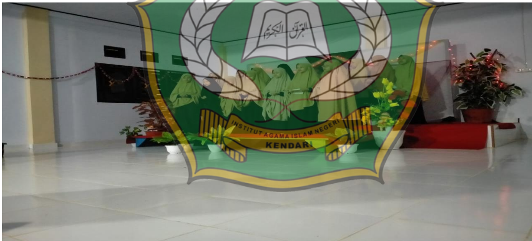
Kegiatan Muhadoroh Santri