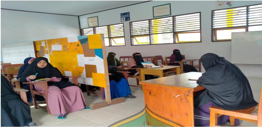
Kegiatan Halaqoh Santri