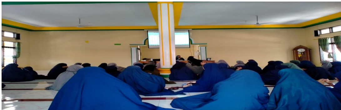
Kegiatan Lomba Cerdas Cermat Perkelompok Santri Mts