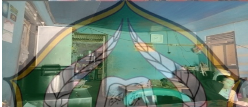
Rumah Makan (15 Mei 2022) Ibu Bude