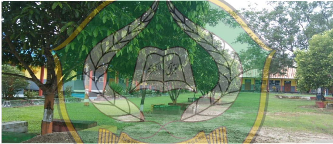
Halaman SMA Negeri 1 Amonggedo Tampak Bagian Depan Kiri