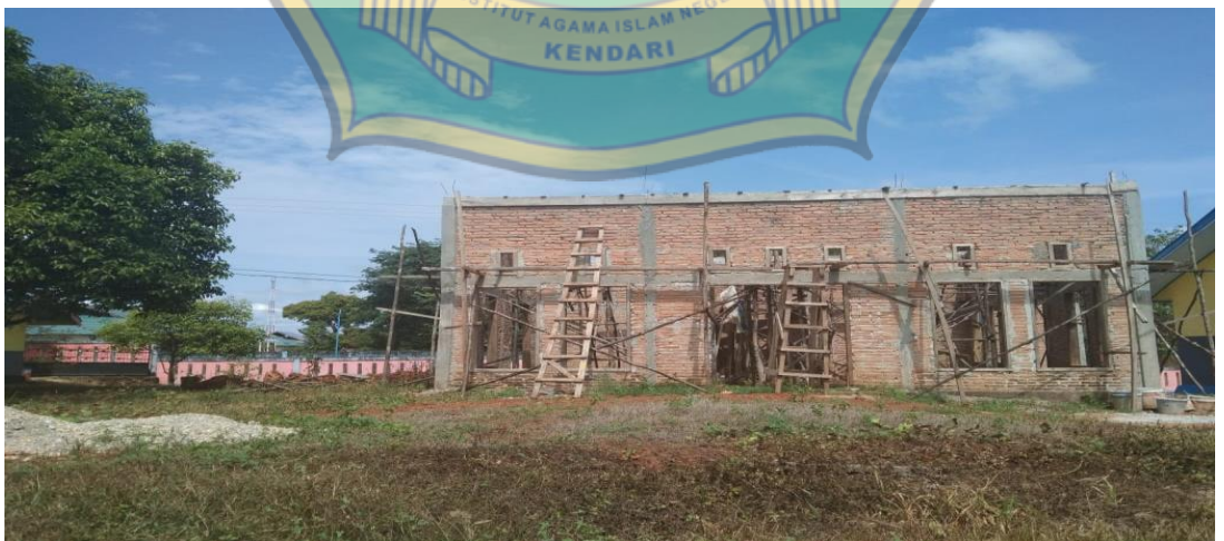
Pembangunan Mushola SMA Negeri 1 Amonggedo