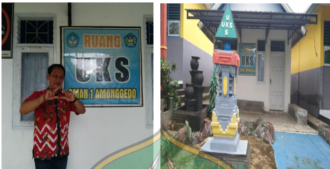
Ruang UKS SMA Negeri 1 Amonggedo