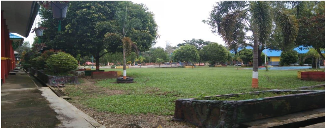
Halaman SMA Negeri 1 Amonggedo Tampak Bagian Belakang Kiri