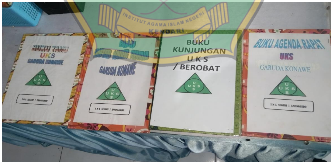
Buku Administrasi UKS SMA Negeri 1 Amonggedo