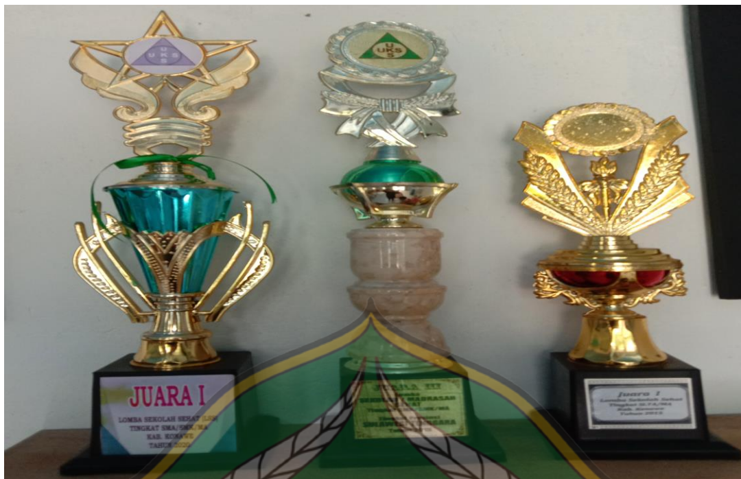
Piala Penghargaan Lomba Kegiatan UKS