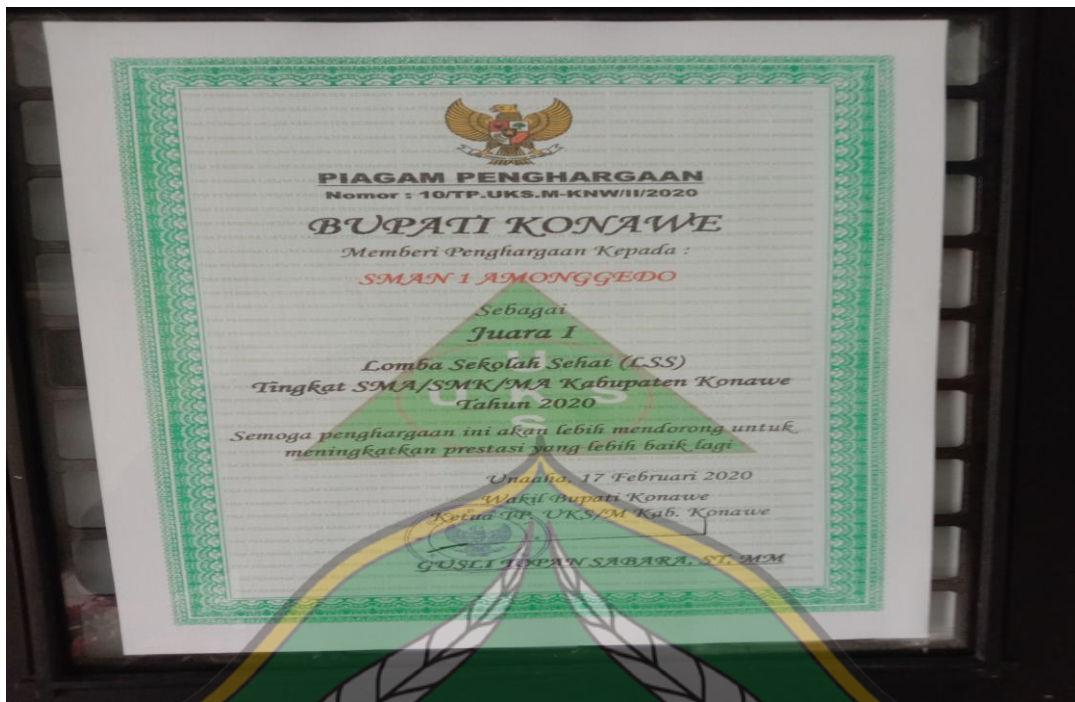
Piagam Perhargaan Juara I Lomba UKS Tingkat Kabupaten Konawe 2020