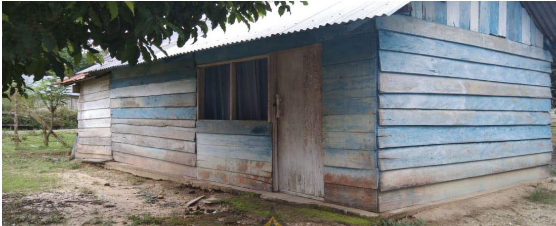
Kantin Sekolah 1 SMA Negeri 1 Amonggedo