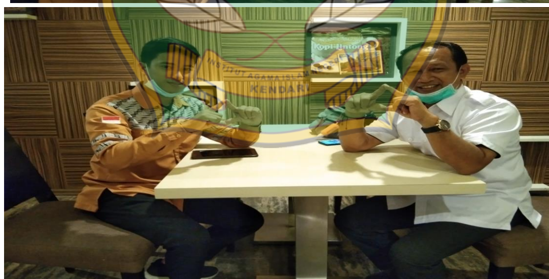
Wawancara Kedua dengan Kepala Sekolah SMA Negeri 1 Amongedo bertempat di Hotel Claro Kendari