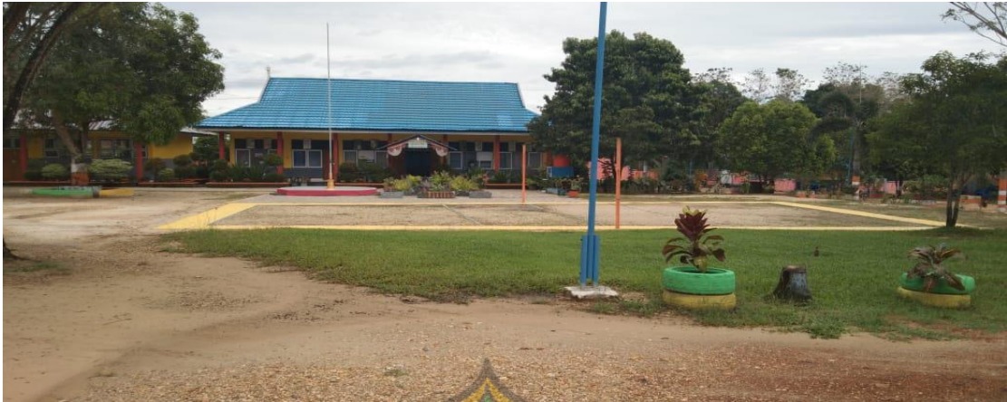
Halaman Depan Kantor SMA Negeri 1 Amonggedo