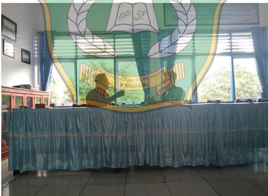
Wawancara Dengan Bapak Tanggapili Selaku Kepala Sekolah SMA Negeri 1 Amonggedo