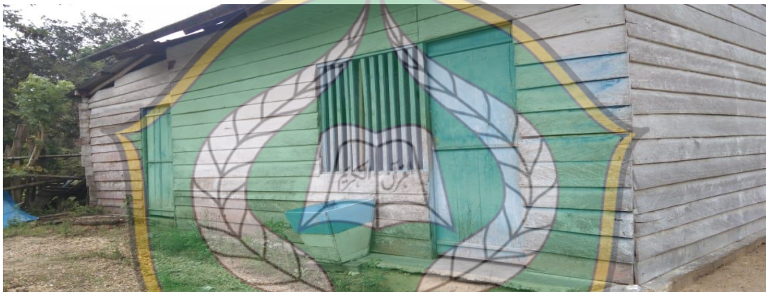
Kantin Sekolah 2 SMA Negeri 1 Amonggedo