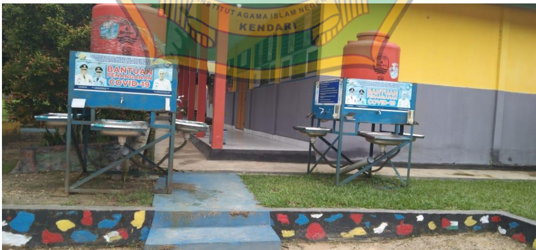
Tempat Cuci Tangan Untuk Umum Bantuan Dari Gubernur Sulawesi Tenggara