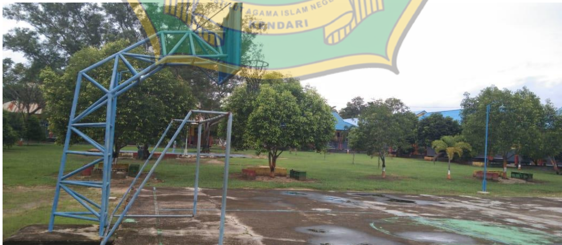
Halaman Tengah Lapangan SMA Negeri 1 Amonggedo