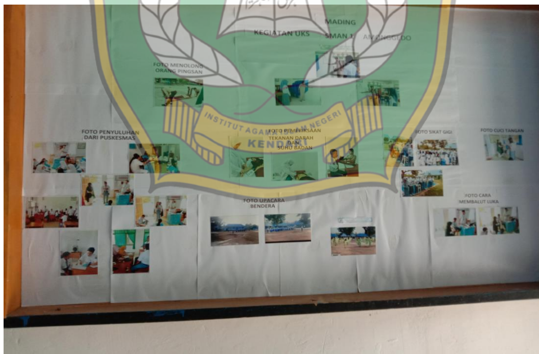
Foto-Foto Kegiatan UKS