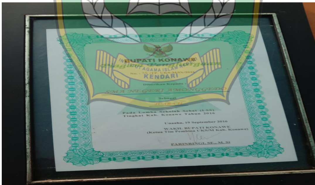
Piagam Penghargaan Juara II Lomba UKS Tingkat Kabupaten Konawe 2016