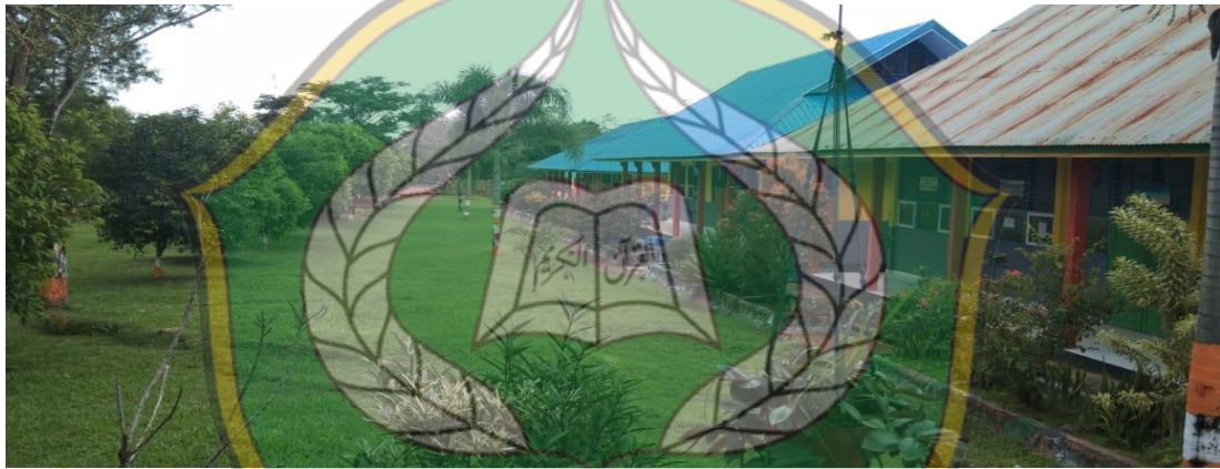
Halaman Depan SMA Negeri 1 Amonggedo