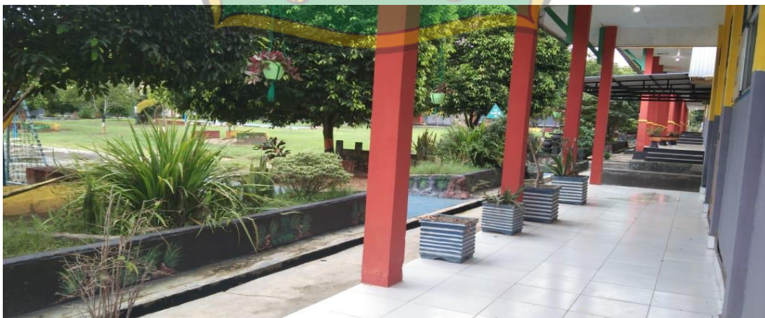
Halaman SMA Negeri 1 Amonggedo Tampak Bagian Depan Kanan