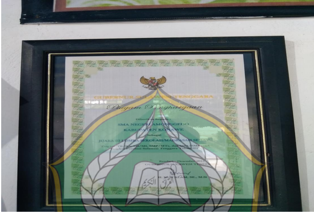
Piagam Penghargaan Juara III Lomba UKS Tingkat Provinsi Sulawesi Tenggara 2015