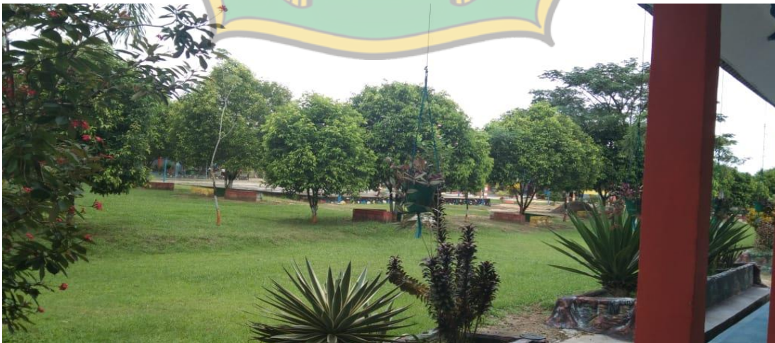
Halaman SMA Negeri 1 Amonggedo Tampak Bagian Belakang Kanan