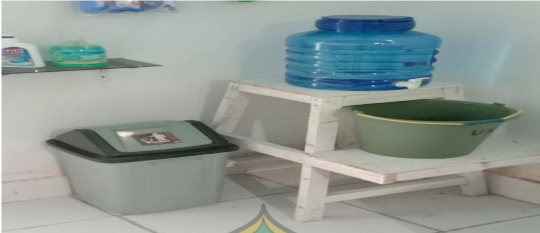
Tempat Cuci Tangan di Masing-Masing Kelas