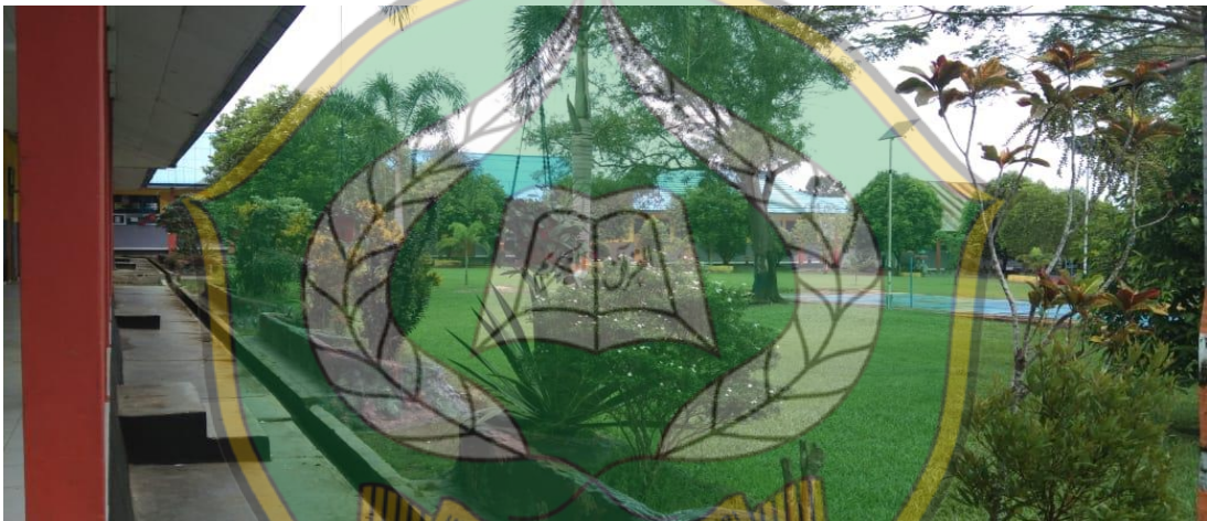
Halaman SMA Negeri 1 Amonggedo Tampak Bagian Belakang