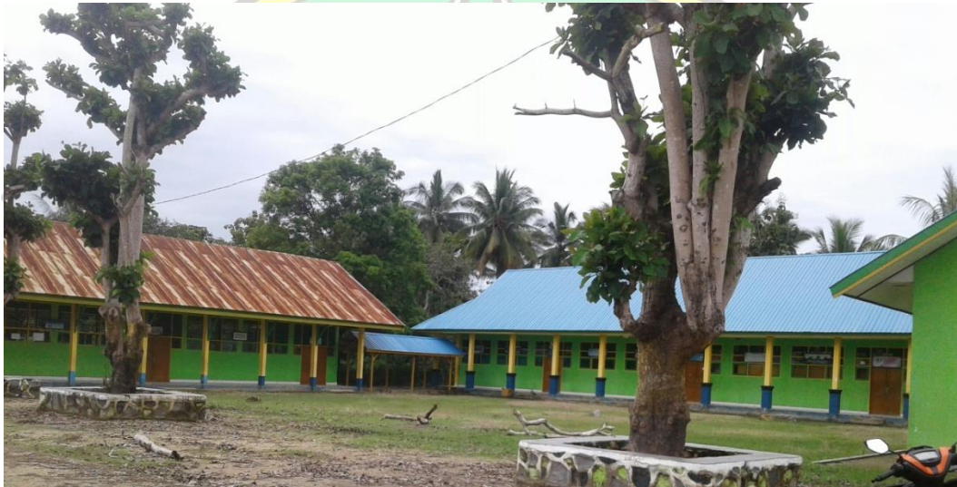
Gedung Belajar SMP Negeri 1 sawa