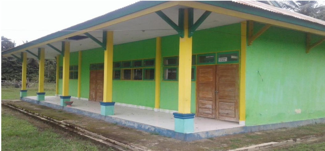
Laboratorium SMP Negeri 1 Sawa