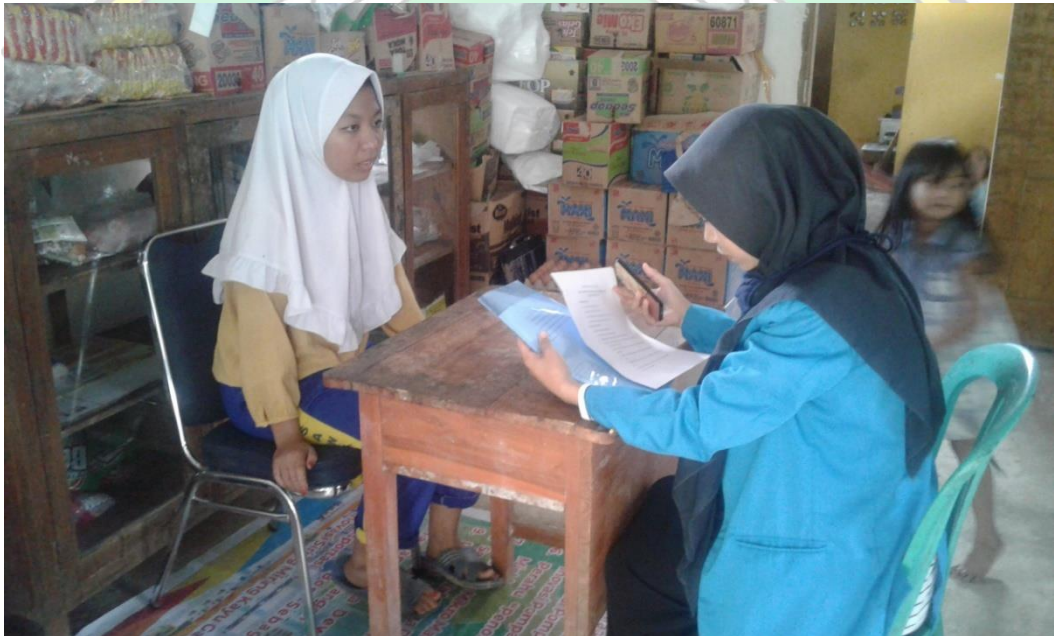
Wawancara dengan Siswa Kelas VIII A