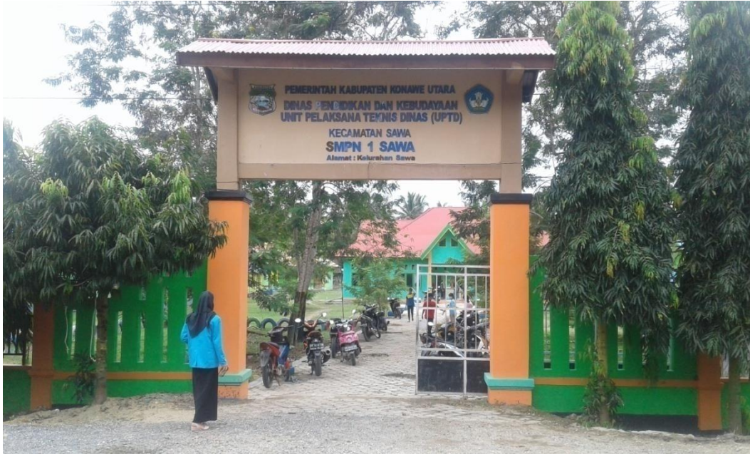
Gerbang SMP Negeri 1 Sawa