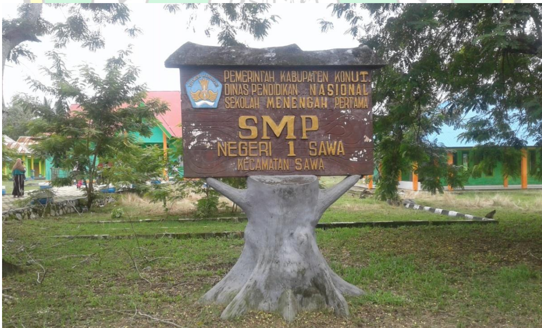
Papan Nama SMP Negeri 1 Sawa