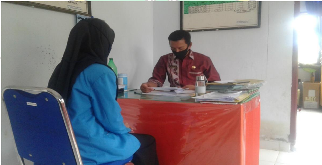
Penyerahan Surat Penelitian