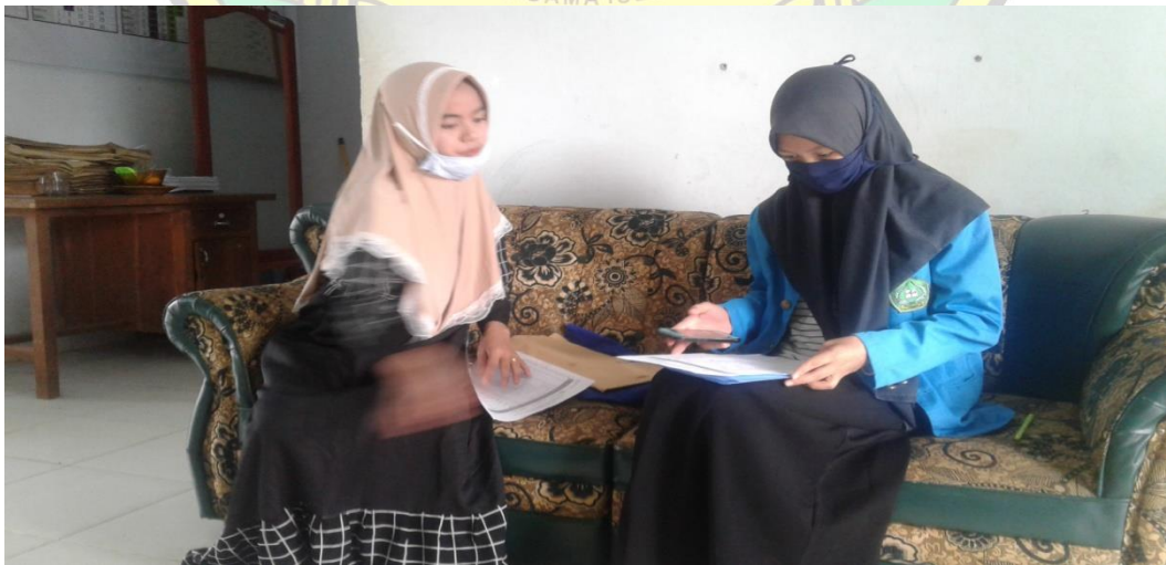
Saat Wawancara dengan Guru Matematika