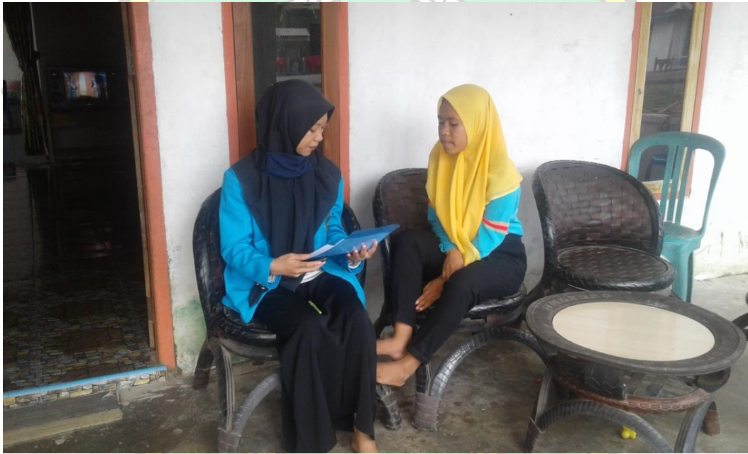
Wawancara dengan Siswa Kelas VIII B