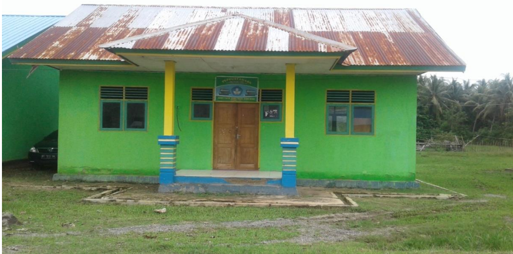
Perpustakaan SMP Negeri 1 Sawa