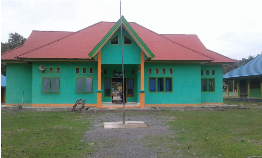
Kantor SMP Negeri 1 Sawa