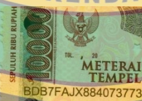
Rezki Nur Alam