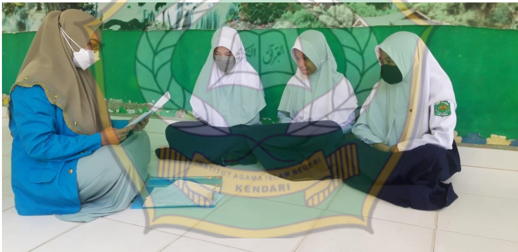
Wawancara bersama siswa MTsN 1 Konawe