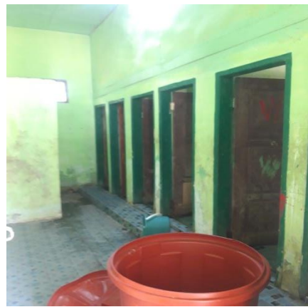
Kondisi Wc Pria/Wanita MTsN 1 Konawe