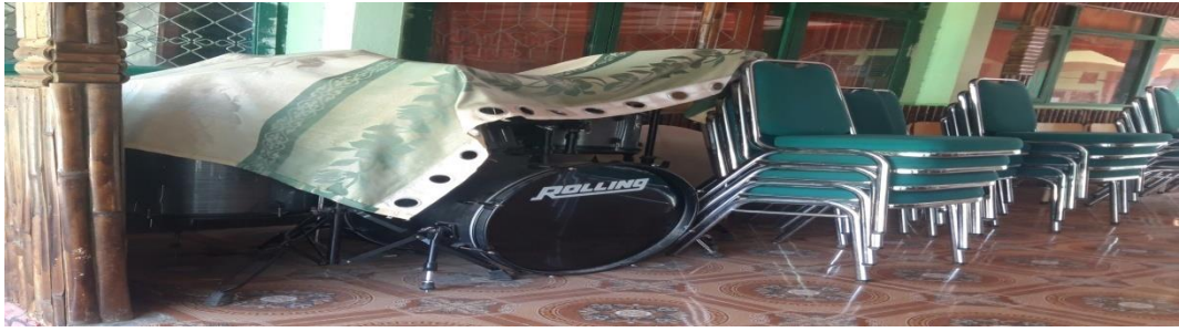
Kondisi Alat Band