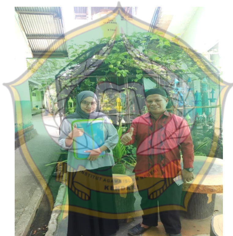
Foto Bersama Kepala Sekolah MTsN 1 Konawe