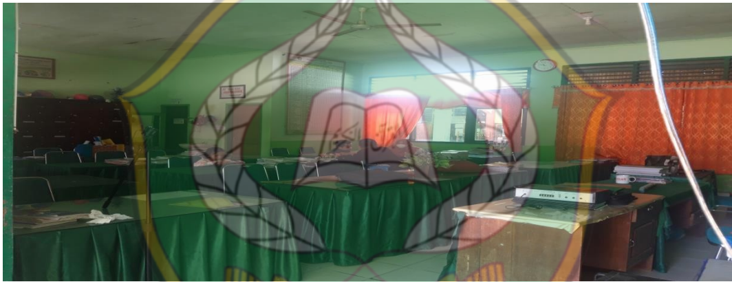
Ruang Guru MTsN 1 Konawe