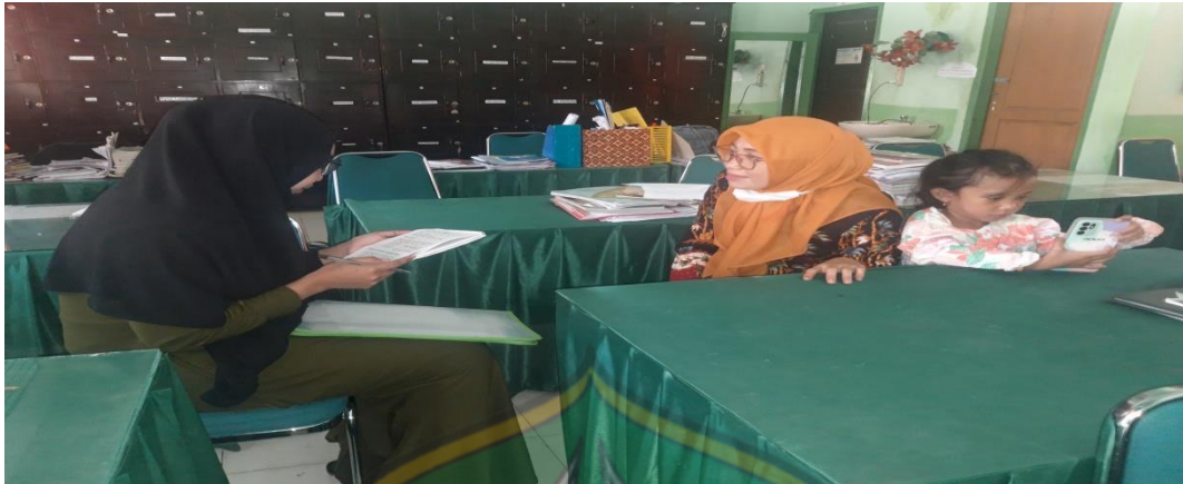
Wawancara bersama Waka Sarana dan Prasarana terkait pengelolaan sarana dan prasarana