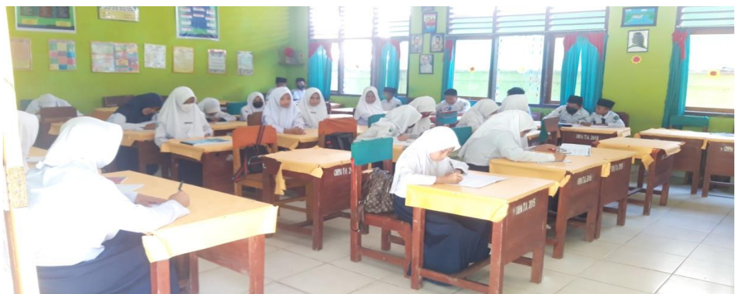
Ruang Kelas siswa