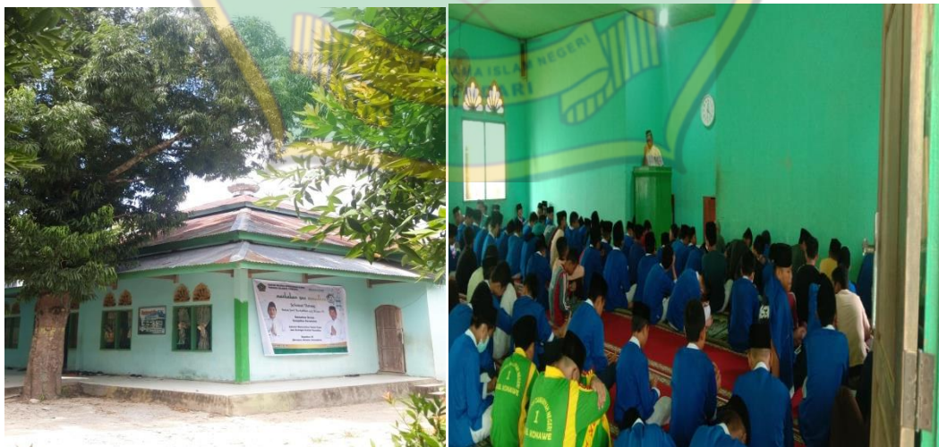
Musholla/Masjid MTsN 1 Konawe