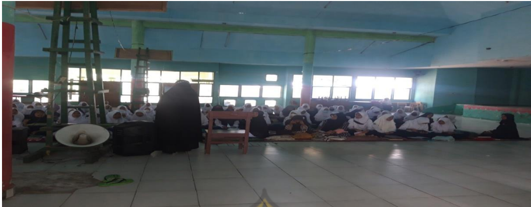
Aula MTsN 1 Konawe