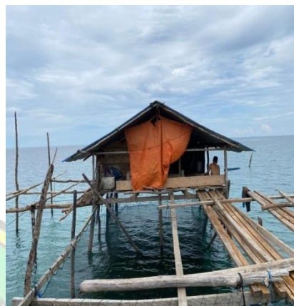
➤ Rumah Karamba