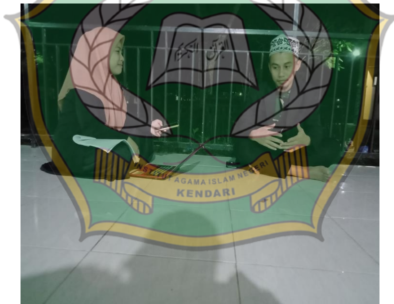
Jalil, wawancara 2 november 2021