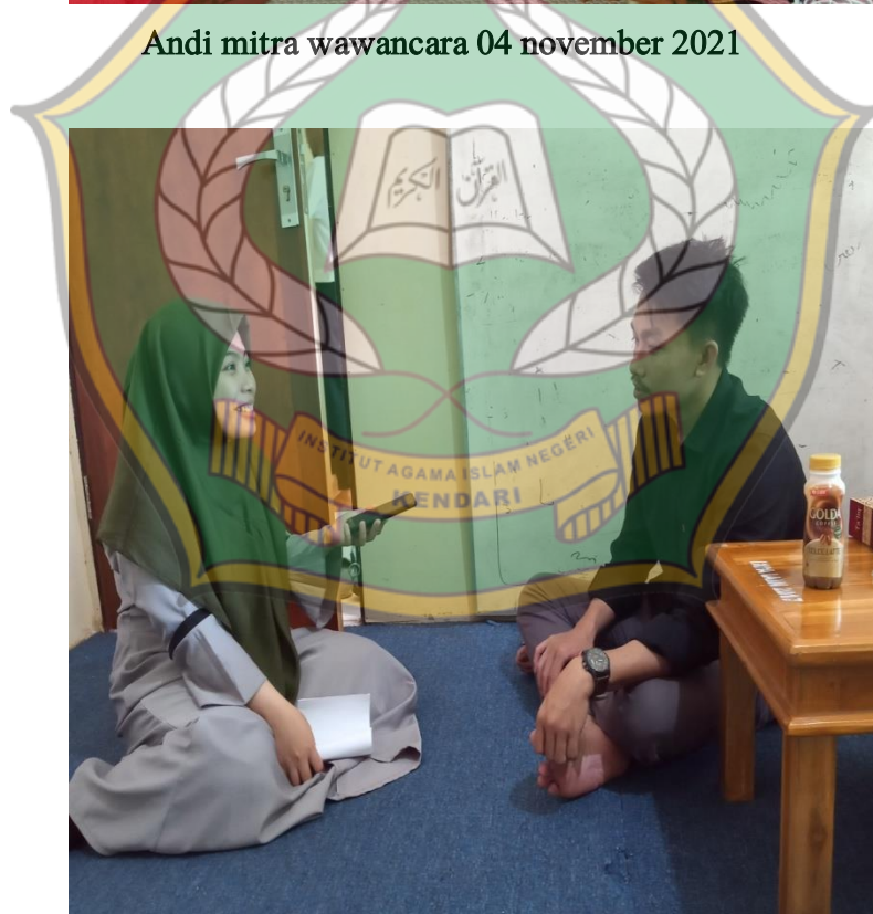
Muhammad Yunus wawancara 04 november 2021