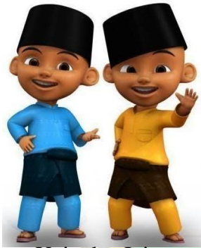
Upin dan Ipin