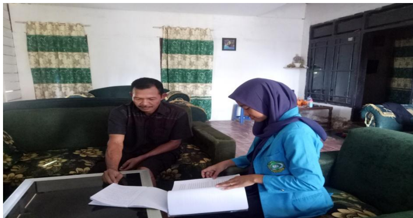
Gambar 3. Wawancara Bersama Pendamping PKH