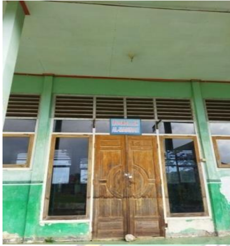
Ruangan ibadah (mushola)