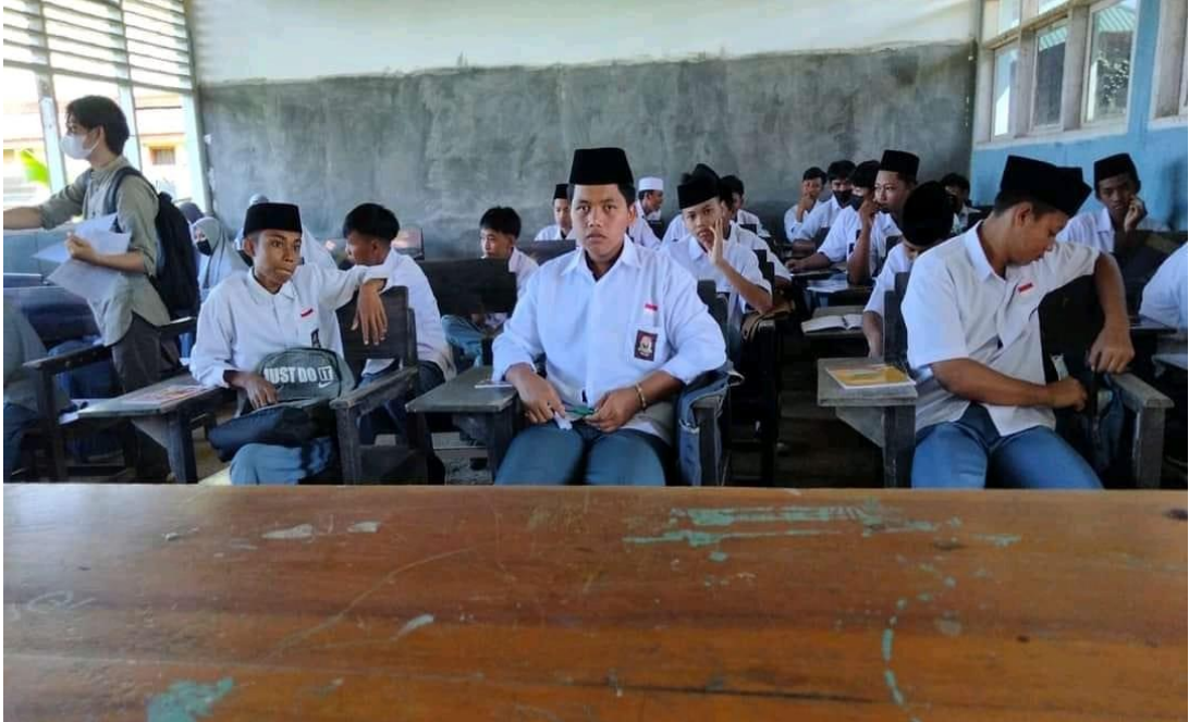
Pembagian lembar kuisioner