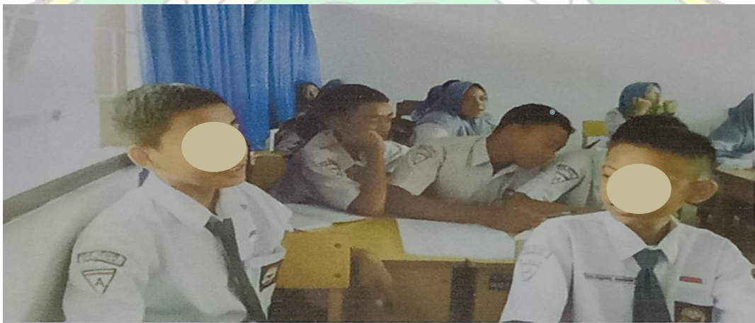
Picture 2. The students answered the teachers' question