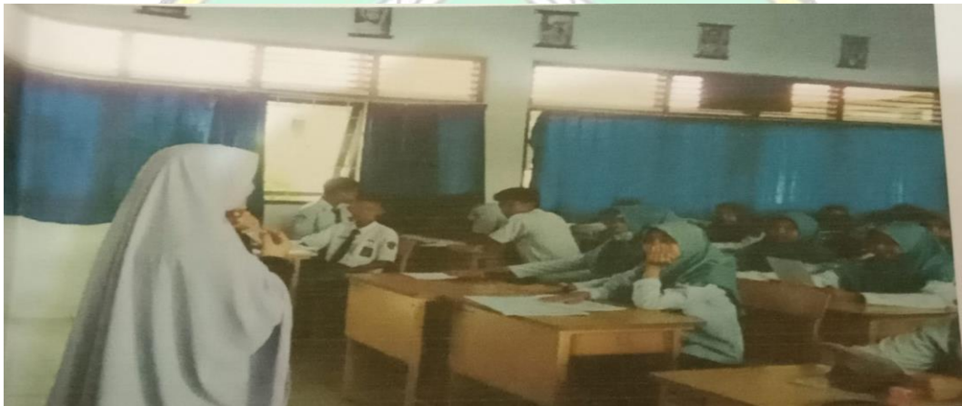
Picture 5. Study activities in classroom