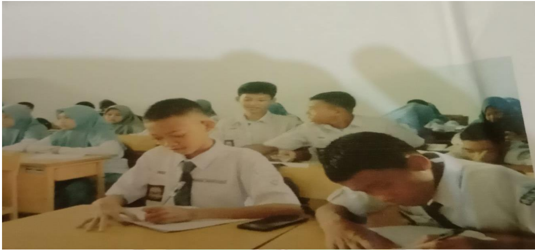
Picture 4. The students