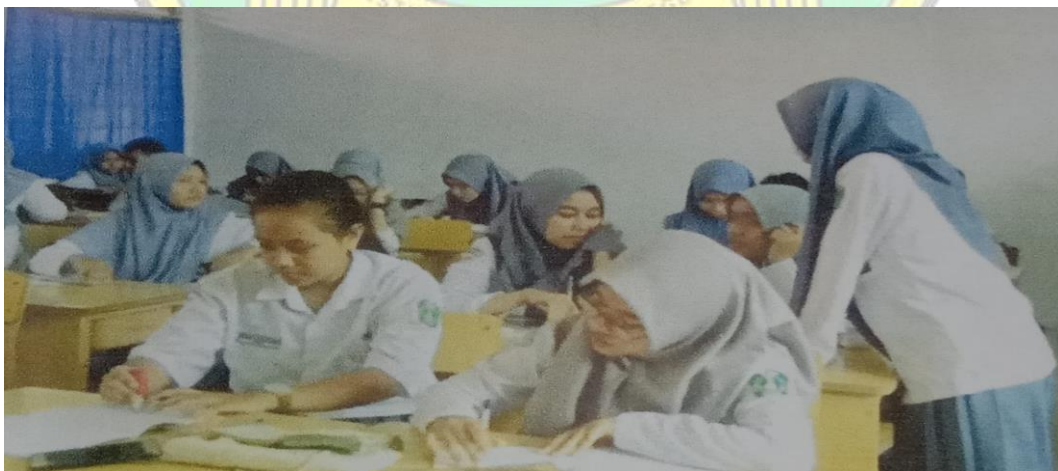
Picture 6. The students' discussion