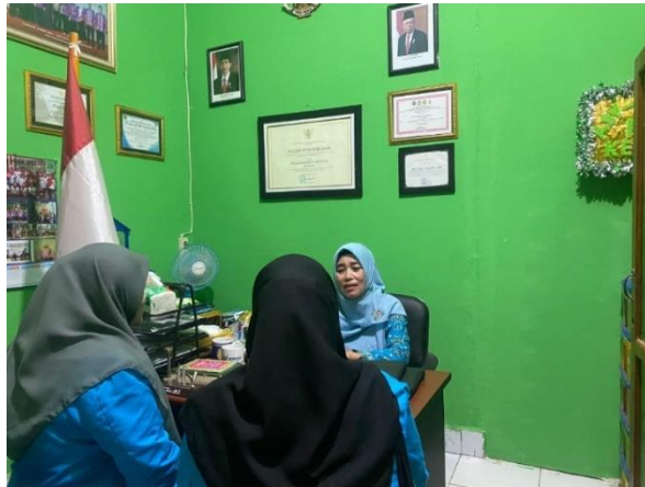
Gambar 6.11 Wawancara dengan Kepala Sekolah