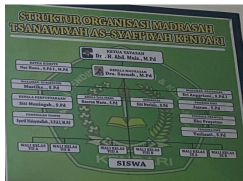
Gambar 6.13 Struktur Organisasi Mts Asy-syafi'iyah