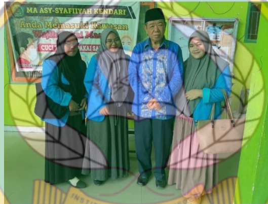
Gambar 6.12 Berfoto dengan ketua yayasan Asy-syafi'iyah