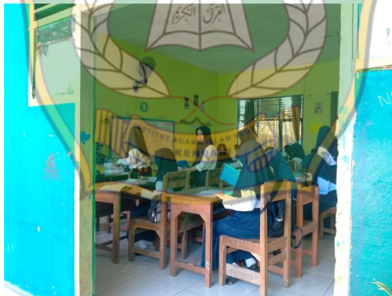
Gambar 6.4 Proses pengumpulan tugas yang diberikan guru