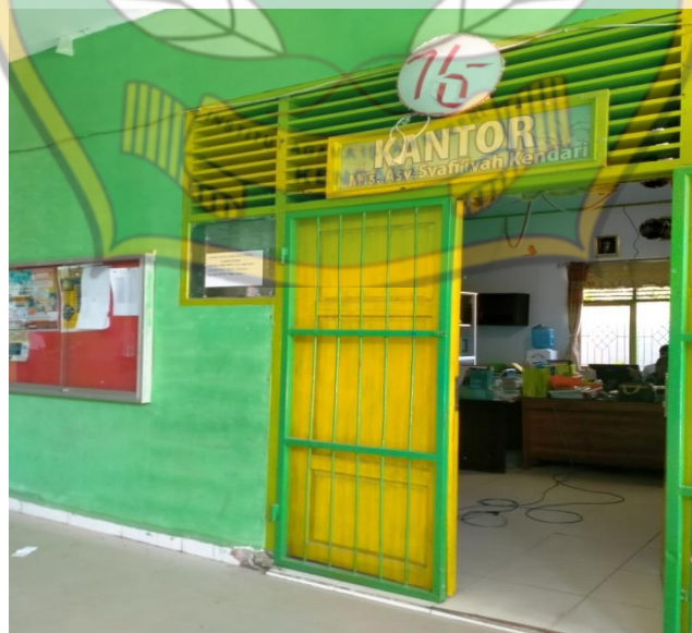
Gambar 6.2 Kantor MTs Asy-syafi'iyah Baruga kota Kendari

Kantor Yayasan pendidikan Agama dan Keagamaan Asy-syafi'iyah Kendari