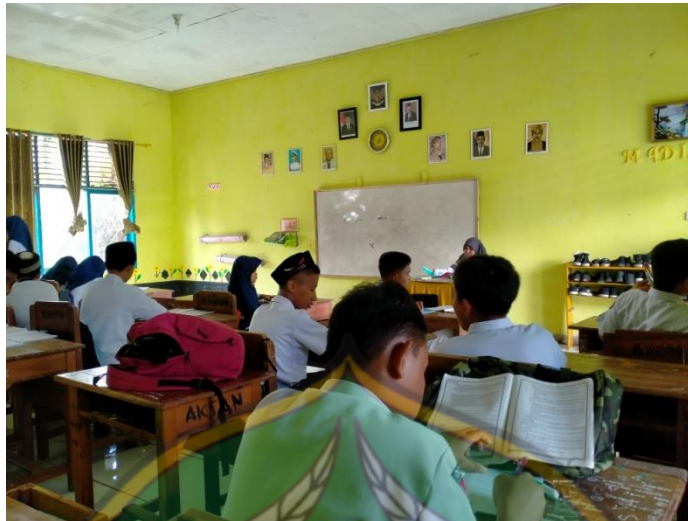
Gambar 6.3 Proses Belajar Mengajar siswa kelas VIII MTs Asy-syafi'iyah