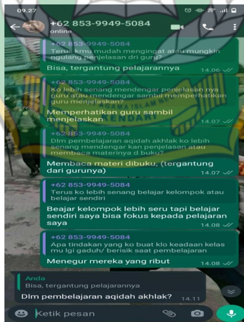
Gambar 6.10 Wawancara dengan siswi Mawa