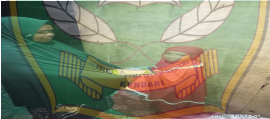
2. Bermain Bersama di luar ruangan atau lapangan