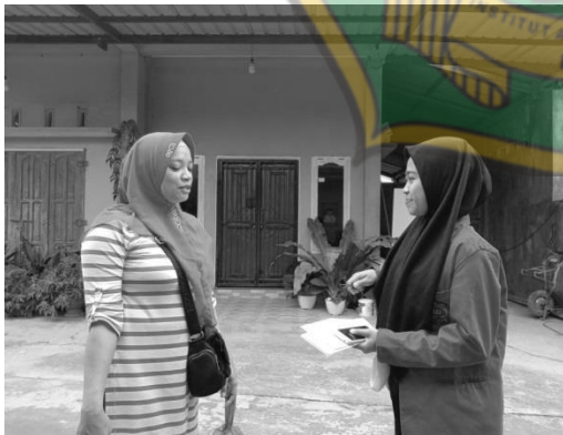
Wawancara Informan, ibu R