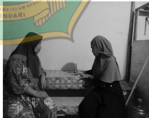
Wawancara ibu S