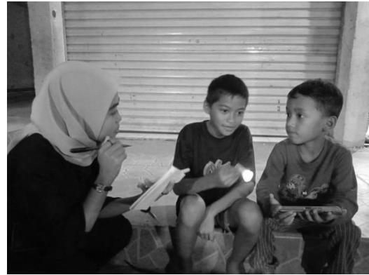
Wawancara Informan, adi A