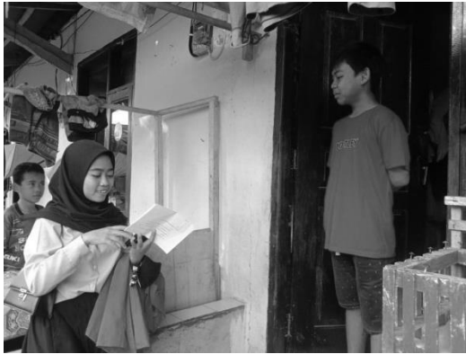
Wawancara Informan, adik A