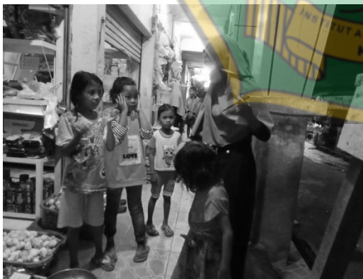
Dokumentasi pengambilan data penduduk yang tinggal di pasar