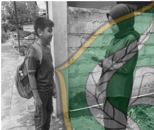
Wawancara Informan, adik F