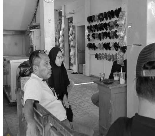
Wawancara Kepala Pasar