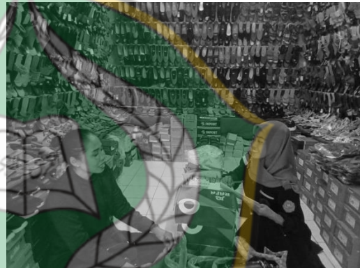
Wawancara Informan, ibu N H