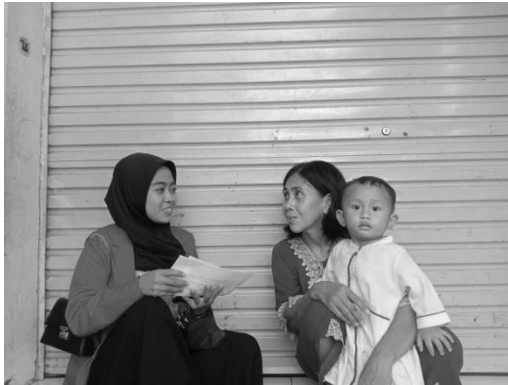
Wawancara Informan, ibu J