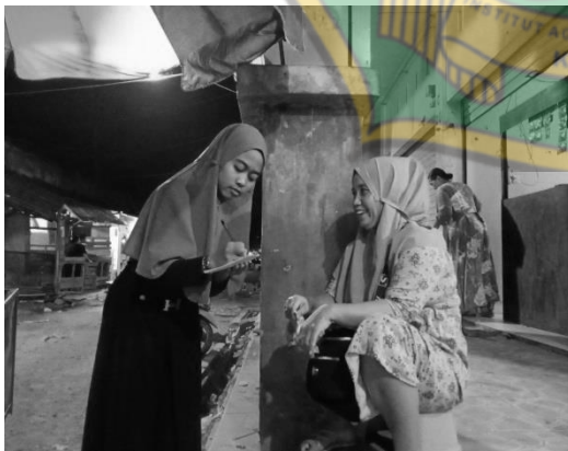
Wawancara ibu I M