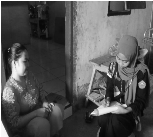
Wawancara ibu F