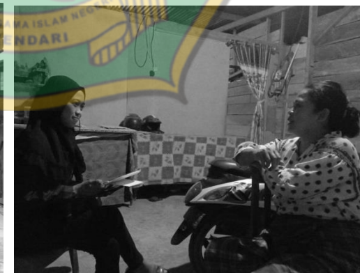
Wawancara Informan, Ibu RT