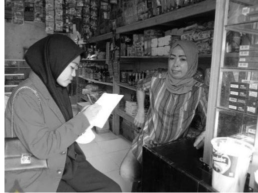
Wawancara Informan, Ibu T