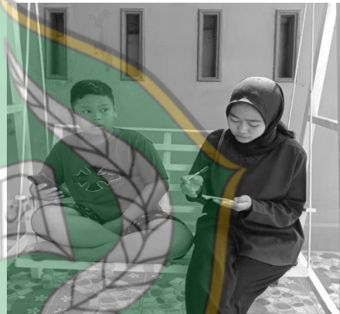
Wawancara adik R H