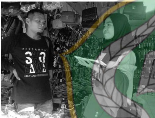
Wawancara Informan, bapak H