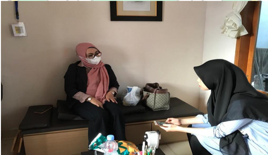
Wawancara dengan Ibu MW salah satu nasabah Bank syariah indonesia KC. Kolaka Selasa 22 Desember 2021