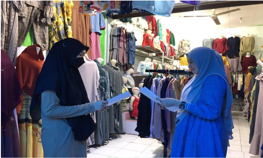
Wawancara dengan Ibu W salah satu nasabah Bank syariah indonesia KC. Kolaka Selasa 13 Desember 2021