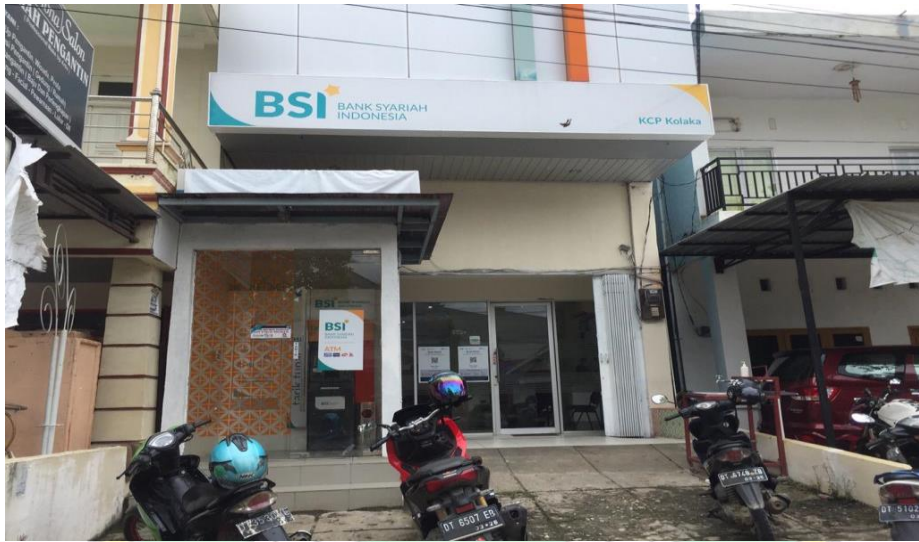
Tampak luar bank syariah Indonesia KC. Kolaka