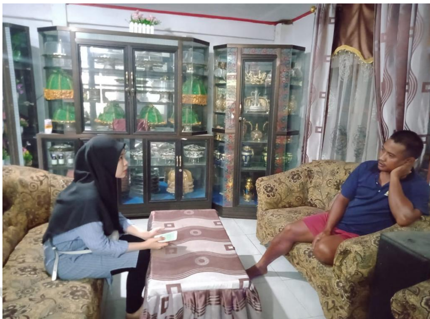
Wawancara dengan bapak S salah satu nasabah bank syariah Indonesia KC. Kolaka 23 Desember 2021