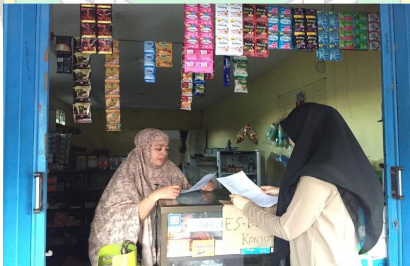
Wawancara dengan Ibu E salah satu nasabah Bank syariah indonesia KC. Kolaka Selasa 09 Desember 2021