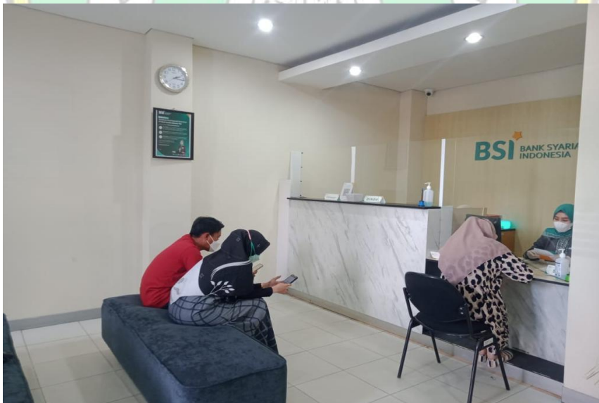
Kondisi di dalam bank syariah Indonesia KC. Kolaka pada jam pelayanan