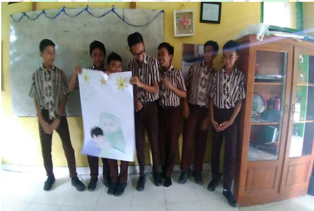
Gambar 10. Aktivitas Pembelajaran Praktek di Kelas VIII