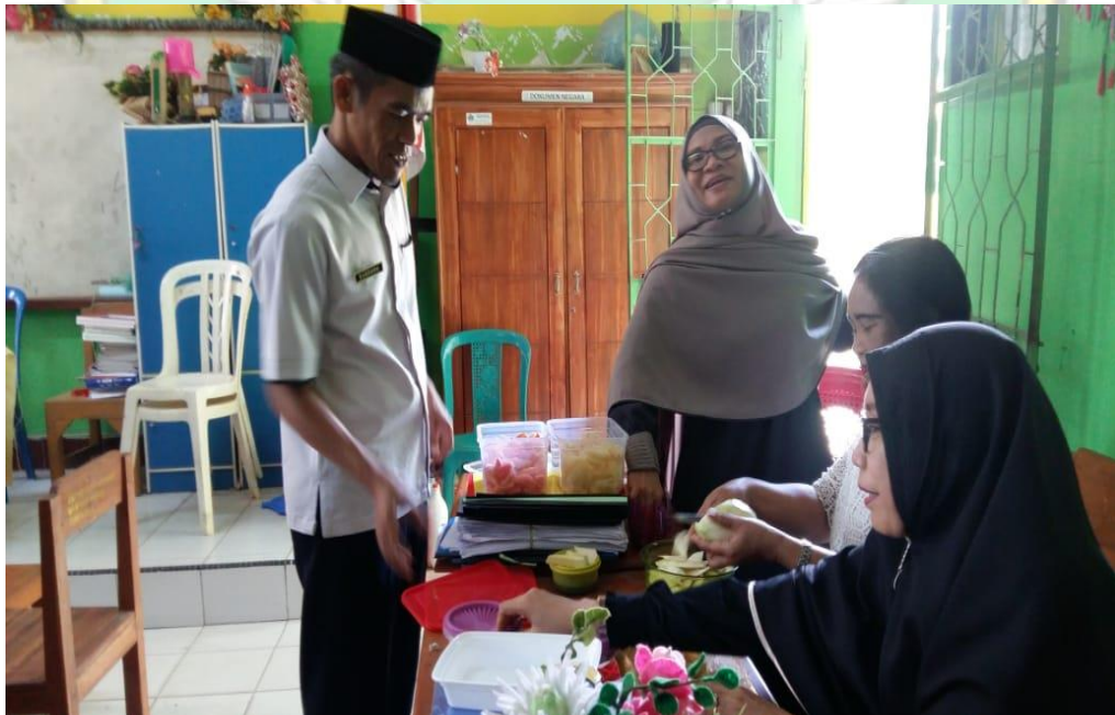
Gambar 4. Melakukan koordinasi bersama rekan Guru PAI dan rekan sejawat Guru Kelas VIII