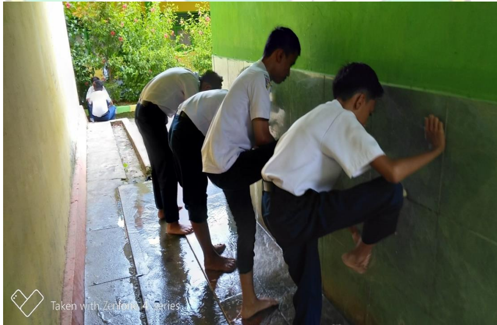
Gambar 8. Aktivitas Pembelajaran Praktek di Mushallah Kelas VIII