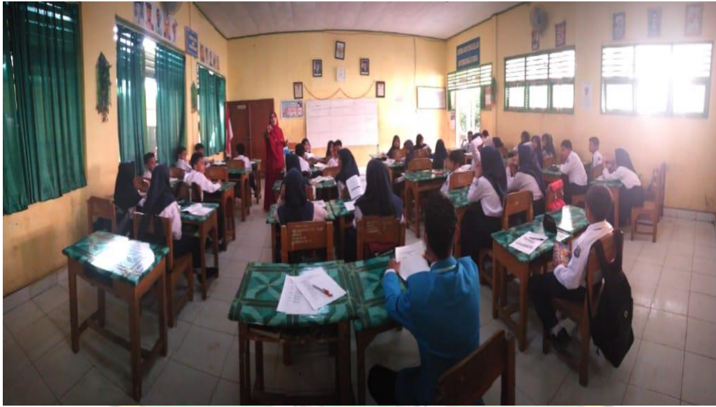
Gambar 5. Aktivitas Pembelajaran PAI Kelas VII