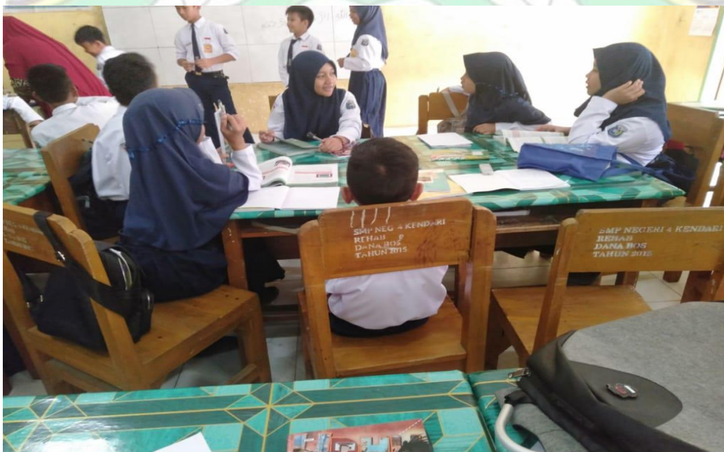
Gambar 6. Aktivitas Pembelajaran PAI Kelas VIII