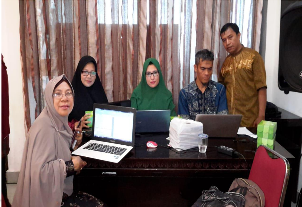
Gambar 3. Melakukan koordinasi bersama rekan Guru PAI dan rekan sejawat Guru Kelas VII