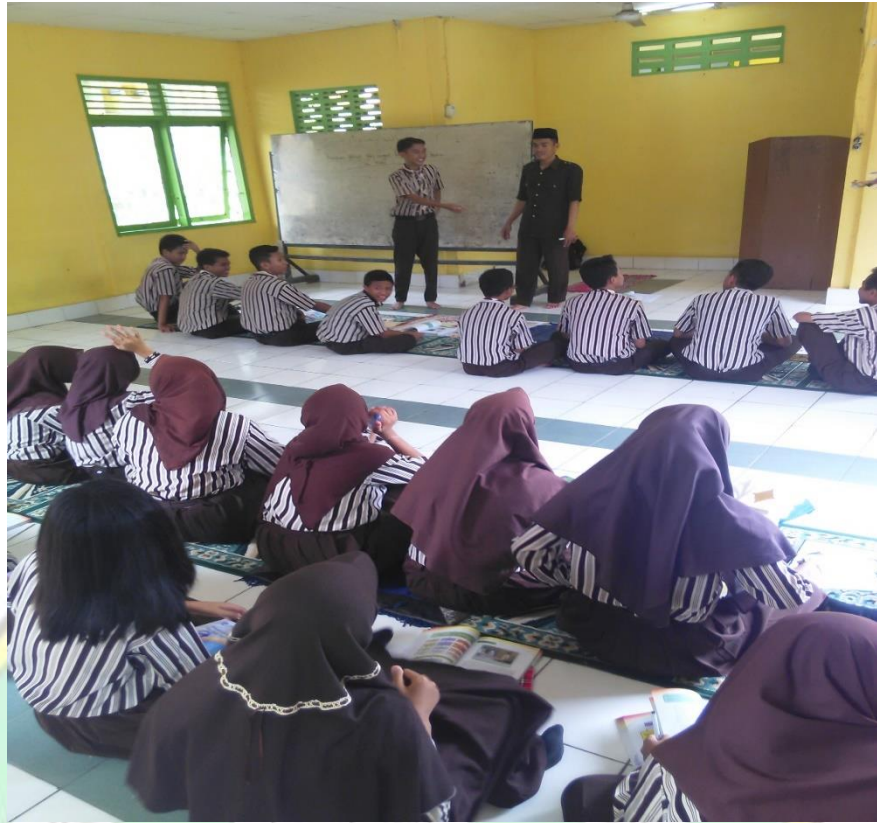
Gambar 7. Aktivitas Pembelajaran Praktek di Mushallah kelas VII