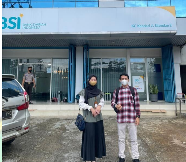
Gambar depan PT. BSI Tbk KC Kendari A Silondae 2