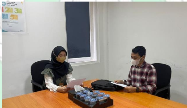
Gambar wawancara Staff yang mewakili Bagian Pembiayaan PT. BSI Tbk KC Kendari A Silondae 2