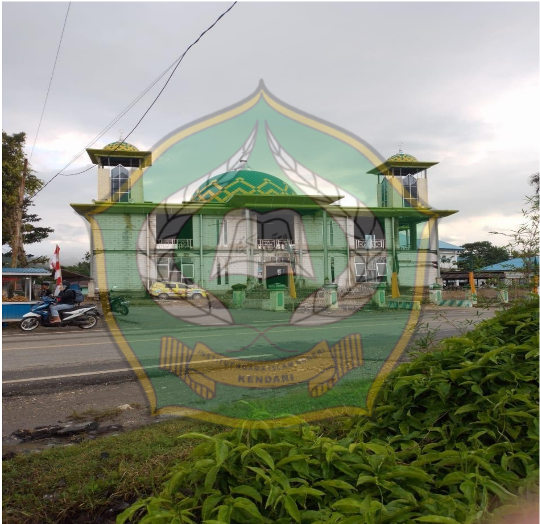
Gambar 1. Masjid Jabal Nur Rate-rate yang merupakan tempat pembayaran Zakat dan Infaq UPZ Kecamatan Tirawuta