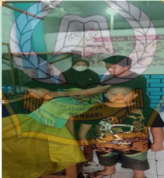
Gambar 10. Dokumentasi wawancara dengan penerima zakat produktif (Usaha Cukur Rambut)