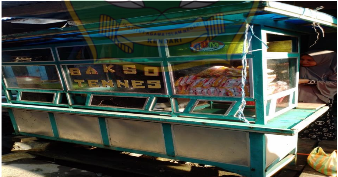
Gambar 12. Dokumentasi usaha penerima zakat produktif (Pedagang Bakso)