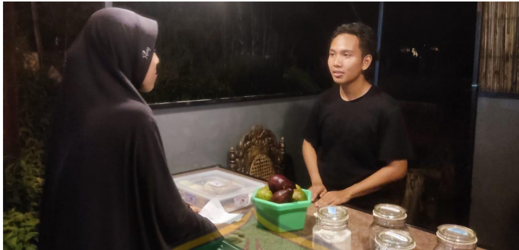
Gambar 7. Dokumentasi wawancara dengan penerima zakat produktif (Usaha Jual Minuman dan Cemilan)