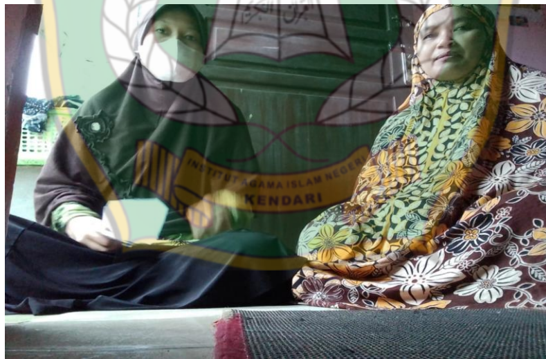
Gambar 8: Dokumentasi wawancara dengan penerima zakat produktif (Usaha Jahit Baju)