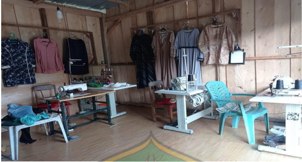
Gambar 9. Dokumentasi usaha penerima zakat produktif (Usaha Jahit Baju)