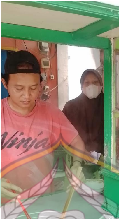
Gambar 11. Dokumentasi wawancara dengan penerima zakat produktif (pedagang bakso)