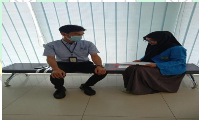
Wawancara dengan nasabah BSI KC Kendari A Silondae 2 ,