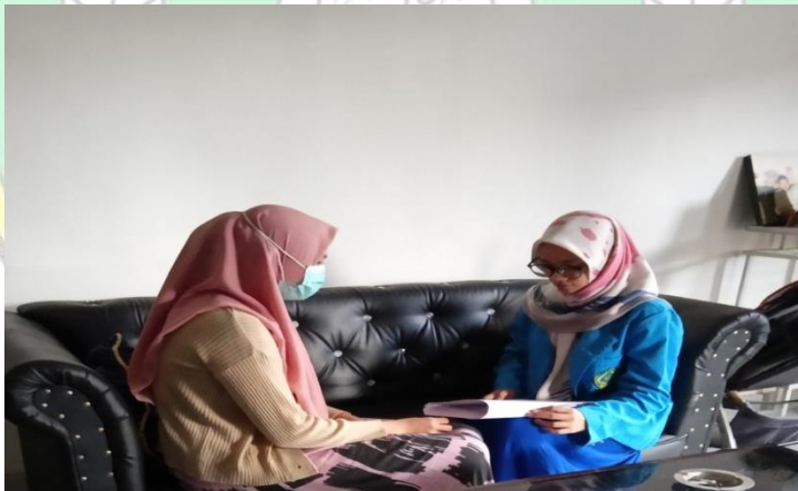
Wawancara dengan nasabah BSI KC Kendari A Silondae 2,