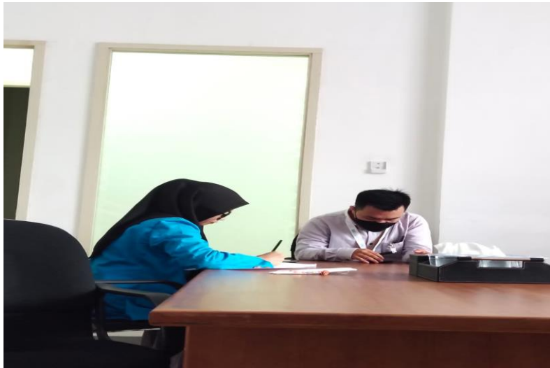
Wawancara peneliti dengan marketing funding BSI Silondae 2, wawancara 20 juli 2022