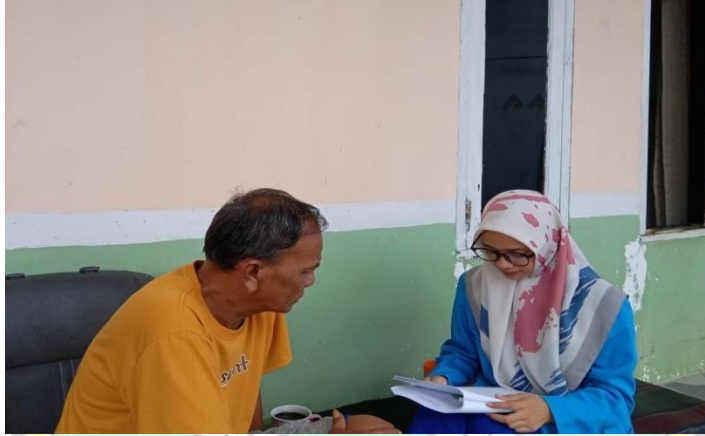
Wawancara dengan nasabah BSI KC Kendari A Silondae 2,