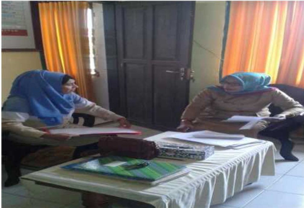
Wawancara dengan Kepala SD Neg. 9 Katobu