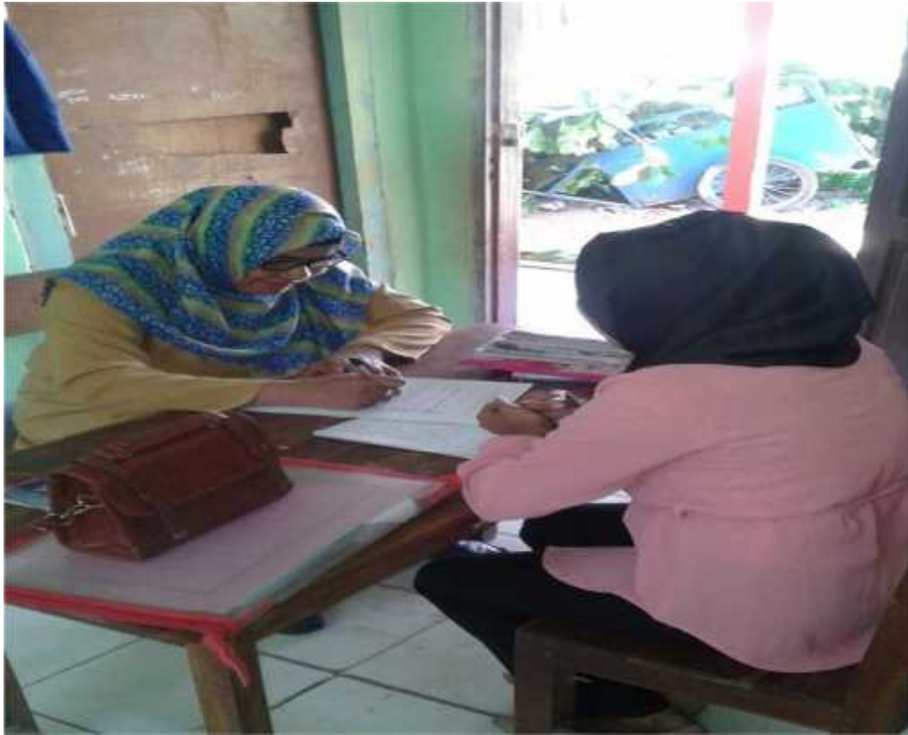
Wawancara dengan Guru PAI SD Neg. 3 katubu