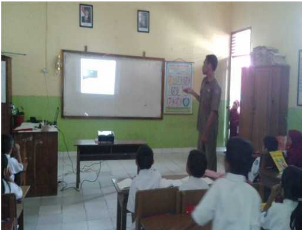
Kegiatan Pembelajaran Dengan Menggunakan Media Pembelajaran