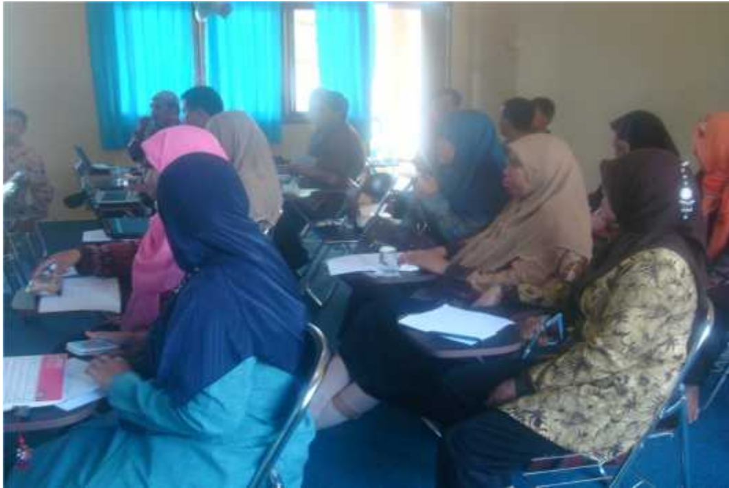
Foto Kegiatan Pelatihan Penyusunan Perangkat Pembelajaran Guru PAI (KKG) SD Se-Kec. Katobu