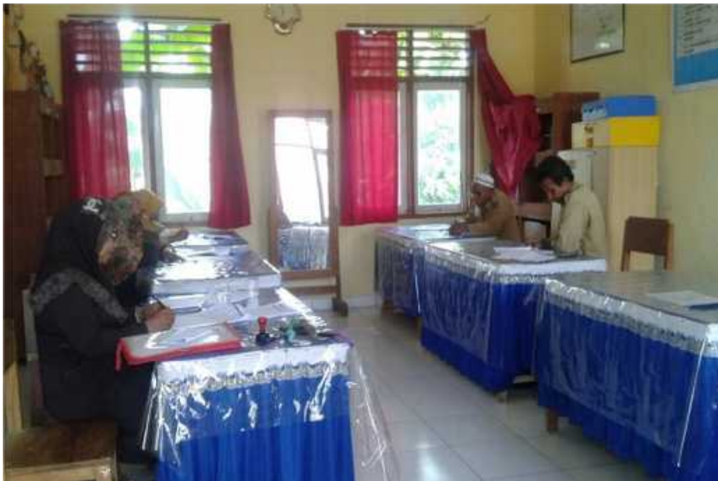
Kegiatan KKG guru SD 11 Katobu bersama pengawas dalam upaya meningkatkan Kinerja dan Profesionalisme Guru Kelas