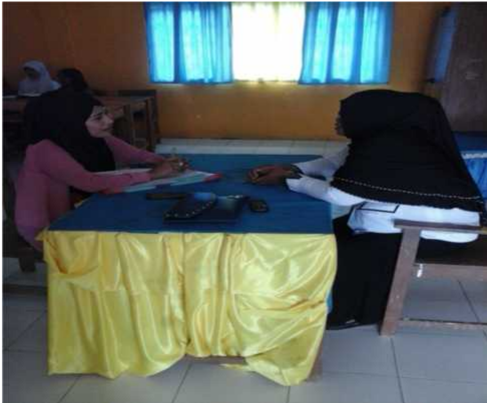
Wawancara dengan guru Kelas SD Neg. 12 Katobu