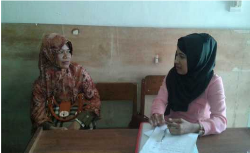
Wawancara dengan Guru MI Fookuni Raha Kec. Katubu