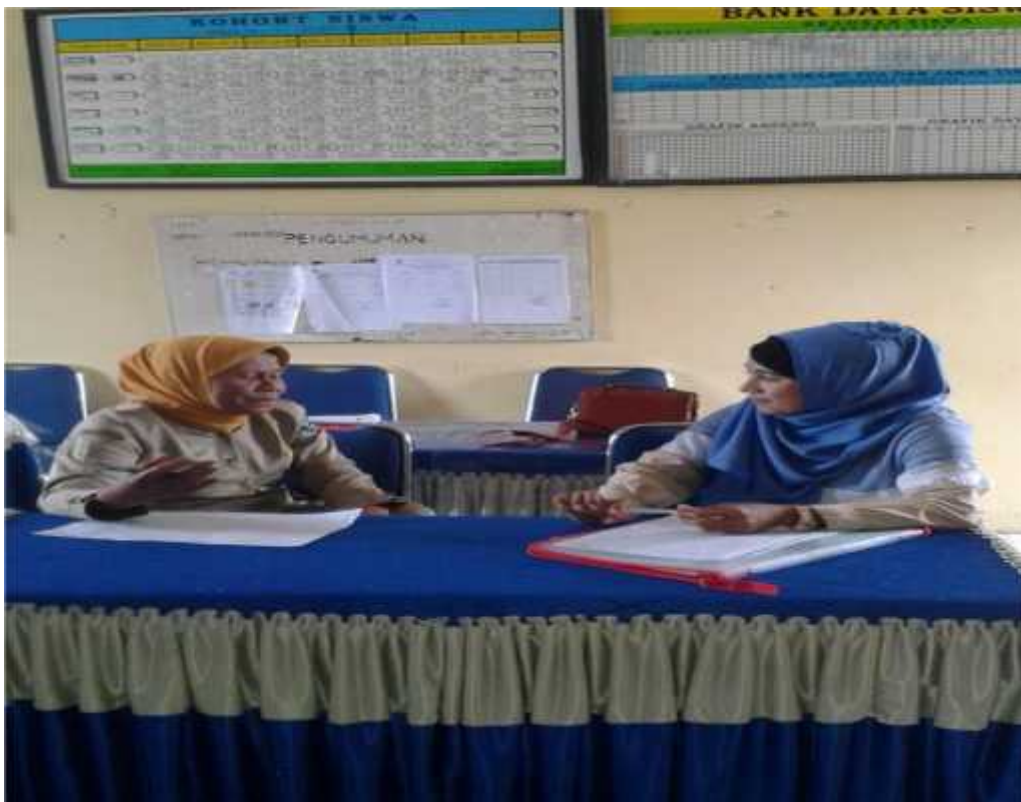
Wawancara Dengan Guru Kelas SD NEG. 9 Katobu