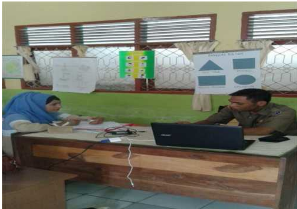
Wawancara dengan Guru PAI SD Neg.9 Katobu (Ketua KKG PAI Kec.Katobu)