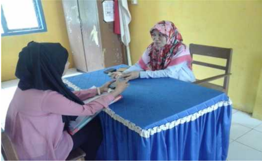
Wawancara dengan guru PAI SD 12 Katobu