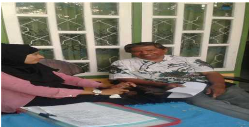
Wawancara dengan Koordinator pengawas SD Kab. Muna (Pengawas SD Kec. Katobu)