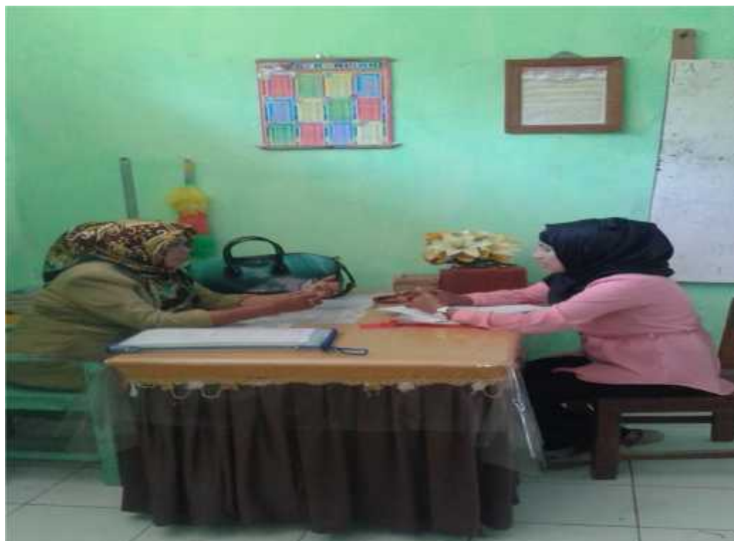
Wawancara dengan Guru Kelas SD Neg. 3 Katobu