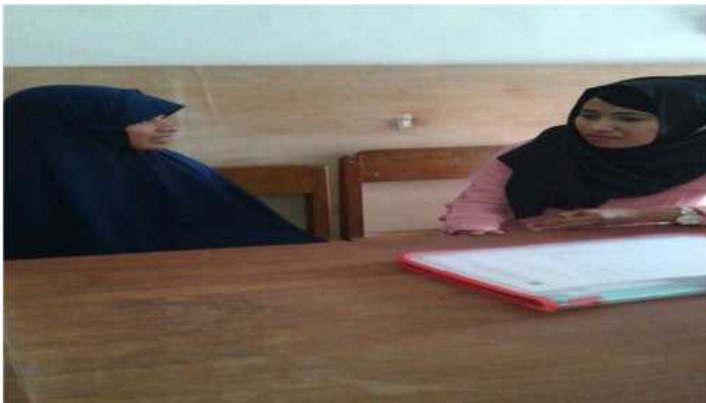
Wawancara dengan Guru PAI MI Fookuni Raha Kec. Katubu