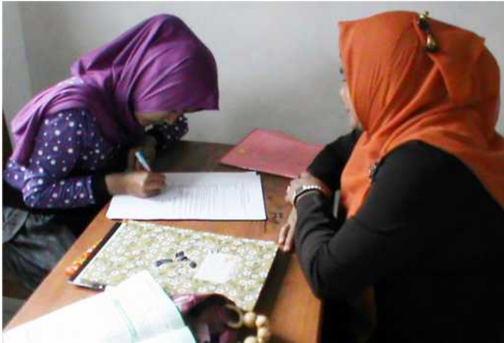
Wawancara dengan Kepala Sekolah SD Neg. 1 Katobu