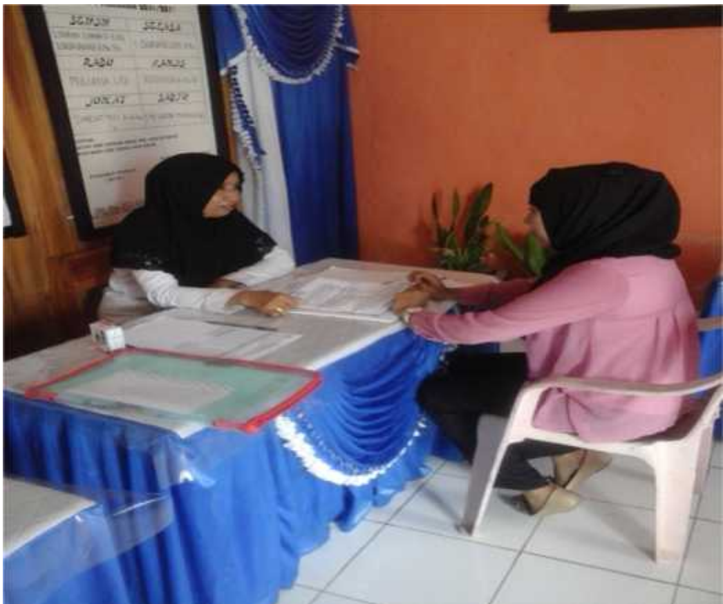
Wawancara dengan Kepala SD. Neg. 12 Katubu