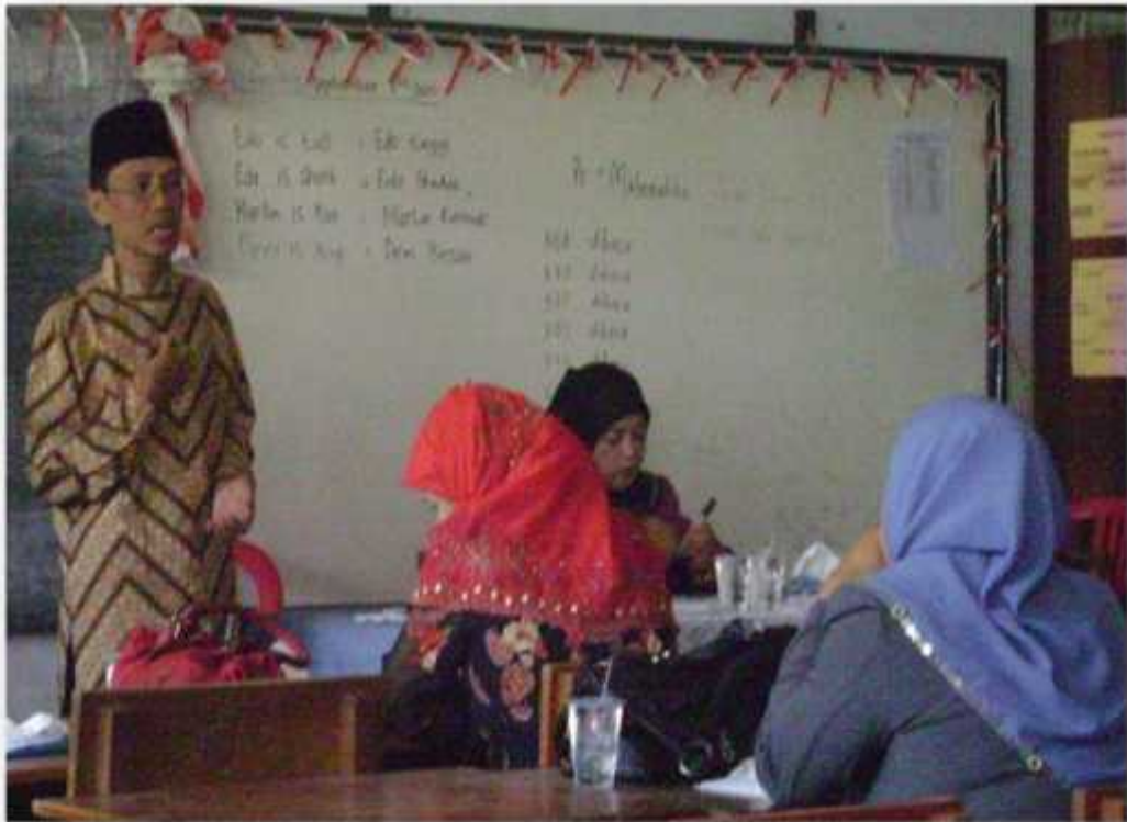
Foto Kegiatan Pelatihan Penyusunan Perangkat Pembelajaran (KKG) Oleh Pengawas MI di MI Fookuni Raha