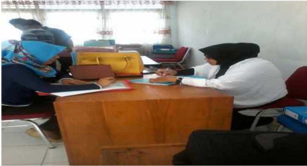
Wawancara dengan Pengawas PAI SD se-Kec.Katubu