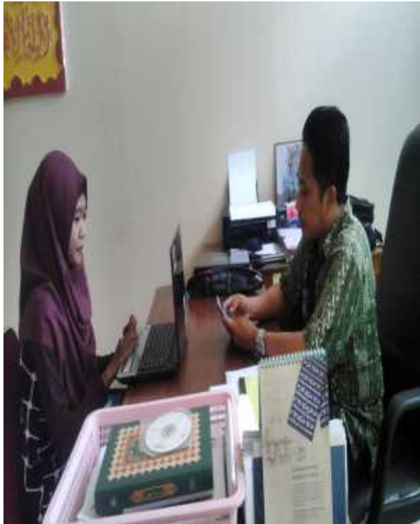
WAWANCARA DENGAN KETUA PROGRAM STUDI MANAJEMEN PENDIDIKAN ISLAM