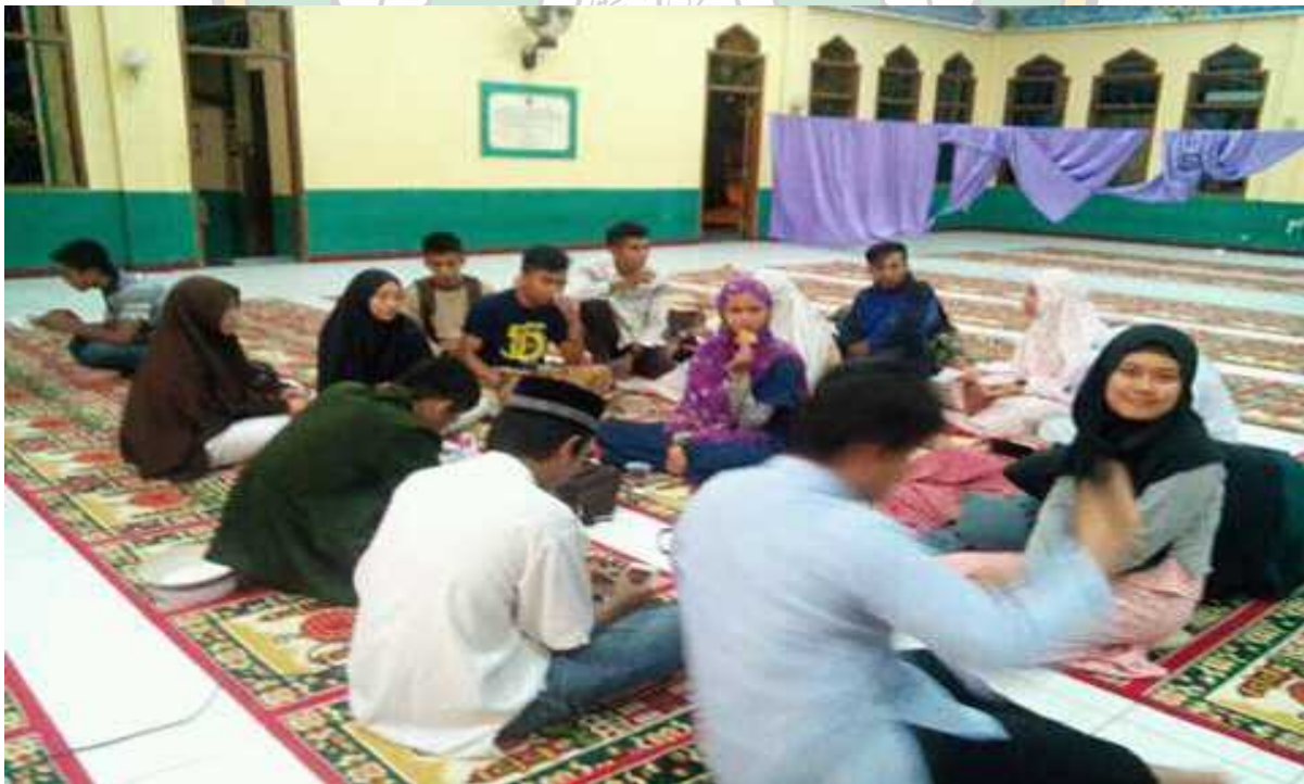
(KEGIATAN DI LUAR JAM PEMBELAJARAN, PEMBINAAN KARAKTER MELALUI KELOMPOK PENGAJIAN OLEH MAHASISWA PROGRAM STUDI MANAJEMEN PENDIDIKAN ISLAM)