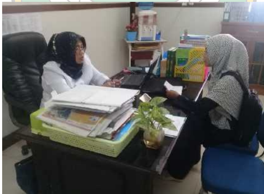
WAWANCARA DENGAN WAKIL DEKAN FAKULTAS TARBIYAH & ILMU KEGURUAN