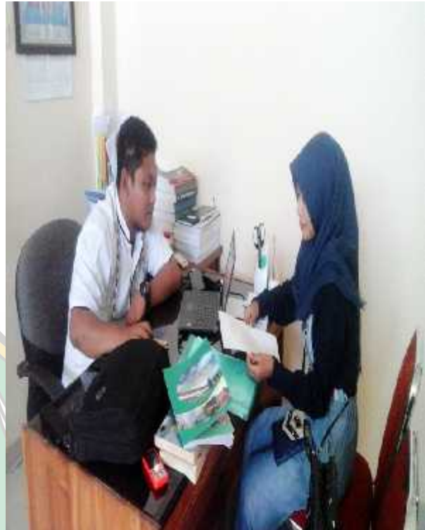
WAWANCARA DENGAN PENJAMIN MUTU PROGRAM STUDI MANAJEMEN PENDIDIKAN ISLAM