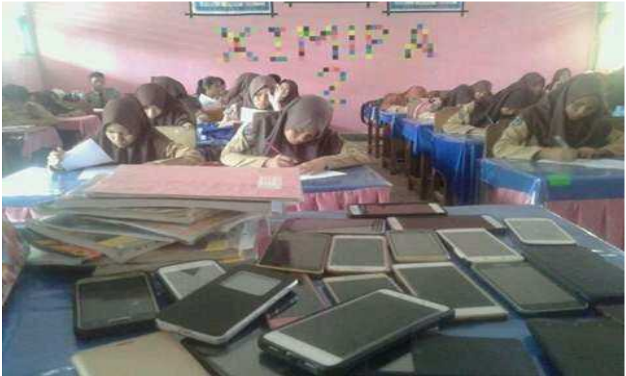
Gambar 1. Dokumentasi Suasana Tes