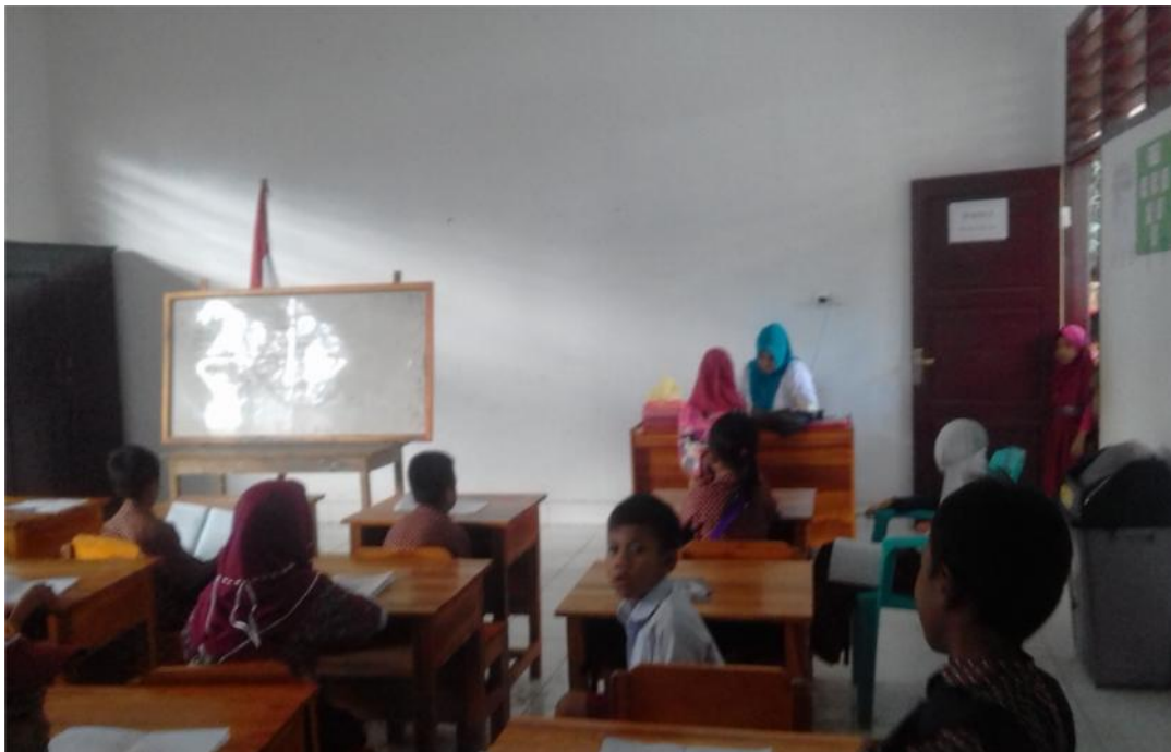
Sumber data: Jusnisar Isnani, A.M.a/ guru kelas III A