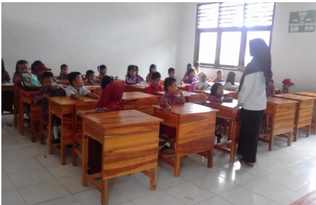
Sumber data: Siti Hajrah, S.Pd/ guru kelas I A