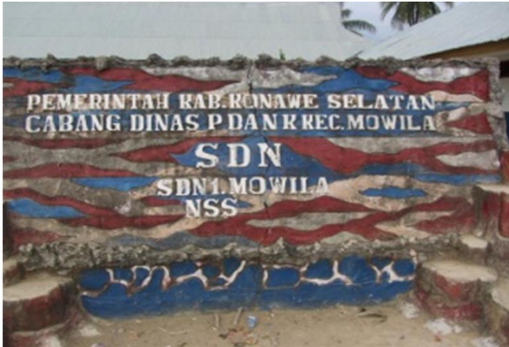
Sumber data: papanama sekolah SDN 1 Mowila