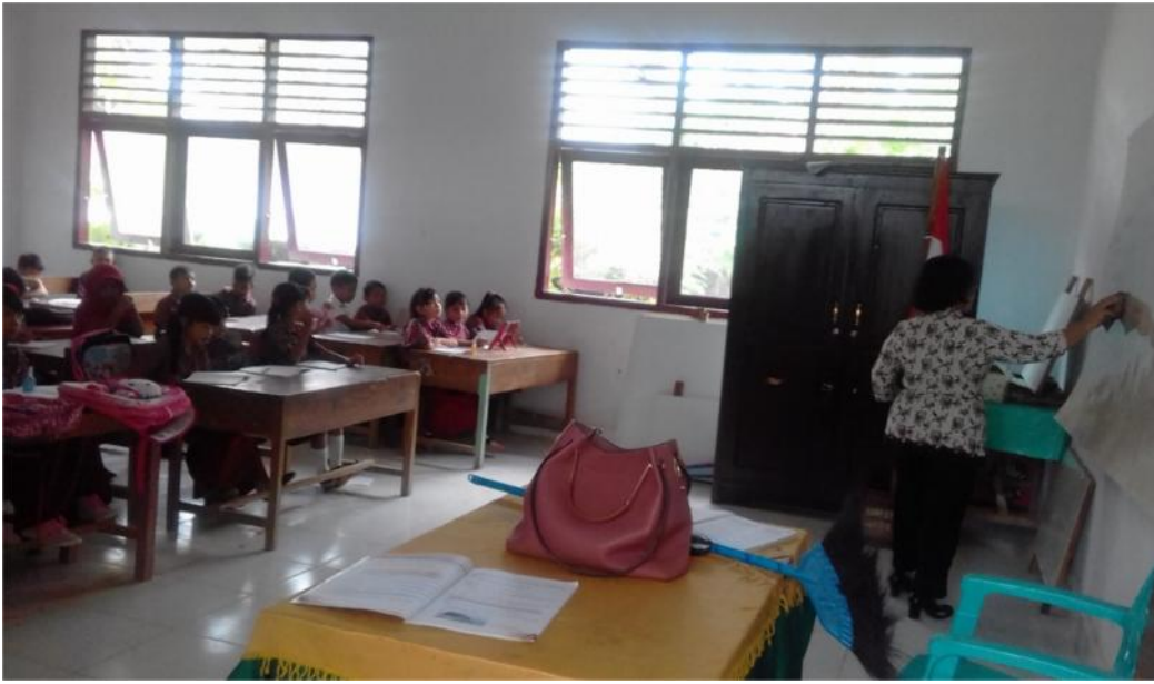
Sumber data : Elisabett Lisu, S.Pd. / guru kelas II