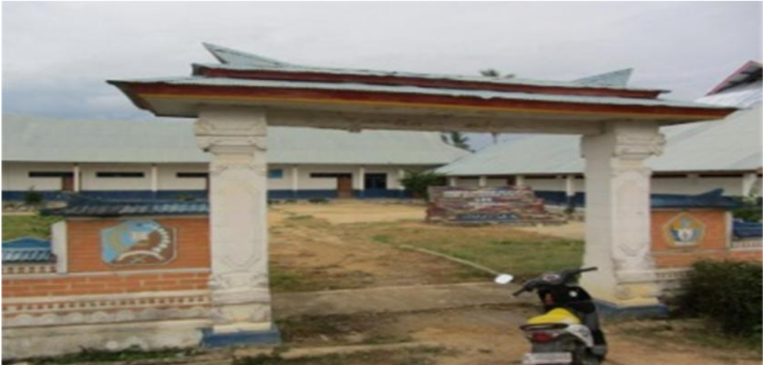
Sumber Data : Gedung Sekolah SDN 1 Mowila