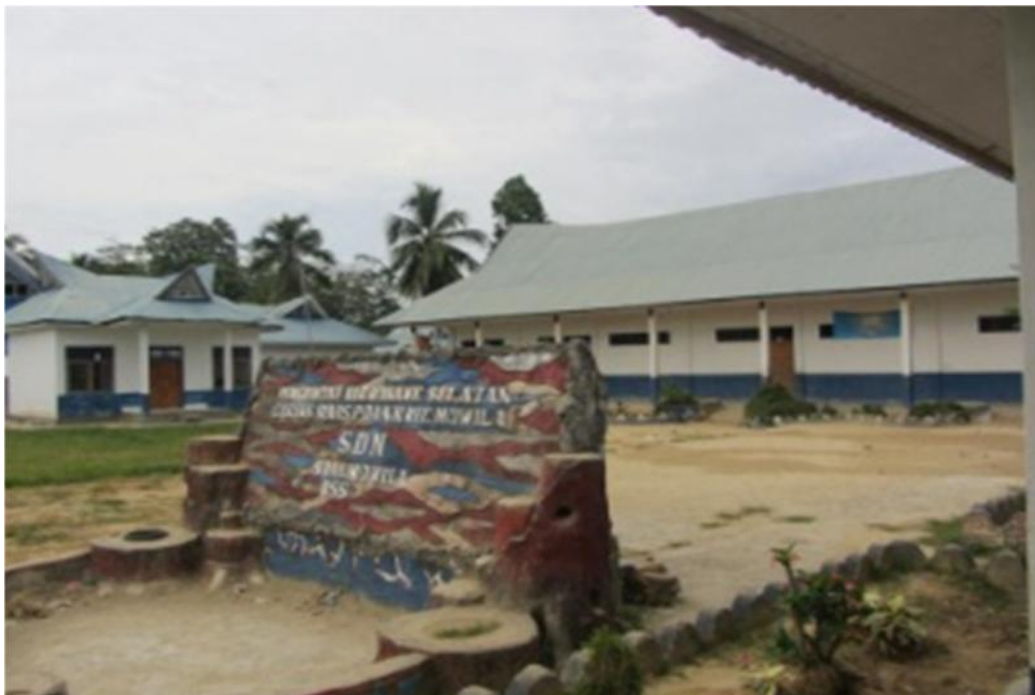
Sumber data: gedung sekolah SDN 1 Mowila