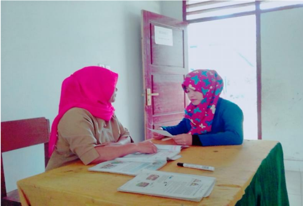
sumber data : wawancara Nur Aeni, A.M.a/guru kelas III B