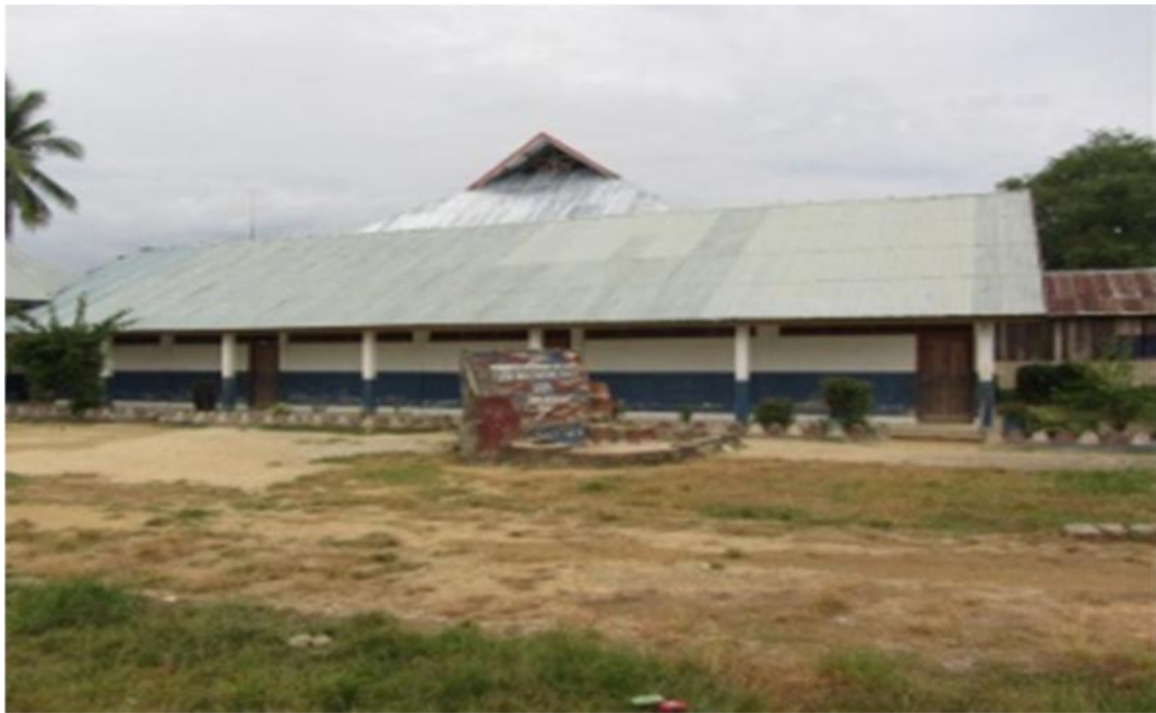
Sumber Data : Gedung Sekolah SDN 1 Mowila