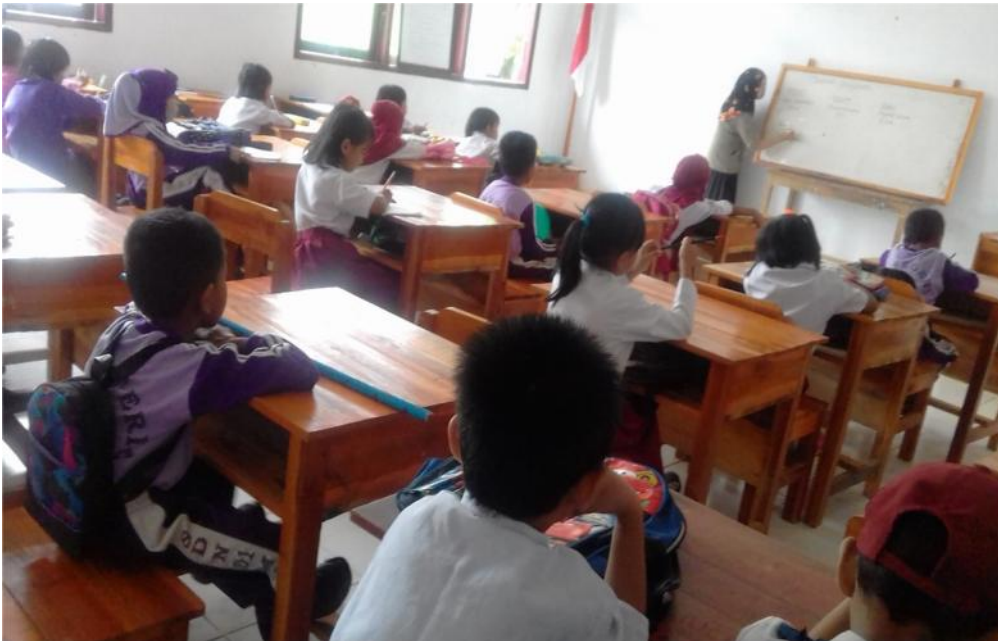
Sumber data : Suharni, A.m.a /guru kelas IV/ guru pendais