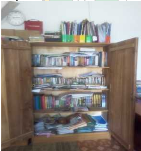
2. Perpustakaan SMP Pesra al-Amin