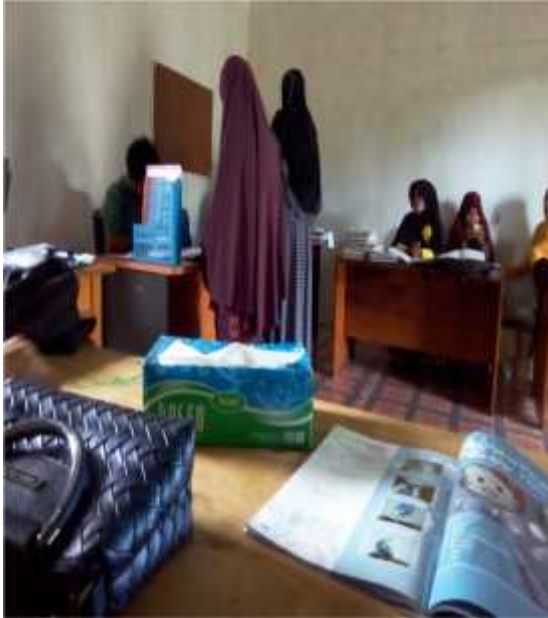
3. Pemeriksaan perangkat pembelajaran